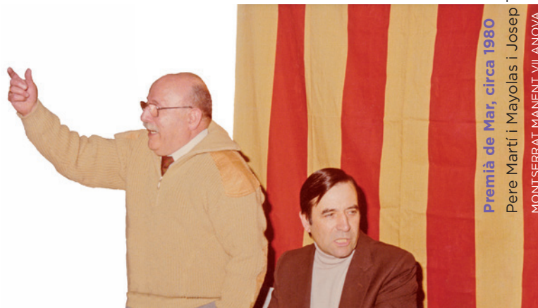
Premià de Mar, circa 1980