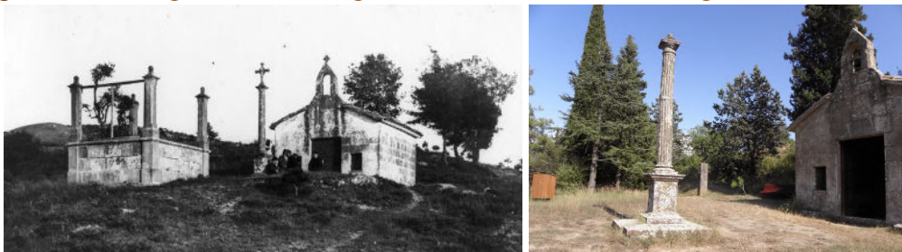
Imatges 13 i 14: Capella de la Desaparició, creu i clos abans i després de la Guerra Civil