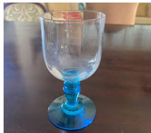
Imatge 4: Calze de Rotés durant la guerra

Un tret comú esmentat per moltes de les persones entrevistades és que aquests capellans amagats feien missa de forma clandestina diàriament: “deien missa cada dia” 25 , “la primera missa que me'n recordo que vaig anar... va ser allà a Les Planes” [casa de l'entrevistada] 26 . Fins i tot, es feien bateigs clandestins: “va batejar al meu germà a casa, que va néixer el 2 de febrer de 1938” 27 . A Rotés, com explica la Carmen, conserven una copa, mostrada a la imatge 4, amb la qual “donaven la comunió els capellans amagats a casa” 28 .