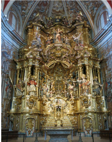
Imatge 7: Retaule major barroc de l’església del Miracle

Format per 3 cossos sobreposats, arriba a tenir unes mides impressionants (21,50 m x 14 m x 10 m) i la singularitat de tenir dues portes, gairebé ocultes i formant part del retaule mateix, que permeten accedir al cambril on es troba la Mare de Déu del Miracle.