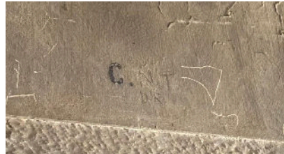
Imatge 28: Habitació de la CNT a la Casa Gran

S'allotjaven en una habitació, la qual era l'habitació “C” i, aprofitant la primera lletra, hi van escriure les lletres “N” i “T” per marcar aquella habitació com a seva.