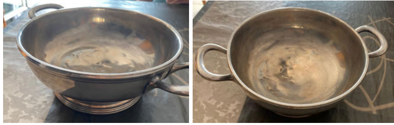
Imatge 27: Sopera dels refugiats de l'Avellanosa