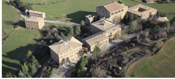
Imatge 2: Vista general del Miracle