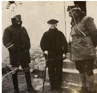
(annex 1.11)