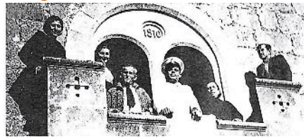
Imatge 24: Grup de malalts al balcó del Santuari (1936)

Durant la primavera del 1937 es va clausurar a causa de la progressiva manca de serveis, dificultat de les famílies per visitar els seus malalts i la falta de nous ingressos.