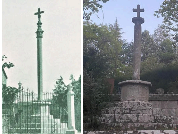
Imatges 11 i 12: Creu de l'Aparició abans i després de la guerra.