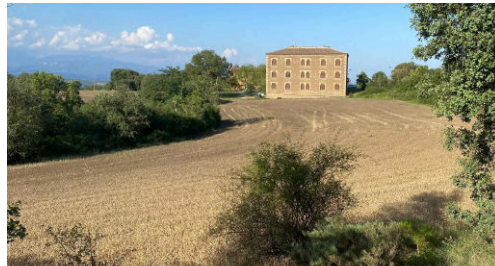
Imatge 26: Camp utilitzat com a cementiri

El Dr. Selga va dedicar unes paraules per aquest espai: “Existia un cementiri mal girbat en un petit planell de terra, sense creus ni esteles... D'aquest cementiri se'n perdrà el rastre, però del gran camp de conreu en continuaran dient el camp del cementiri. I el dia del judici final ressuscitaran entre plantes i flors amb perfum d'espiga de blat” 91 .