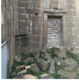
Imatge 25: Cantonada on col·locaven els difunts