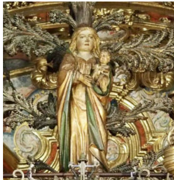
Imatge 6: Mare de Déu del Miracle actual (segle XV)