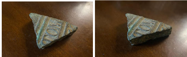
Imatge 15: Tros d'una campana de Riner