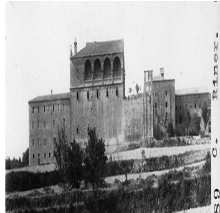
Imatge 3: Santuari del Miracle, 1929

Quan la Guerra Civil va esclatar, el Santuari del Miracle es va convertir en un lloc susceptible als atacs, ja que hi havia una comunitat de monjos benedictins i moltes peces artístiques de caràcter religiós, cosa que grups descontrolats, antireligiosos, volien destruir.