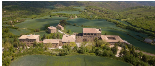
Imatge 1: Santuari del Miracle

El Santuari del Miracle, Riner (Solsonès), és un centre religiós constituït per un conjunt arquitectònic que engloba l’església, el monestir benedictí, la Casa Gran, la Capella de la Desaparició i la Casa d’Espiritualitat. El 22 d’abril de 2008, l’espai va ser declarat Bé Cultural d’Interès Nacional.