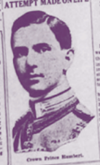
Crown Prince Benedict.

Princess, Deeply Moved, Falls into Finer's Arms and Kisses Him