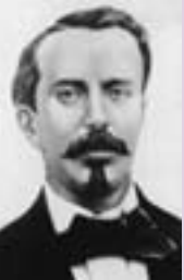
Carlos Manuel de Céspedes (1819-1874) Líder independentista cubà