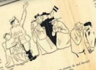
-I bé, senyor Canals, i si la cosa canvia de mal benicò? -No tinc cap dubte. Talment talment possible.

El dia 24 d'agost, a les 10 del matí, es va celebrar a Serra Moret una conferència sobre el tema "El socialisme i el camí ascendent". La conferència va ser presidida pel Sr. Serra Moret i va comptar amb la participació de diversos oradors. Els temes tractats van ser: el paper del socialisme en l'època actual, el camí ascendent i les condicions per a la seva realització.