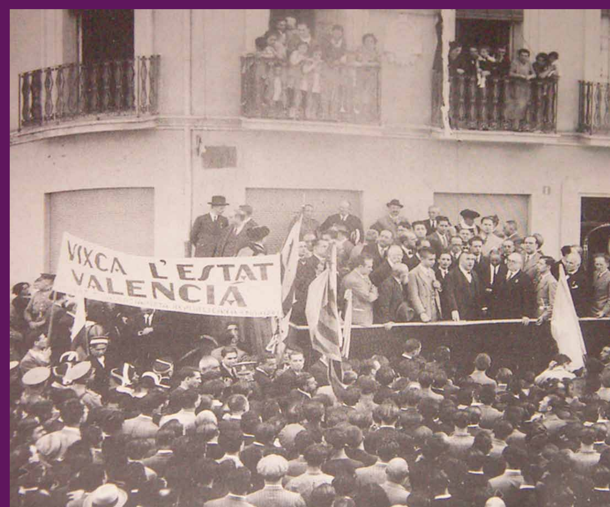
Manises? 9 d'octubre de 1932? Des de la Declaració Valencianista de 1918, l'objectiu d'un Estat Valencià forma part de l'univers reivindicatiu del valencianisme polític.