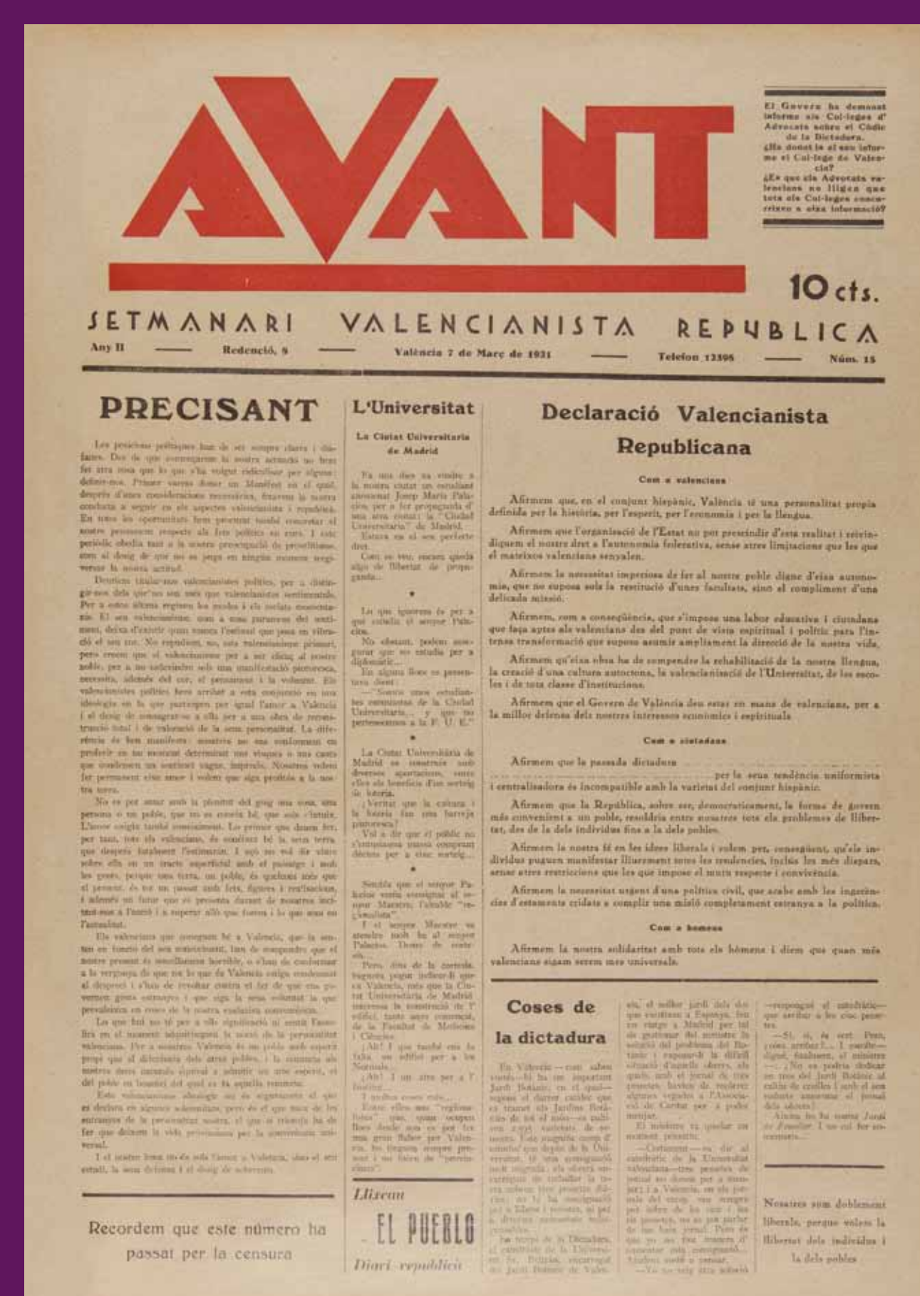
València, 7 de març de 1931 Avant , el portaveu de l'Agrupació Valencianista Republicana publica la Declaració Valencianista Republicana, mutilada per la censura d'un règim agonitzant.