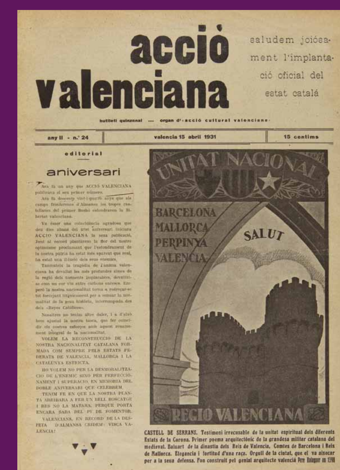
València, 15 d'abril de 1931 Acció Valenciana . El quinzè aniversari d'Acció Cultural Valenciana saluda la República Catalana, l'endemà de la seua proclamació a Barcelona per part de Francesc Macià, alhora que afirma la pertinència del País Valencià a la nacionalitat catalana.