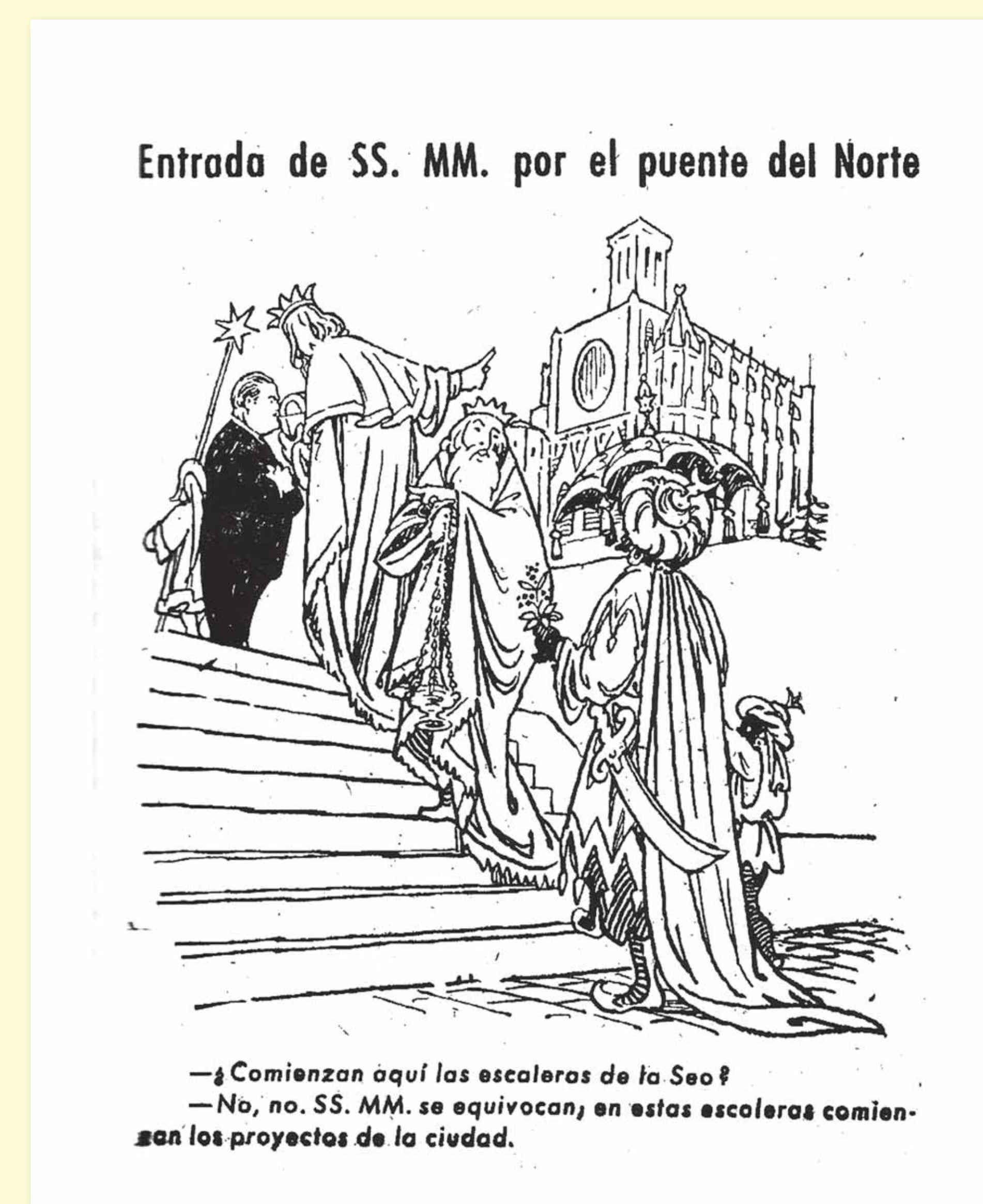
▲ Aquest acudit de Joan Vilanova, publicat al diari del règim Manresa, critica el fet que el nivell del pont que es va fer als anys 1940 era dos metres més alt que la carretera i va caldre fer una escala perquè fos útil.