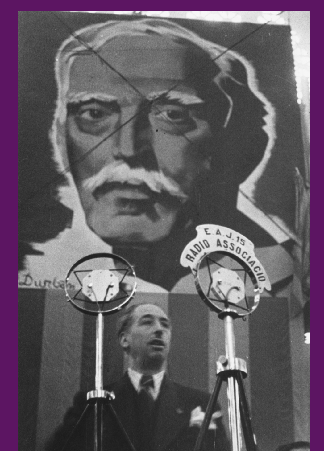
Barcelona, 27 desembre 1936 El president Companys, sota un retrat de Macià en el miting celebrat per Esquerra al Palau de Belles Arts de Montjuïc commemorant els tres anys de la mort de l'expresident.