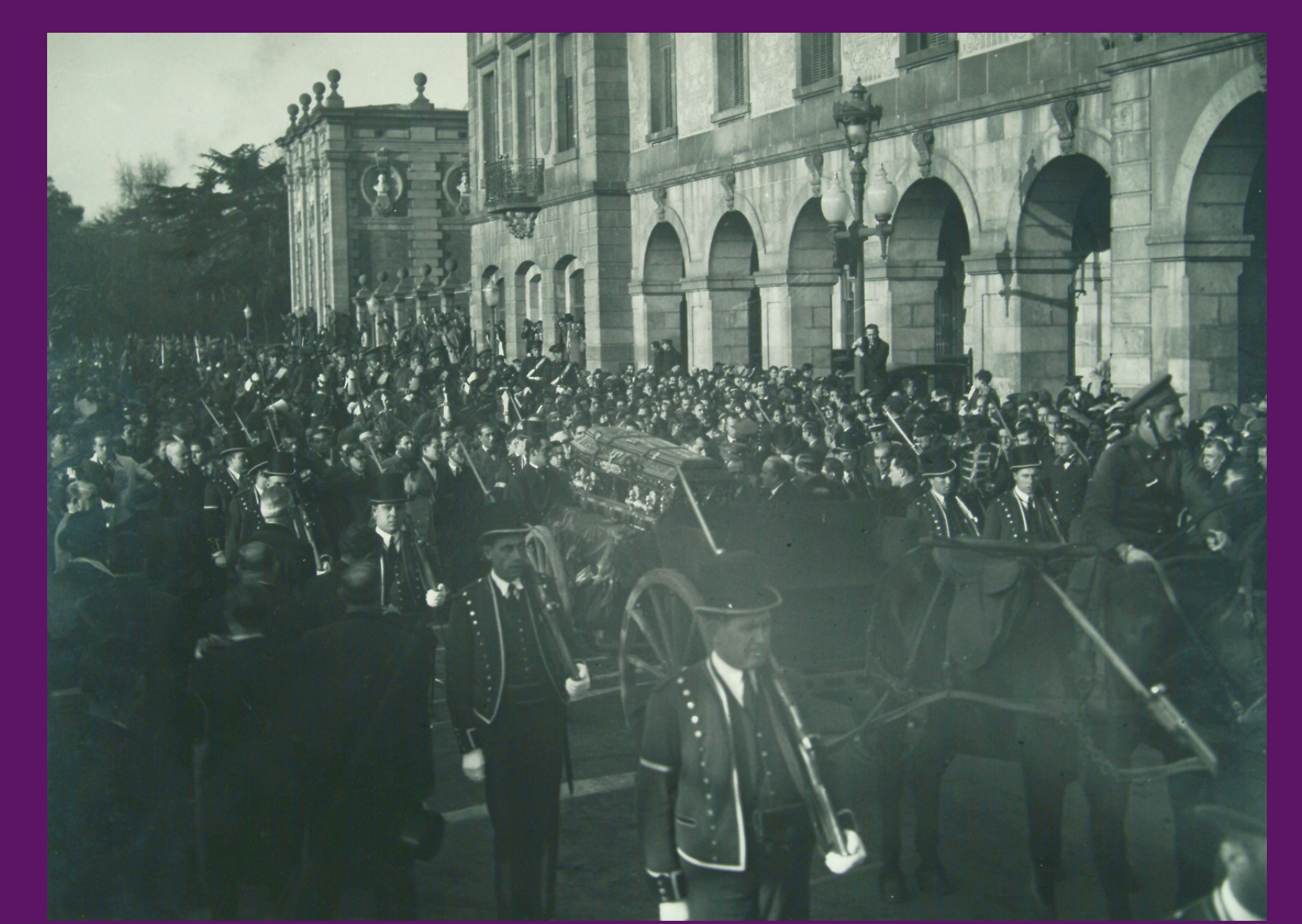
Barcelona, 27 desembre 1933 El fèretre del president Macià, sobre un armó d'artilleria escoltat per la guàrdia d'honor dels mossos d'esquadra al seu pas per davant del Parlament de Catalunya.