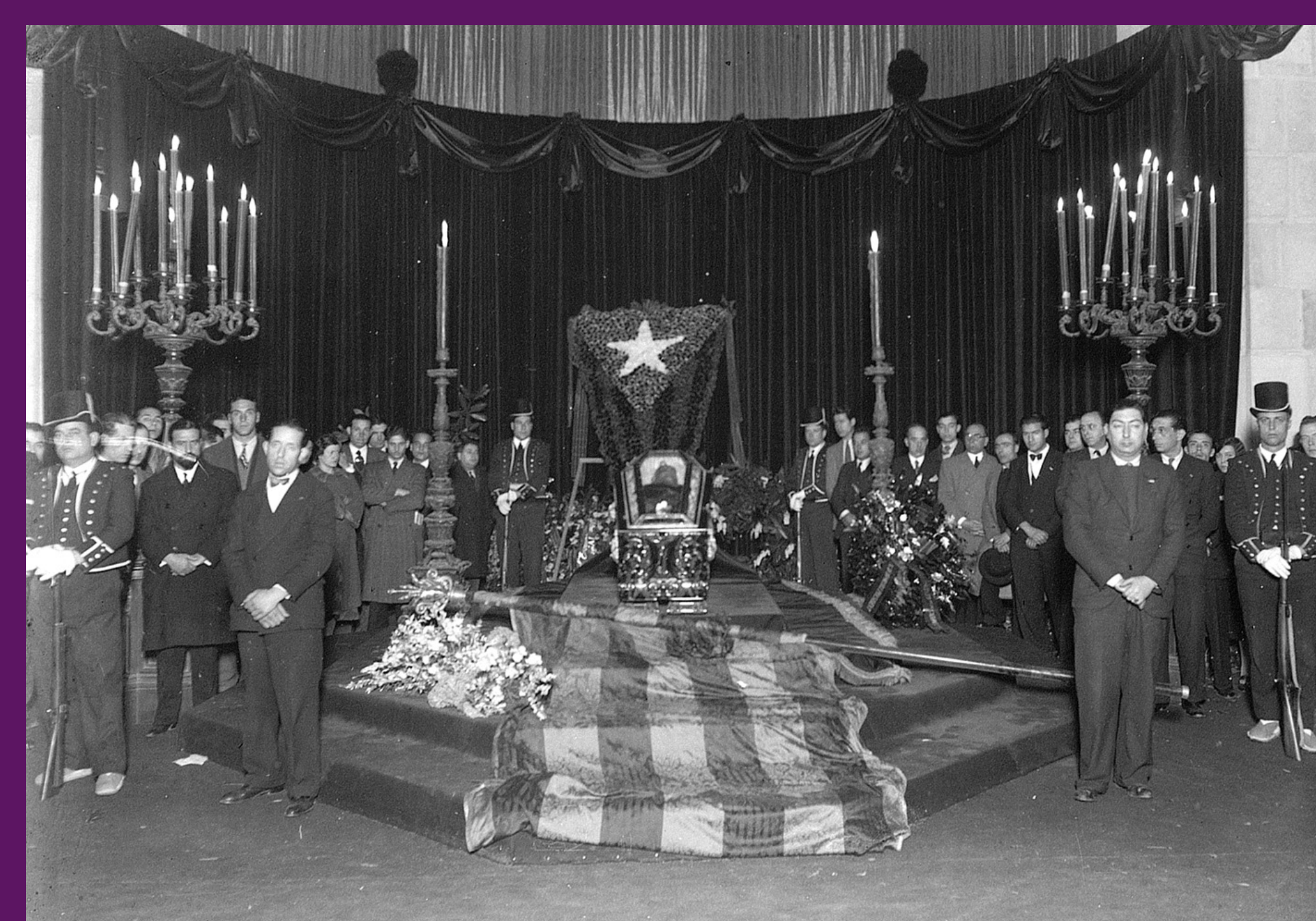
Barcelona, 26 desembre 1933 El fèretre del president Macià exposat al Saló de Sant Jordi del Palau de la Generalitat.