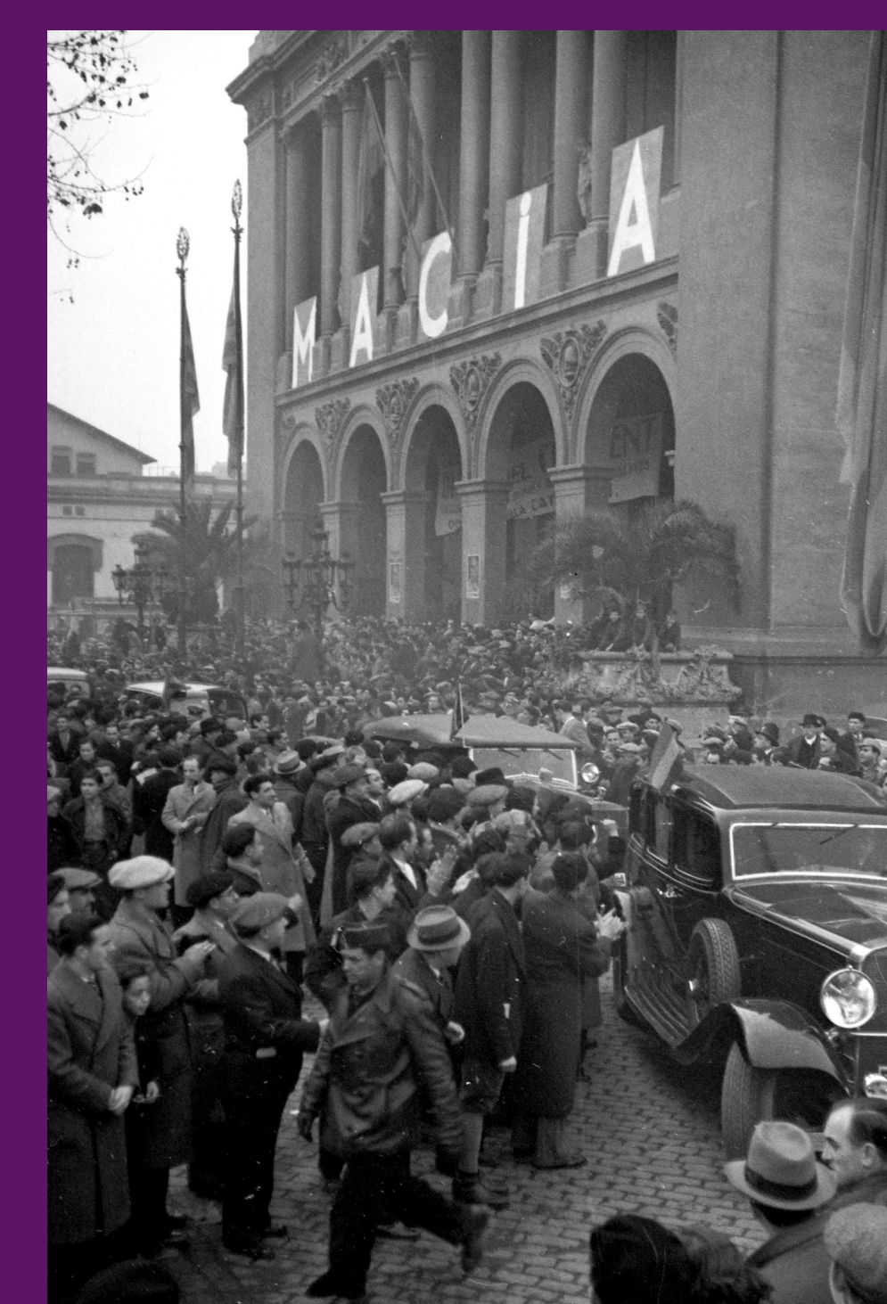
Barcelona, 27 desembre 1936 Entrada al miting celebrat per Esquerra al Palau de Belles Arts de Montjuïc commemorant els tres anys de la mort de Macià, en plena Guerra Civil.