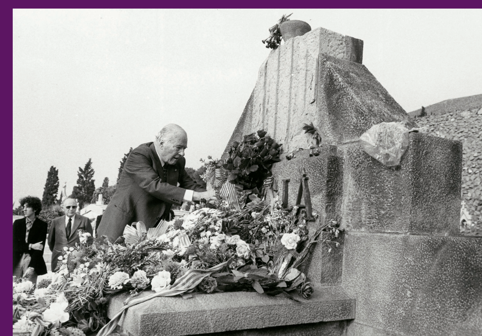
26 octubre 1977 El president Josep Tarradellas, acabat d'arribar de l'exili, realitzant una ofrena a la tomba de Francesc Macià.