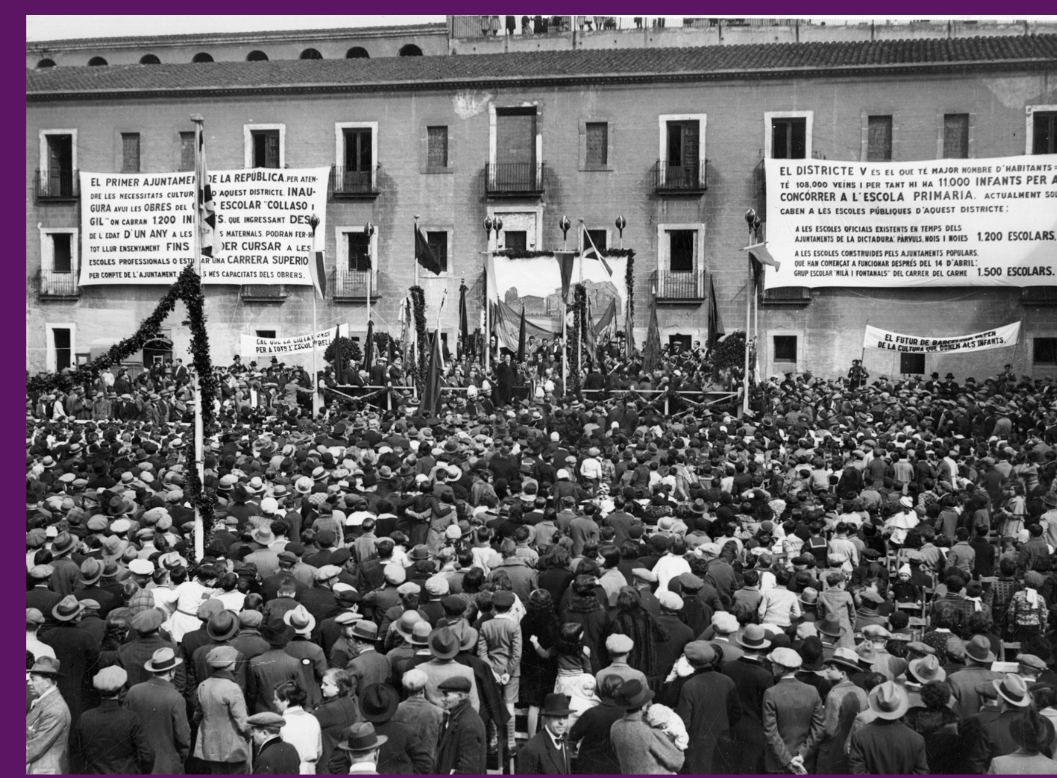
Barcelona, 6 març 1932

Acte d'inauguració de les obres del centre escolar Collaso i Gil.