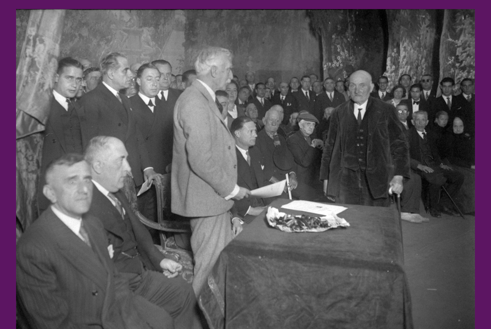
Barcelona, 30 octubre 1932

Francesc Macià lliura una llibreta de pensions a un home dins de l'acte de celebració de la IV Festa Mutualista i III Tribut d'Homenatge a la Vellesa Mutualista, al Teatre Novedades.