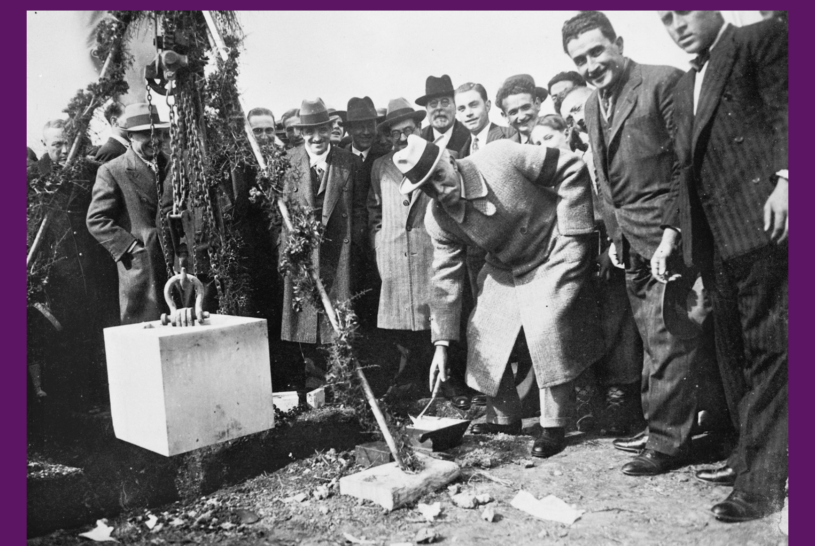
Sabadell, 5 març 1933

Francesc Macià acompanyat de Claudi Ametlla, governador civil de Barcelona, i de les autoritats locals, entre altres, durant l'acte de col·locació de la primera pedra d'un centre escolar.