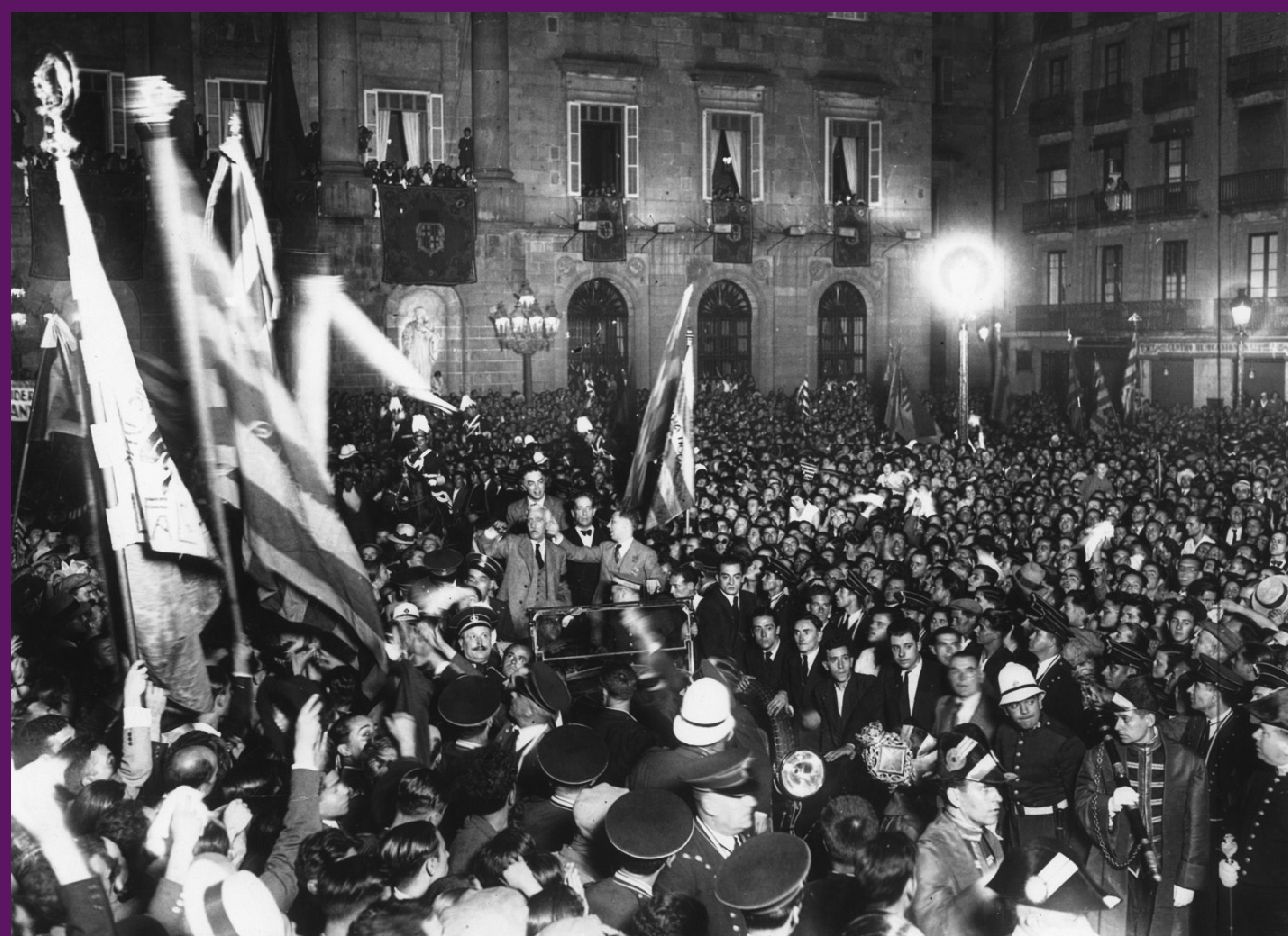
Barcelona, 10 setembre 1932 Francesc Macià i Lluís Companys són rebuts triomfalment a la Plaça de Sant Jaume després de l'aprovació de l'Estatut d'autonomia a les Corts espanyoles.