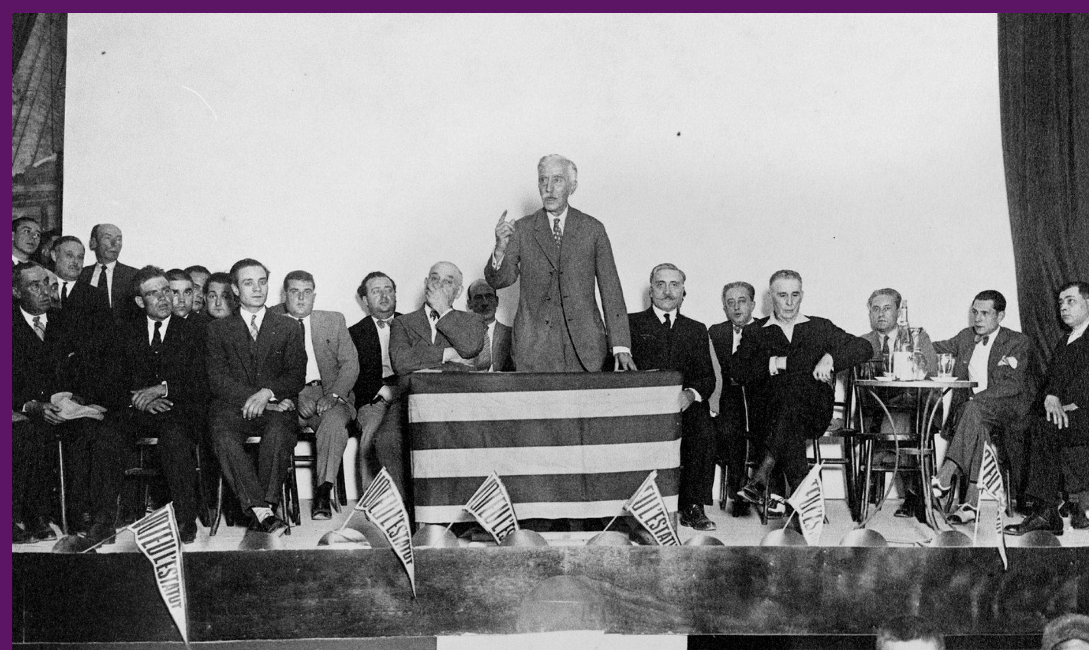
Tremp, juliol 1931 Macià es dirigeix als assistents a un Miting pro-Estatut.