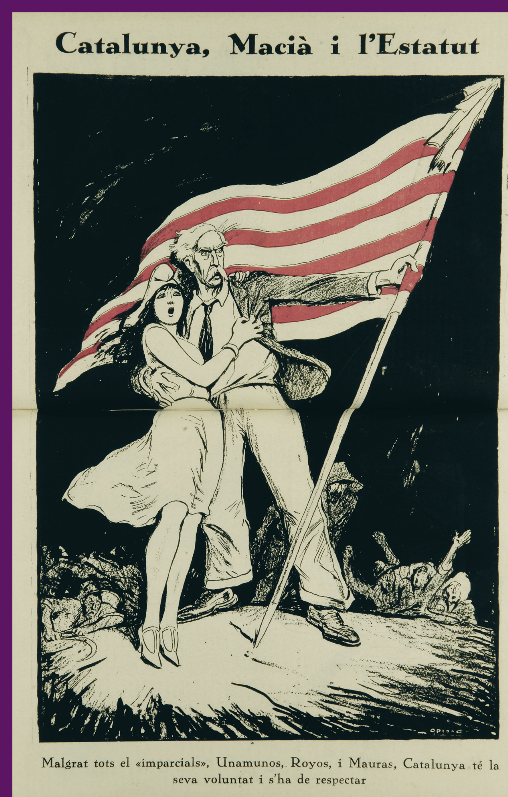
27 maig 1932 L'Esquella de la Torratxa reclama respecte a la voluntat de Catalunya.