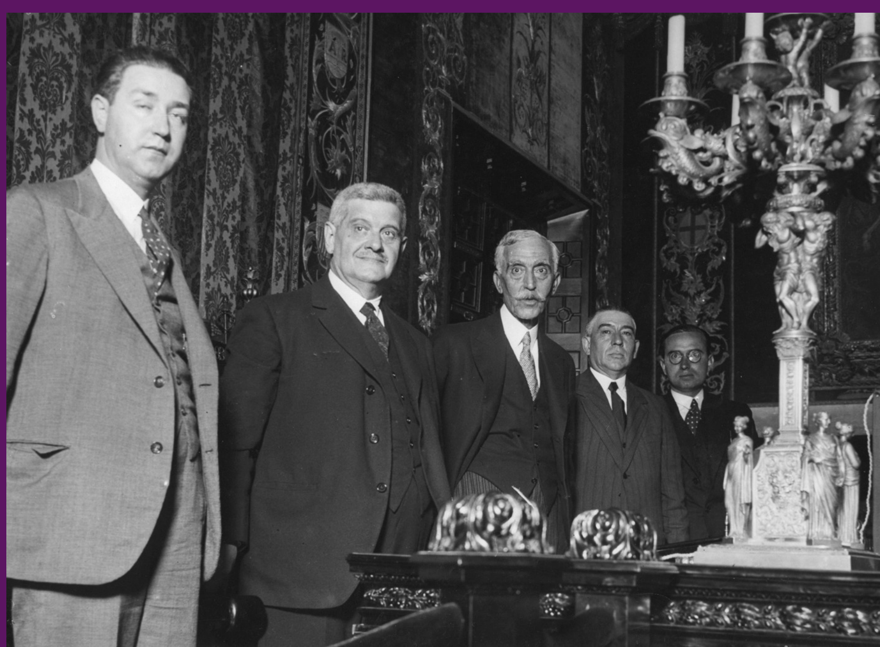
Barcelona, 10 juny 1931 El president de la Generalitat de Catalunya, Francesc Macià, entre els membres de la Diputació Provisional de Catalunya encarregats de redactar el projecte d'Estatut d'Autonomia. D'esquerra a dreta: Martí Esteva, Jaume Carner, Francesc Macià, Josep Irla i Josep Dencàs.