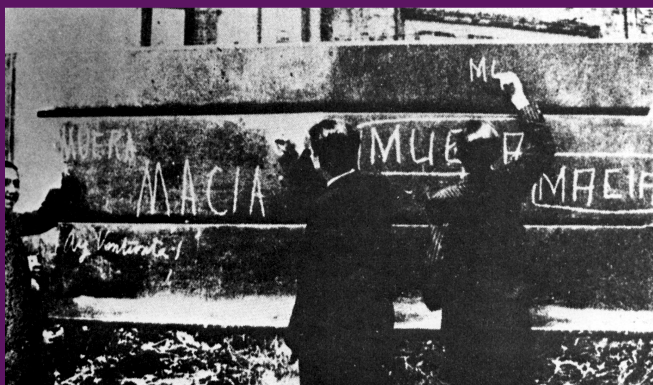
Sevilla, maig 1932 Estudiants espanyolistes oposats a l'autonomia catalana escriuen amb guix «¡Muera Macià!»