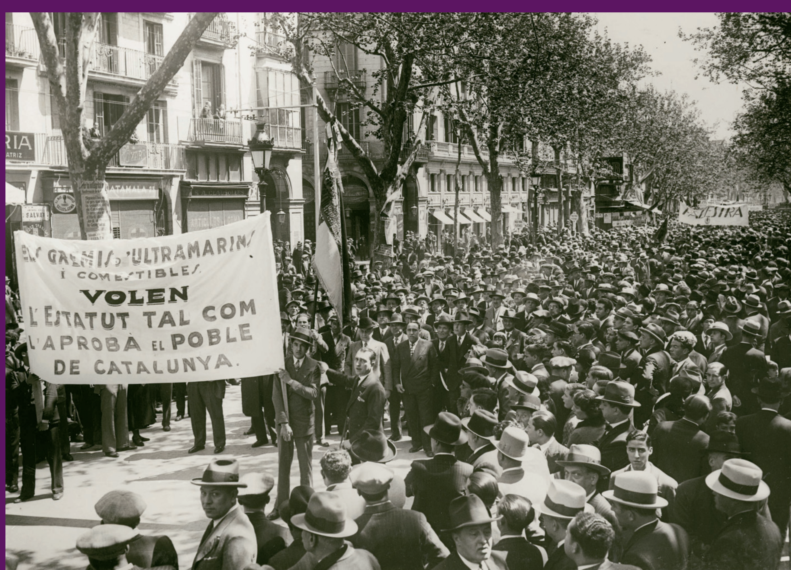
Barcelona, 24 abril 1932 Vuit mesos després de la seva aprovació, les Corts espanyoles encara no havien aprovat l'Estatut. La manifestació pro-Estatut convocada aplegà centenars de milers de persones.