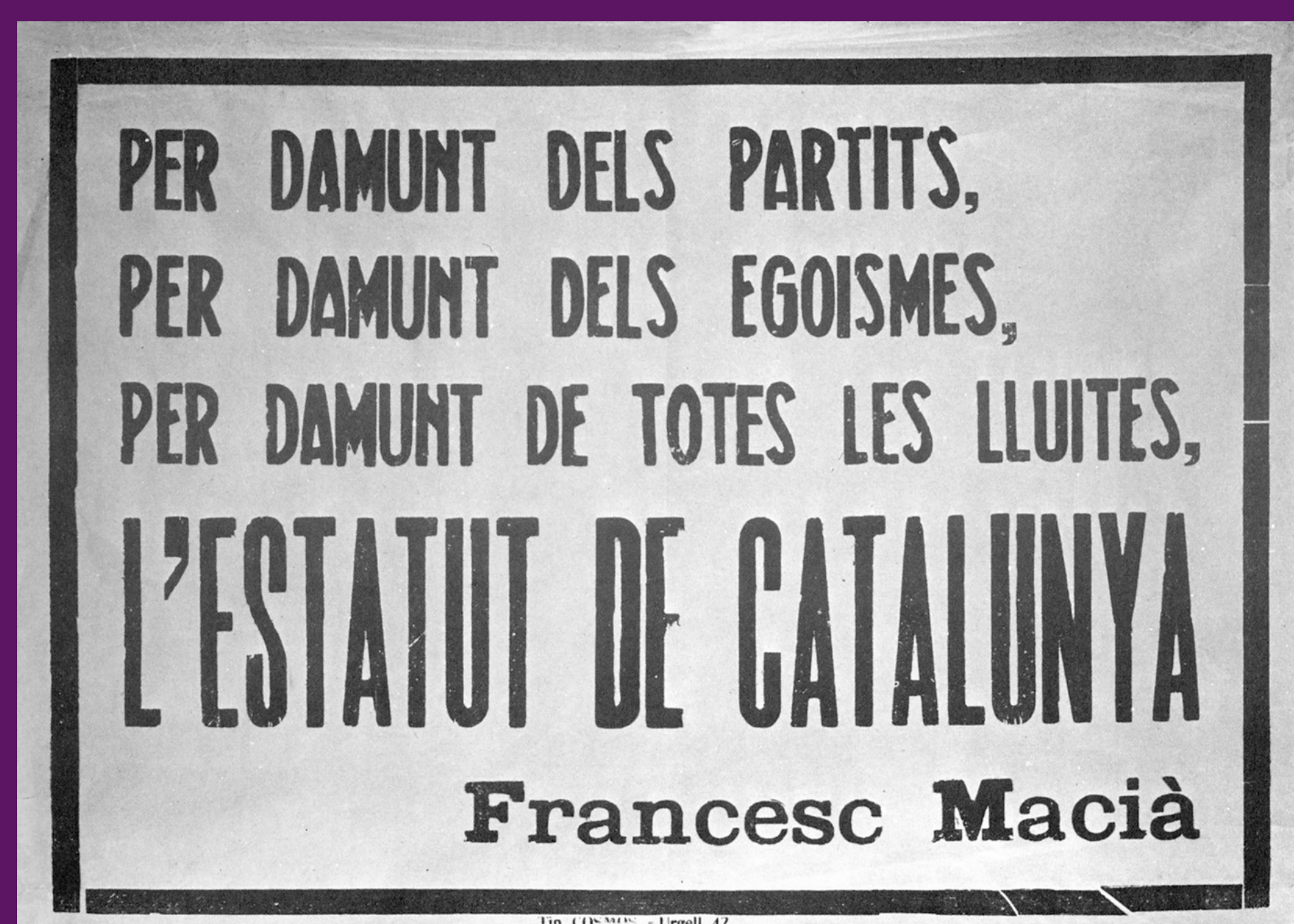
Juliol 1931 Cartell pro-Estatut