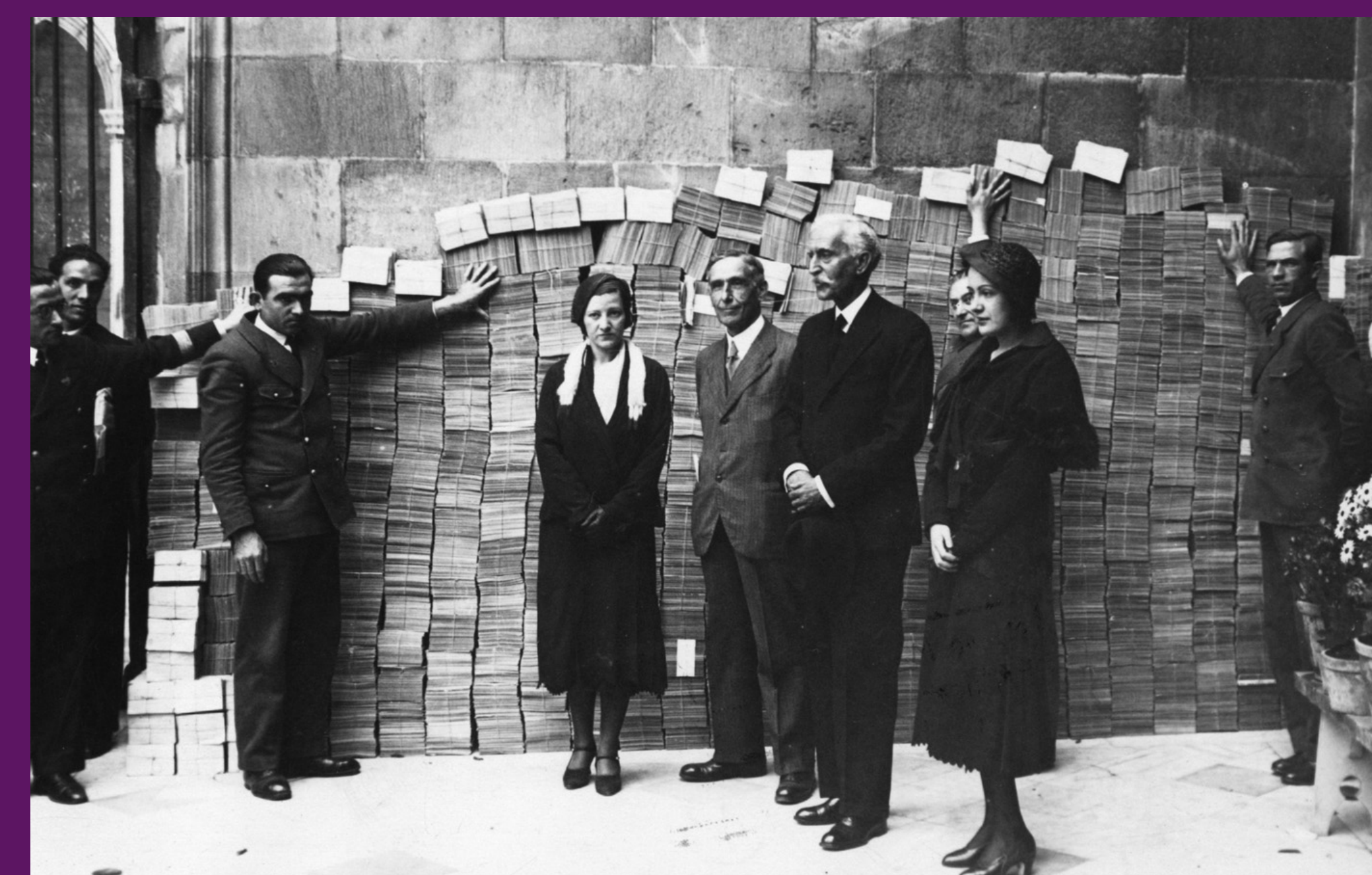
Barcelona, 12 maig 1932 Pompeu Fabra entrega a Francesc Macià milers de postals signades en suport de la campanya "Estatut íntegre" endegada per Palestra.