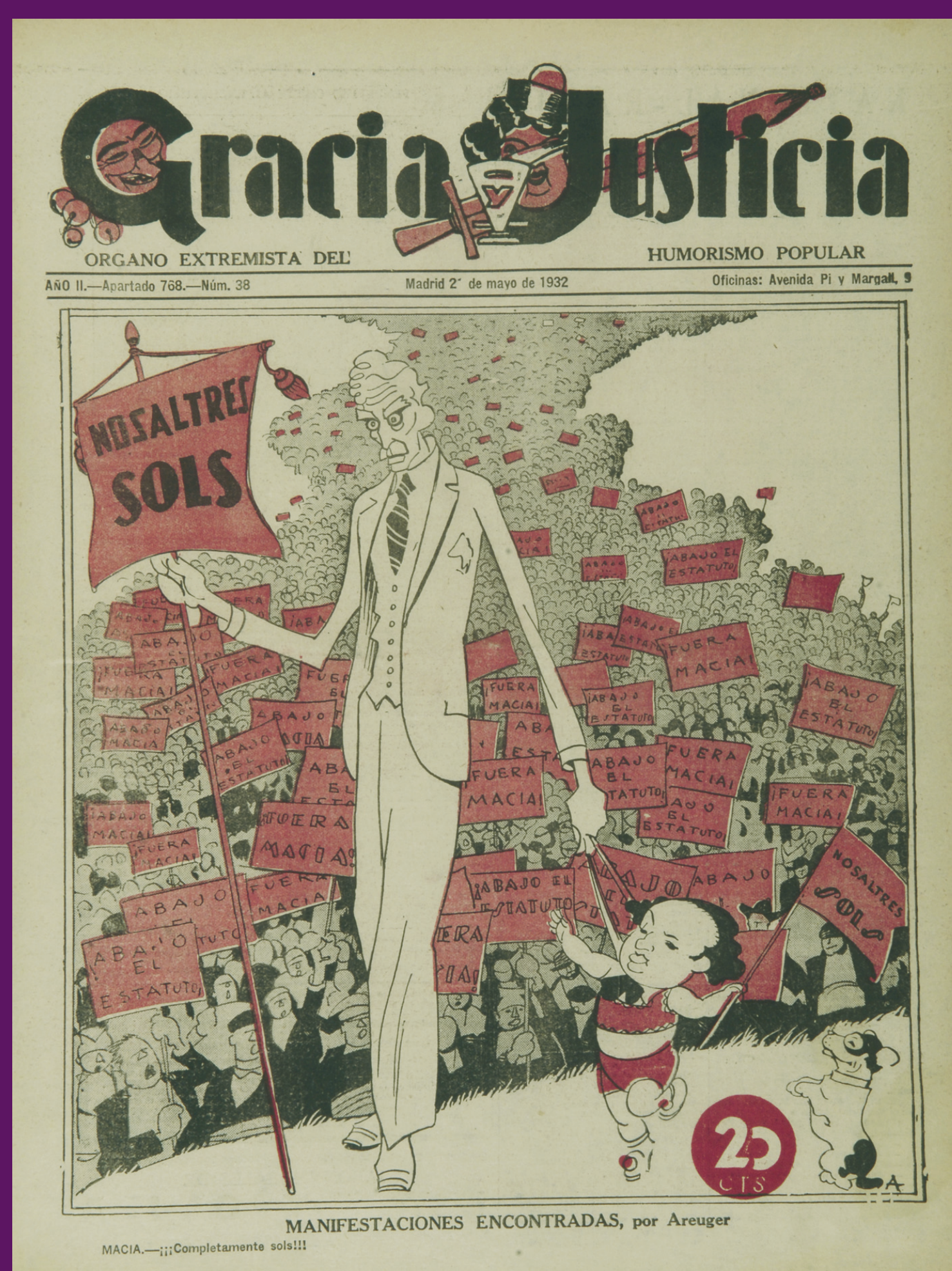
2 maig 1932 La revista satírica espanyola Gracia y Justicia , també participà en la campanya antiestatutària desfermada a tot l'Estat.