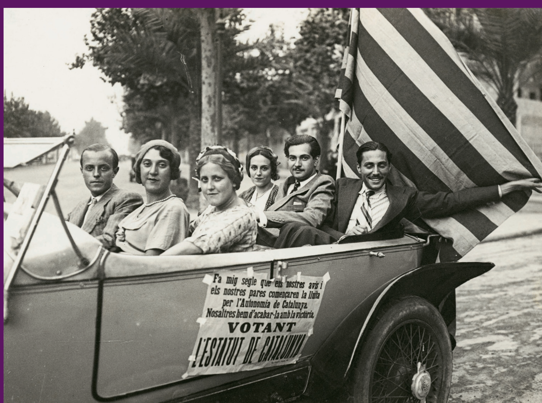
Barcelona, 2 agost 1931 Després de més de mig segle de lluita, Catalunya tenia a tocar l'Estatut llargament desitjat.