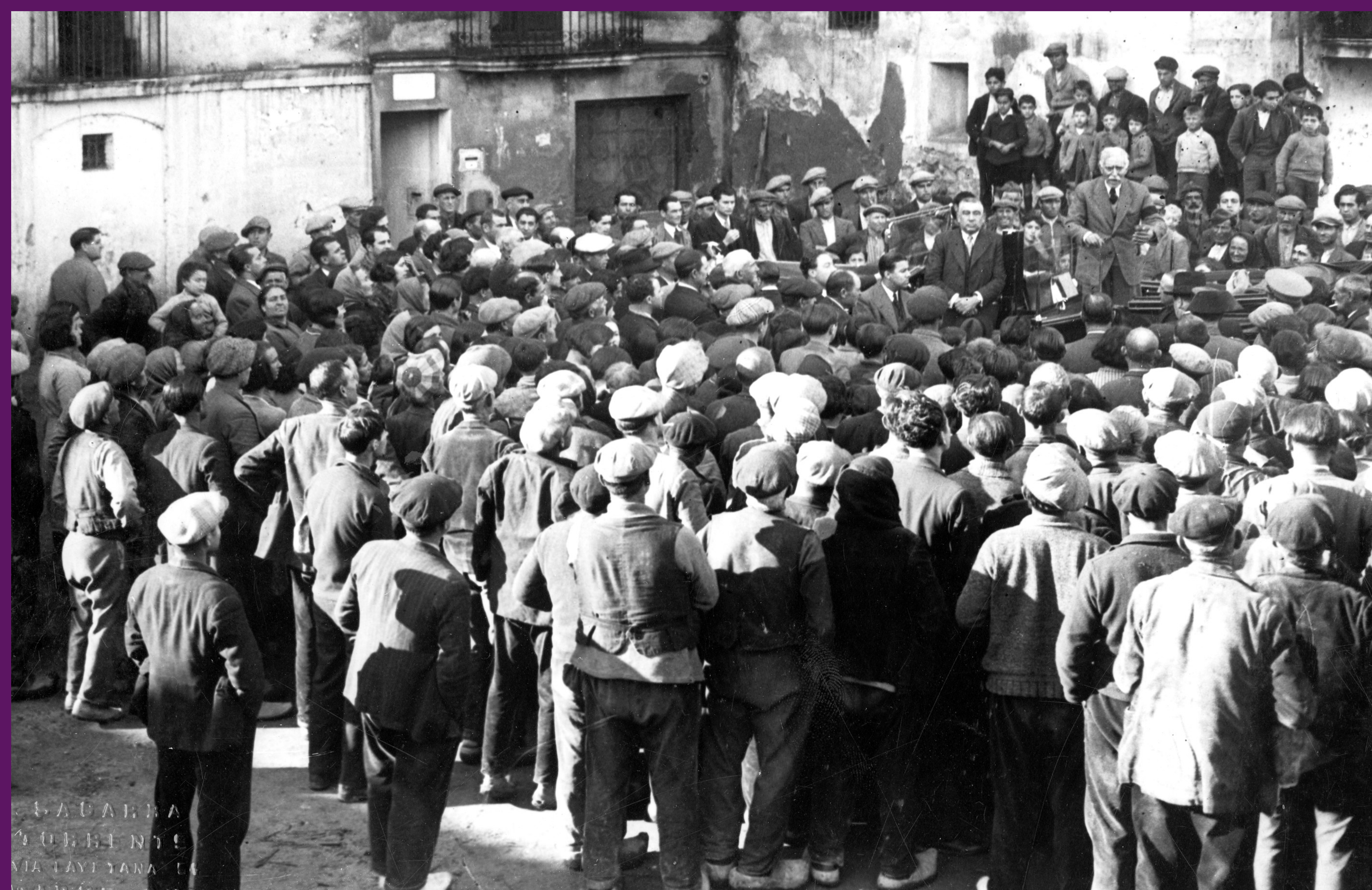
Sant Pere Pescador, 23 desembre 1932 Francesc Macià, en presència de Josep Irla, dirigint-se al públic assistent a un miting a peu de carrer.