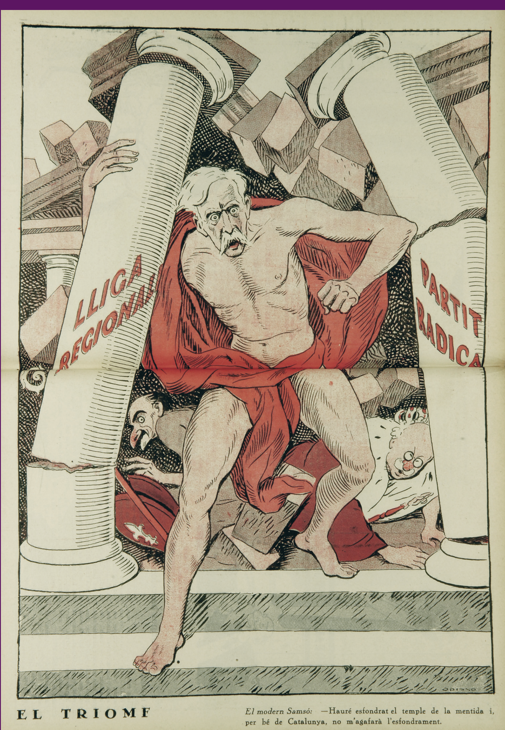
25 novembre 1932 La victòria d'Esquerra i Macià a les eleccions al Parlament de Catalunya vista per L'Esquella de la Torratxa , significa la fi del bipartidisme entre la Lliga Regionalista i el Partido Republicano Radical de Lerroux que havia dominat la política catalana durant les primeres dècades del segle XX. Ricard Opisso / BC