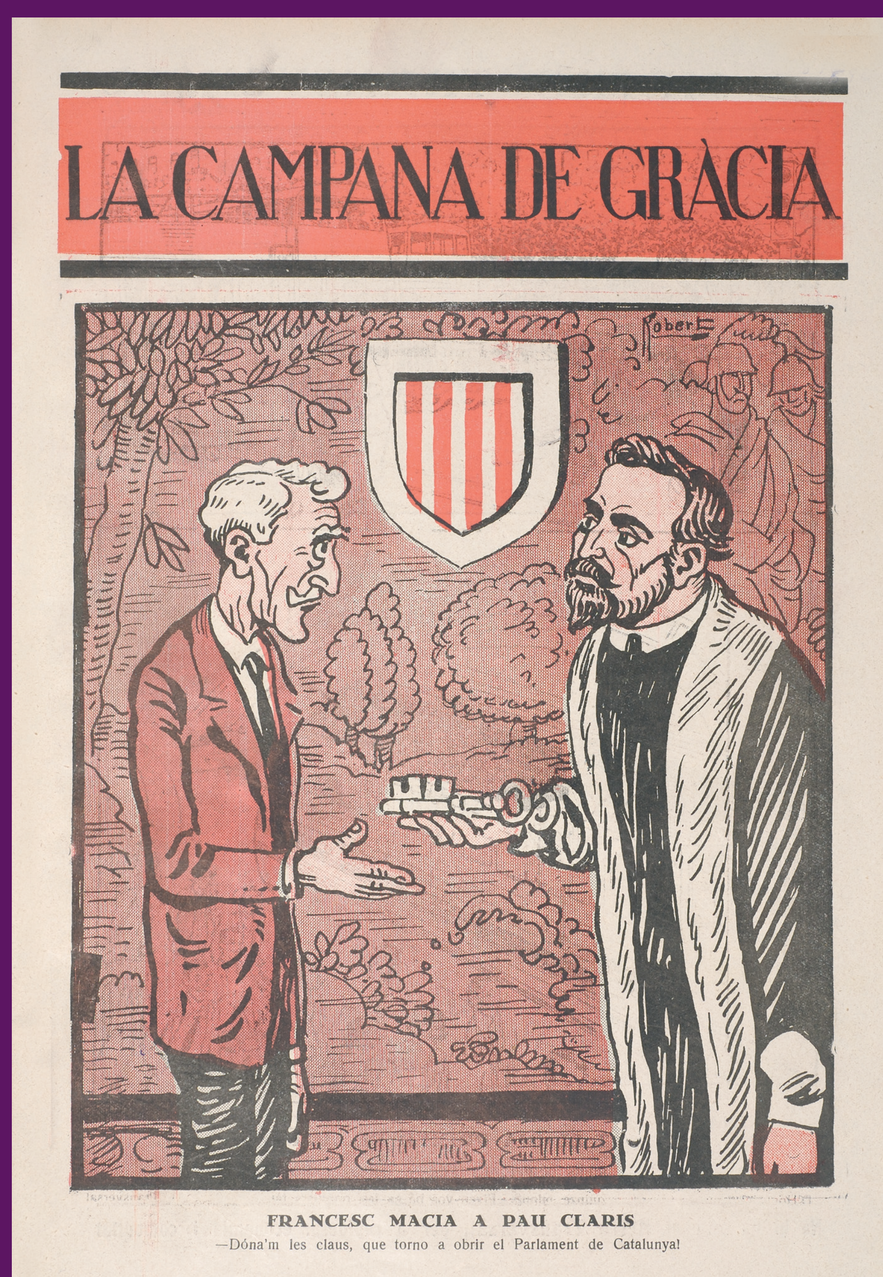
3 desembre 1932 La Campana de Gràcia recull la reobertura del Parlament de Catalunya amb aquesta al·legoria entre Francesc Macià i Pau Claris.