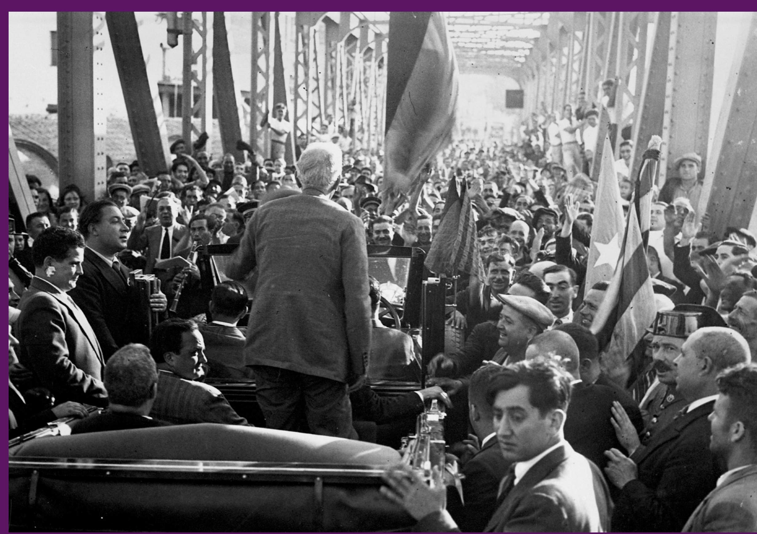
Móra d'Ebre, 28 agost 1933 Francesc Macià, des del cotxe descobert, saluda la multitud que ha sortit a rebre'l. L'acampament el seu secretari, Joan Alavedra, i el conseller de Cultura, Ventura Gassol.