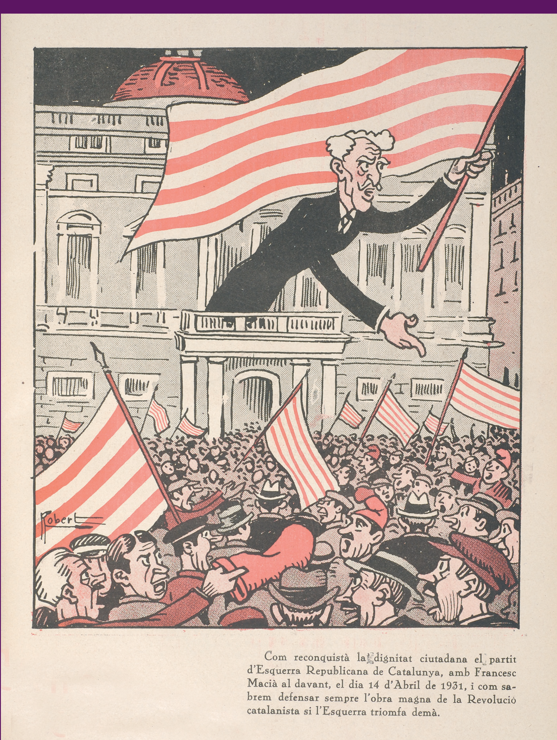
Com reconquistà la llibertat ciutadana el partit d'Esquerra Republicana de Catalunya, amb Francesc Macià al davant el dia 14 d'abril de 1931, i com sabem defensar sempre l'obra magna de la Revolució catalana i l'Esquerra triomfa demà.