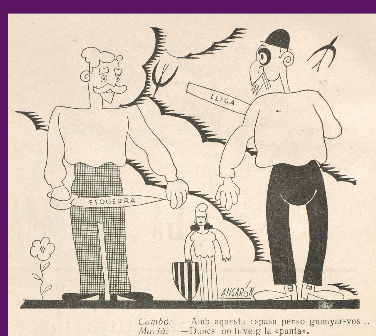
13 novembre 1932 Acudit de La Campana de Gràcia , durant la campanya electoral al Parlament de Catalunya. Angarón / AHCB-Hemeroteca