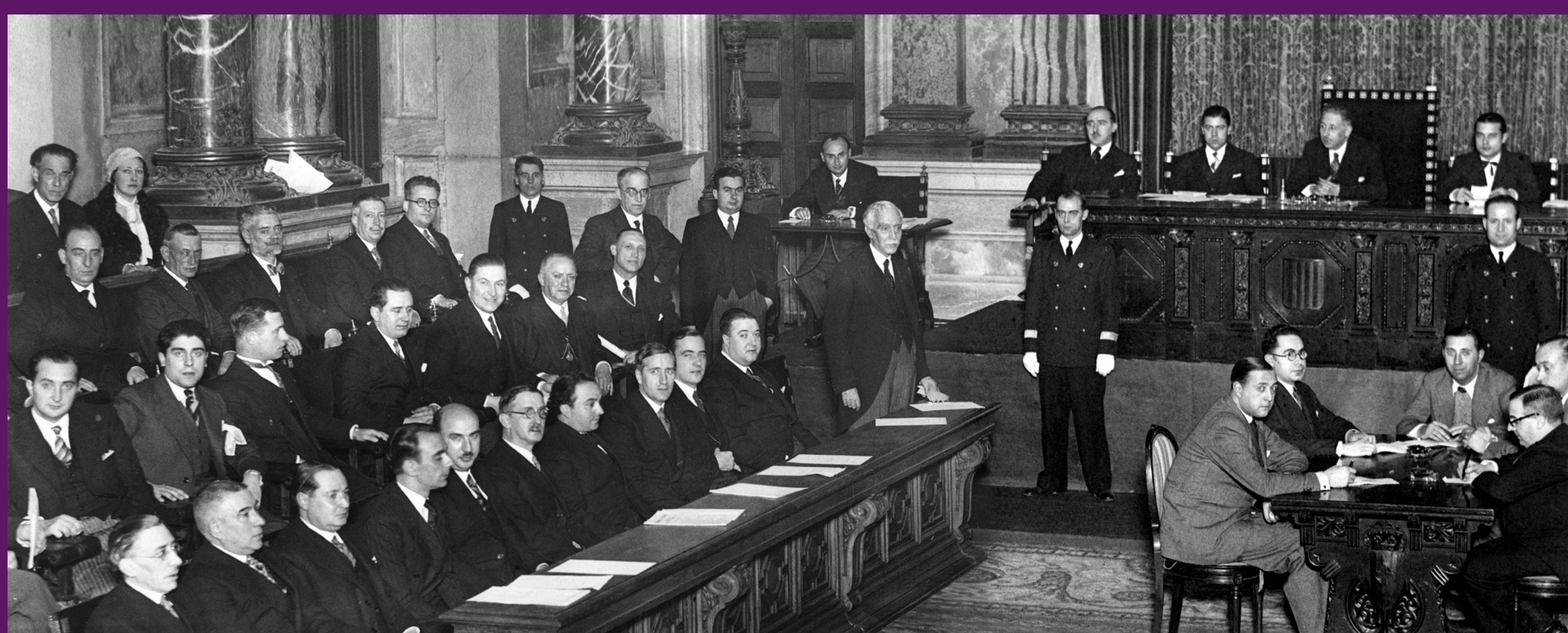
Barcelona, 6 desembre 1932 Investidura de Francesc Macià com a president de la Generalitat en un Parlament presidit per Lluís Companys.