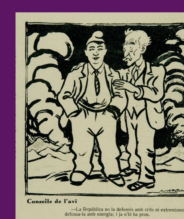
22 maig 1931 Vinyeta publicada a L'Esquella de la Torratxa. Josep Costa «Pícaro» / BC