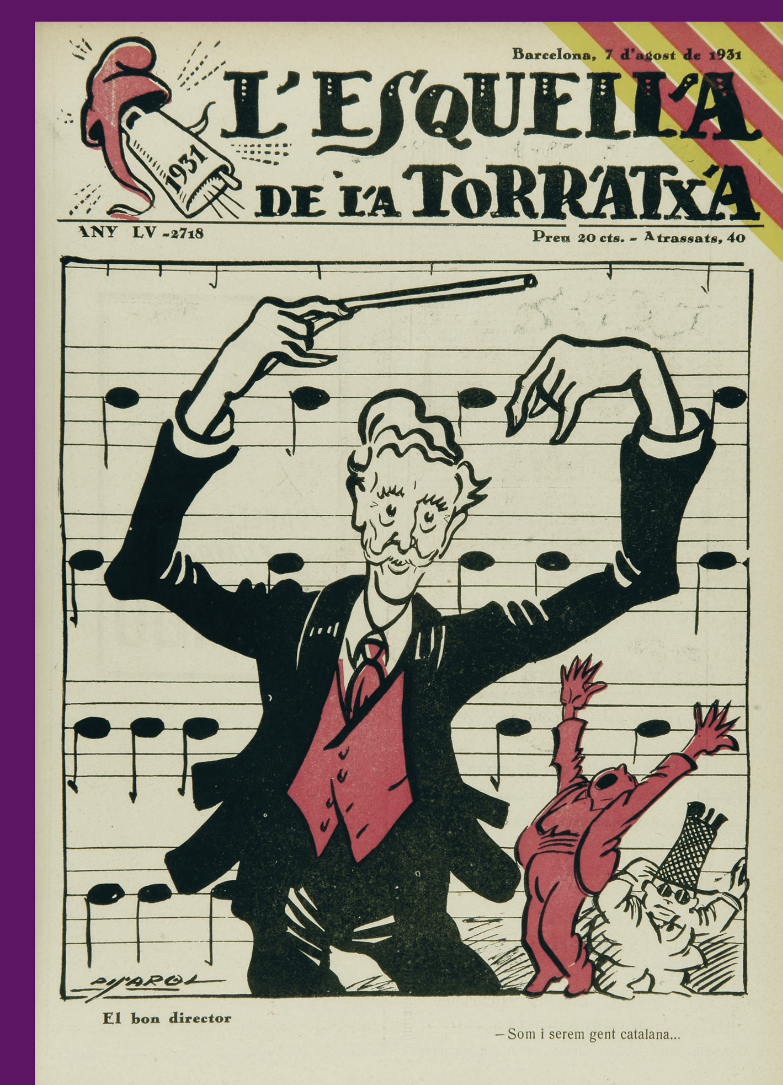
7 agost 1931 Portada de L'Esquella de la Torratxa. Josep Costa «Pícaro» / BC