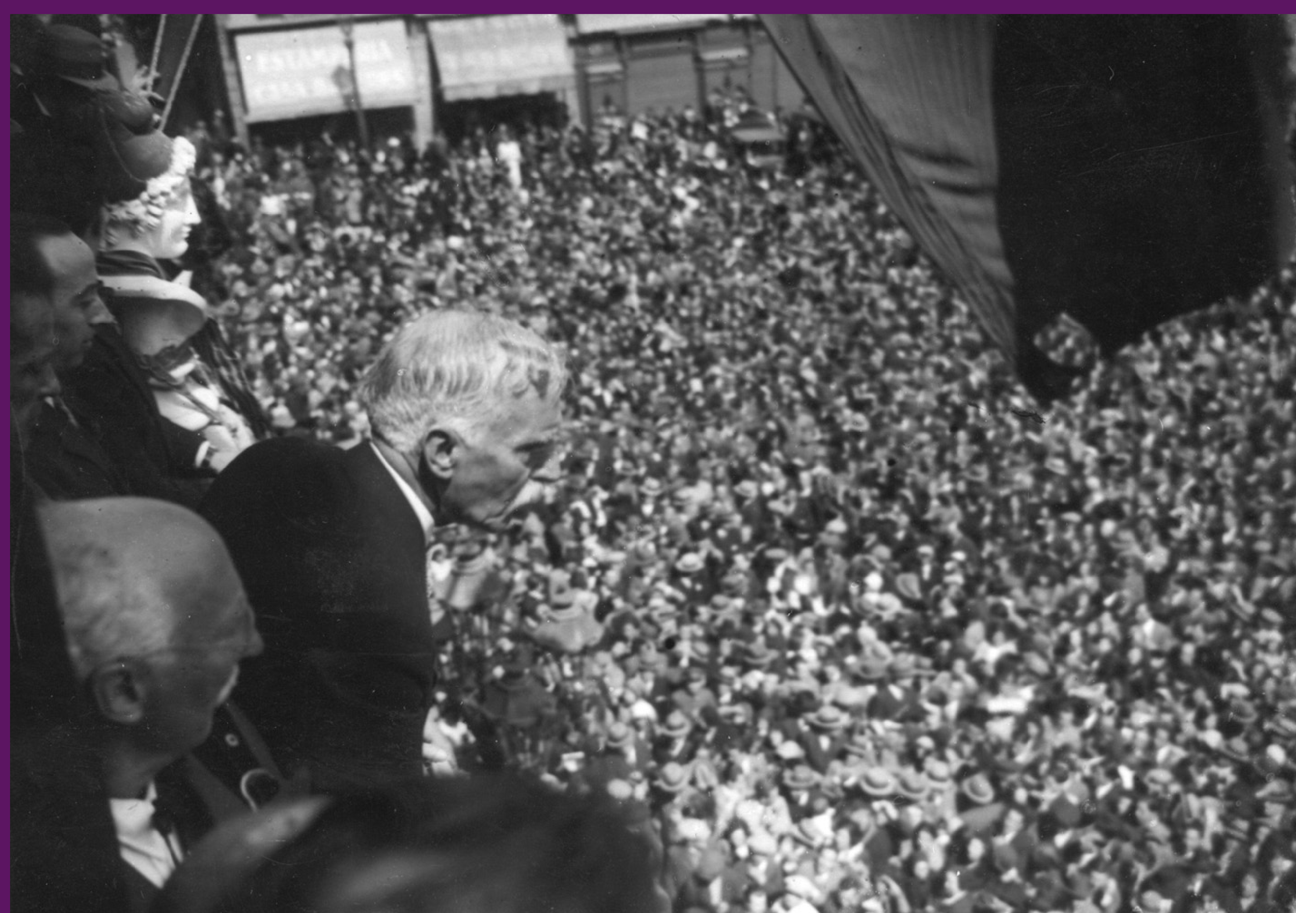
Barcelona, 24 abril 1931 Durant els primers dies l'alegria desbordà els carrers de Barcelona. Macià es dirigeix al poble des del balcó del Palau de la Generalitat

El novembre de 1932 tenen lloc les primeres eleccions de la història al Parlament de Catalunya . Esquerra, coaligada amb la Unió Socialista de Catalunya, les guanya amb majoria absoluta. El 6 de desembre Francesc Macià és investit president de la Generalitat .