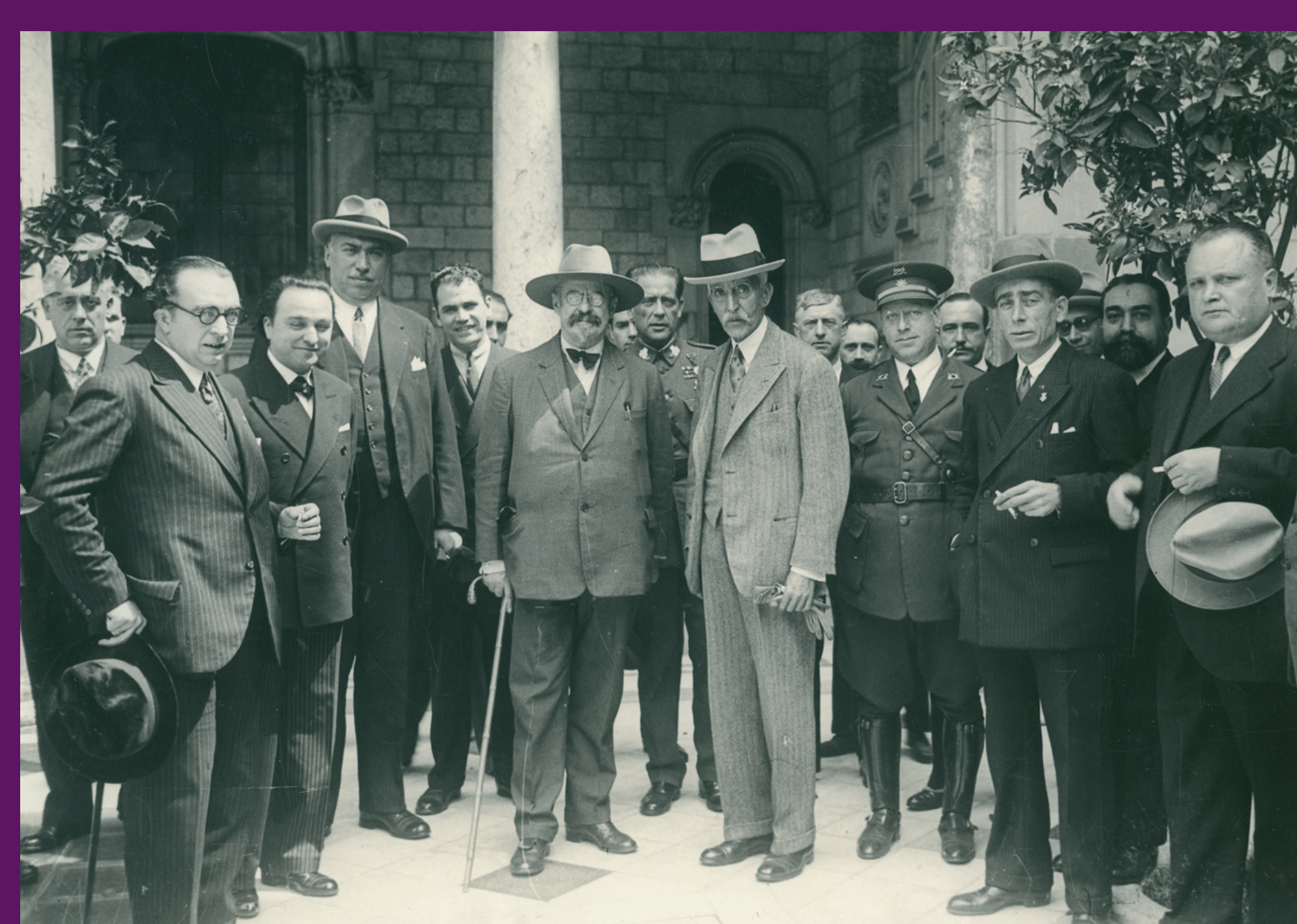
Barcelona, 1 maig 1931 Visita d'Emile Vandervelde, president de la Internacional Obrera i Socialista, al Palau de la Generalitat.