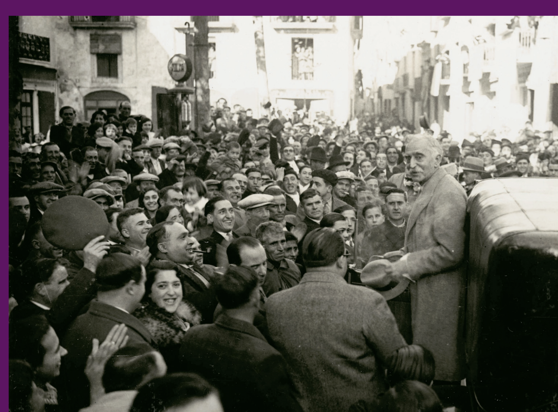
Esparreguera, 6 desembre 1931 La popularitat de Macià atreia la gent allí on anés.