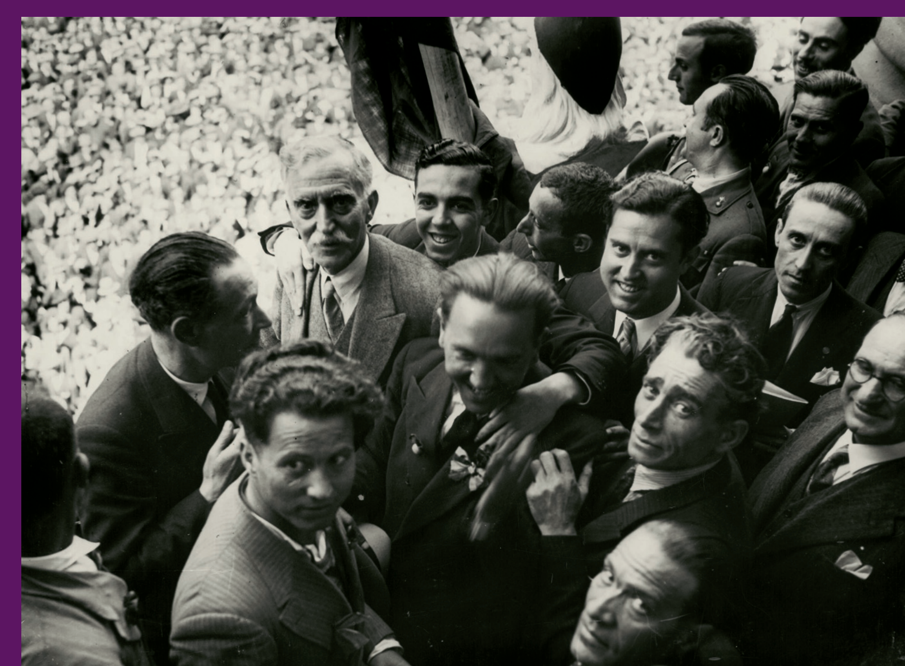
Barcelona, 17 abril 1931 Francesc Macià al Balcó de l'Ajuntament rebent els presos polítics de la Dictadura acabats d'arribar de la presó de la Mola, de Maó, després de ser amnistiats per la República.