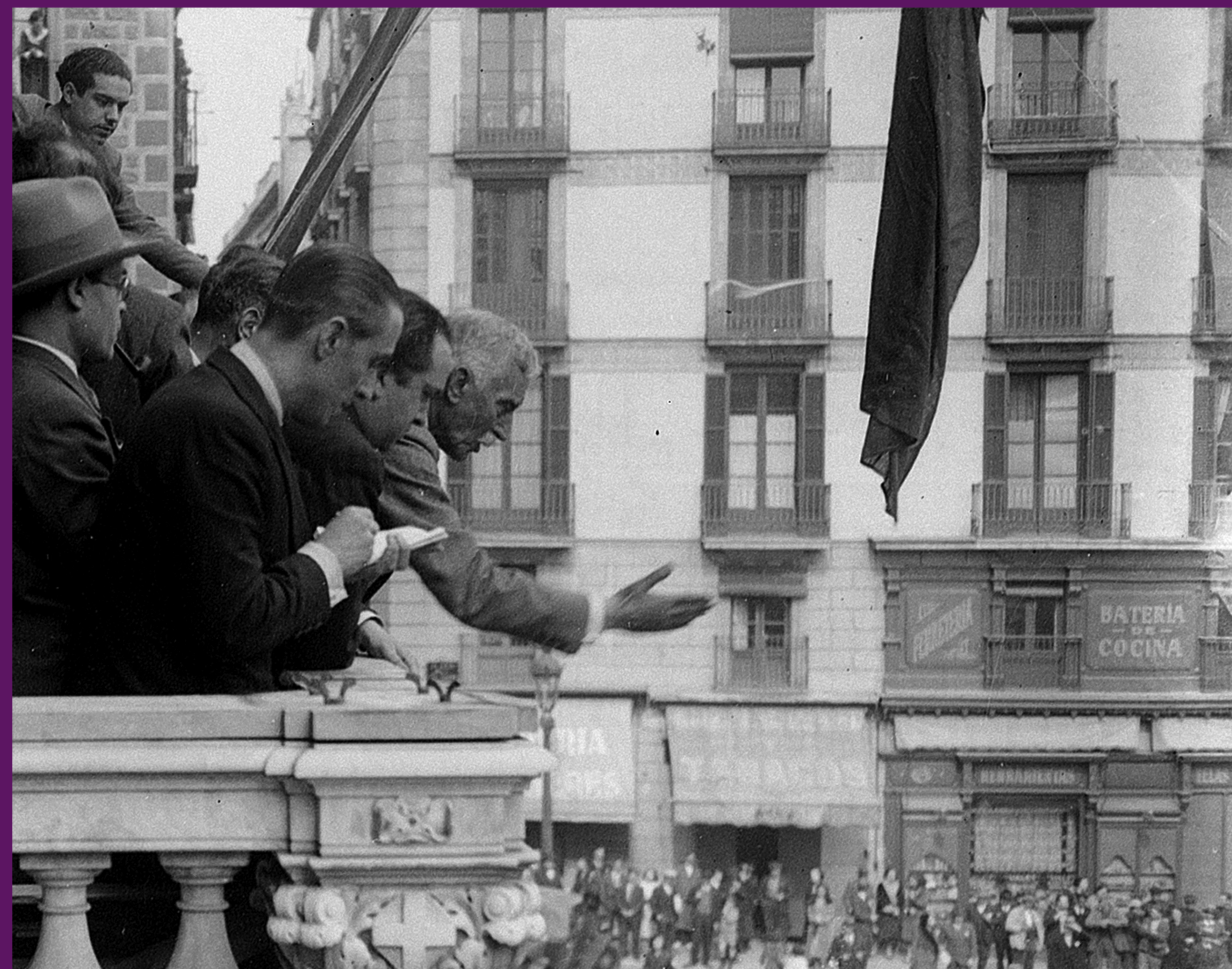
Barcelona, 14 abril 1931 Francesc Macià proclamant la República Catalana des del balcó del Palau de la Generalitat.

El crit popular «Visca Macià, mori Cambó» simbolitza l'aval d'un poble exultant, a l'estratègia del victoriós catalanisme d'esquerres que, amb una actitud de valentia i ferma, ha aconseguit en poques hores, un canvi de règim sense vessar una gota de sang , i una autonomia política que el catalanisme conservador de la Lliga Regionalista portava anys demanant infructuosament a la monarquia espanyola.