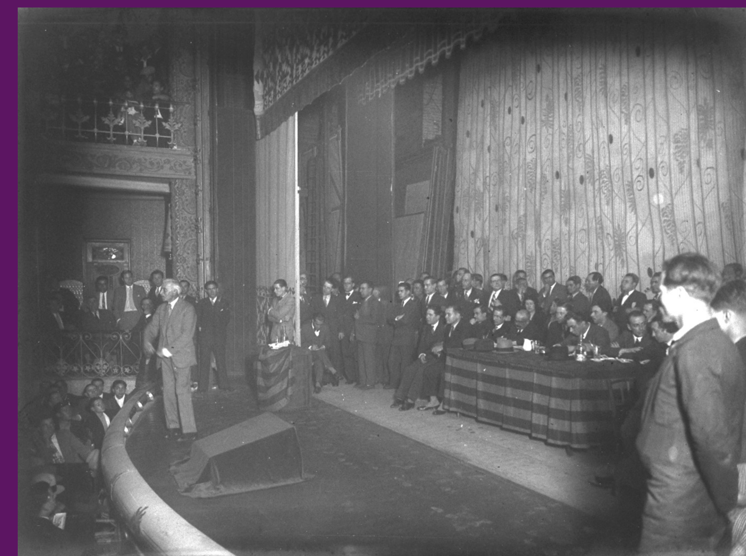
Barcelona, abril 1931 Francesc Macià intervé en un acte d'Esquerra durant la campanya electoral municipal, al Teatre Espanyol.