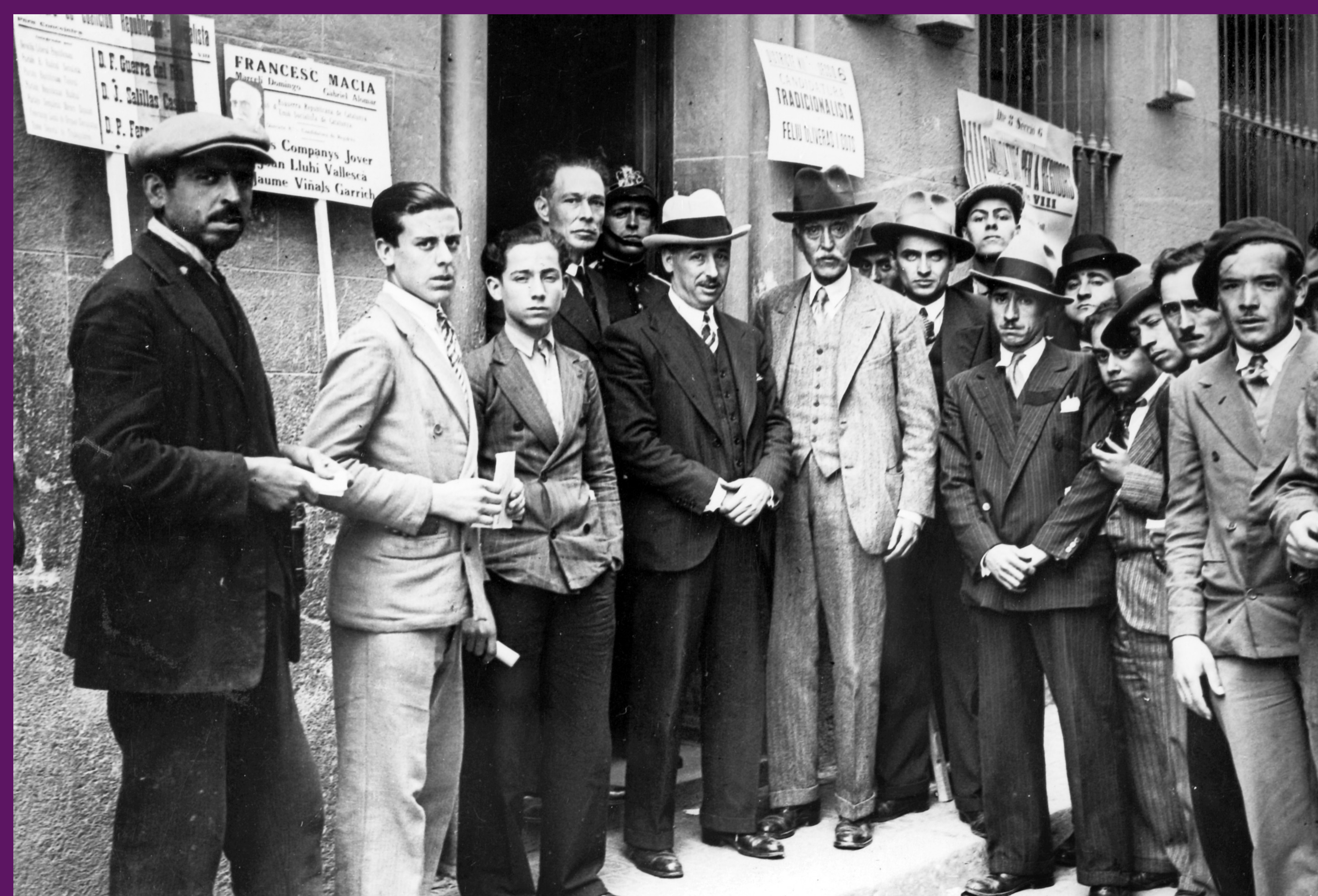
Barcelona, 12 abril 1931 Jaume Aiguader, Lluís Companys i Francesc Macià a un col·legi electoral de Gràcia.

Tres setmanes després de la seva fundació Esquerra ha d'afrontar unes eleccions municipals. Després de dubtes sobre si és prou sòlida per anar a les eleccions tota sola, i d'haver estat rebutjada per altres forces, Esquerra acorda presentar-se en coalició amb la Unió Socialista de Catalunya , amb un programa que aposta per un inequívoc canvi de règim de Monarquia a República, per l'assoliment de l'autonomia de Catalunya i per profundes reformes socials.