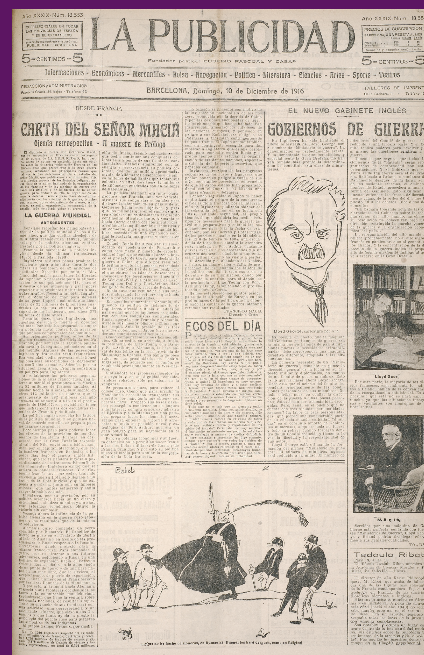
10 desembre 1916 Portada de La Publicidad amb una de les cròniques de guerra de Francesc Macià.