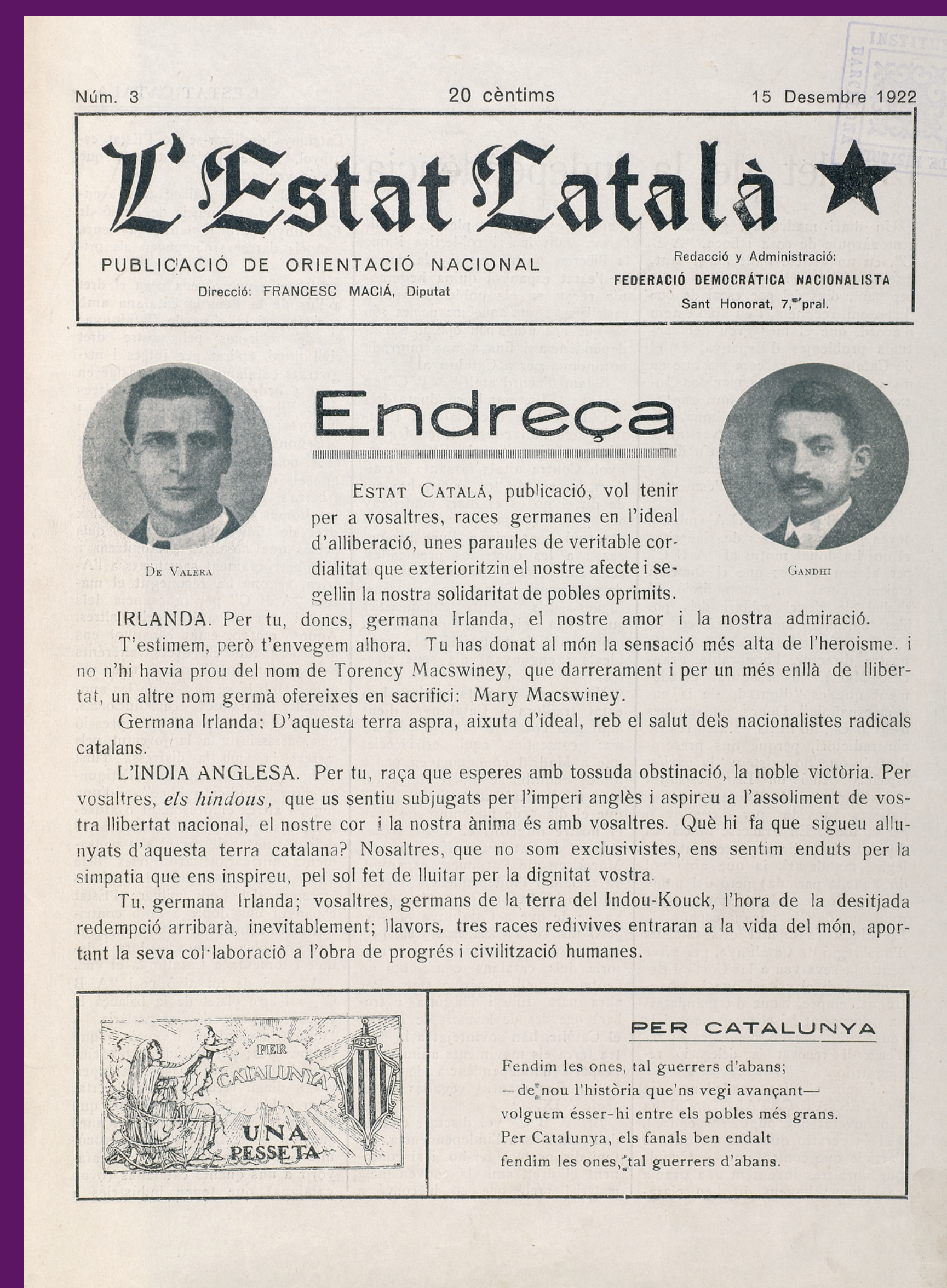
15 desembre 1922 L'Estat Català fou dirigit per Francesc Macià.