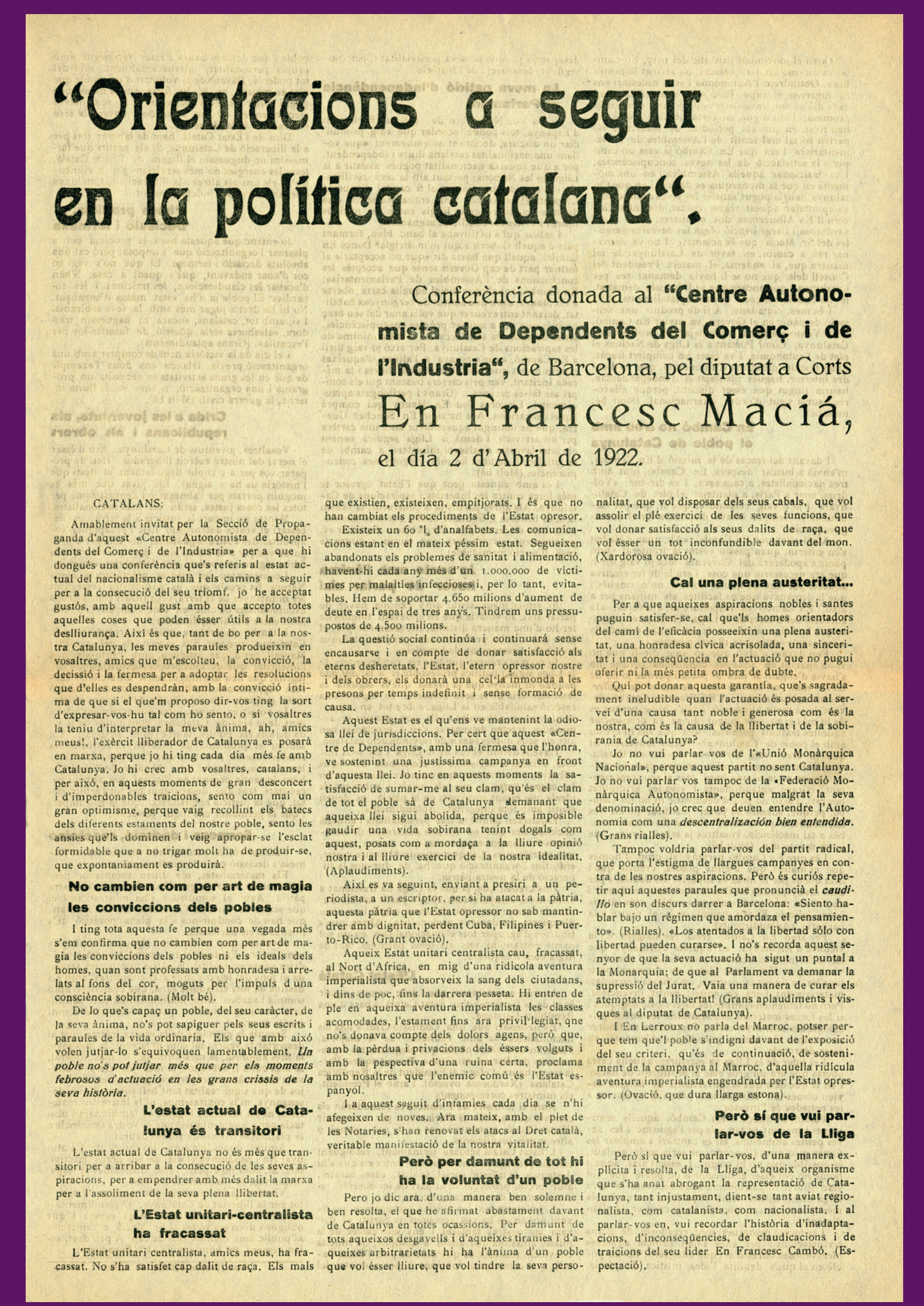
2 abril 1922 Continentent conferència pronunciada per Francesc Macià al CADCI.