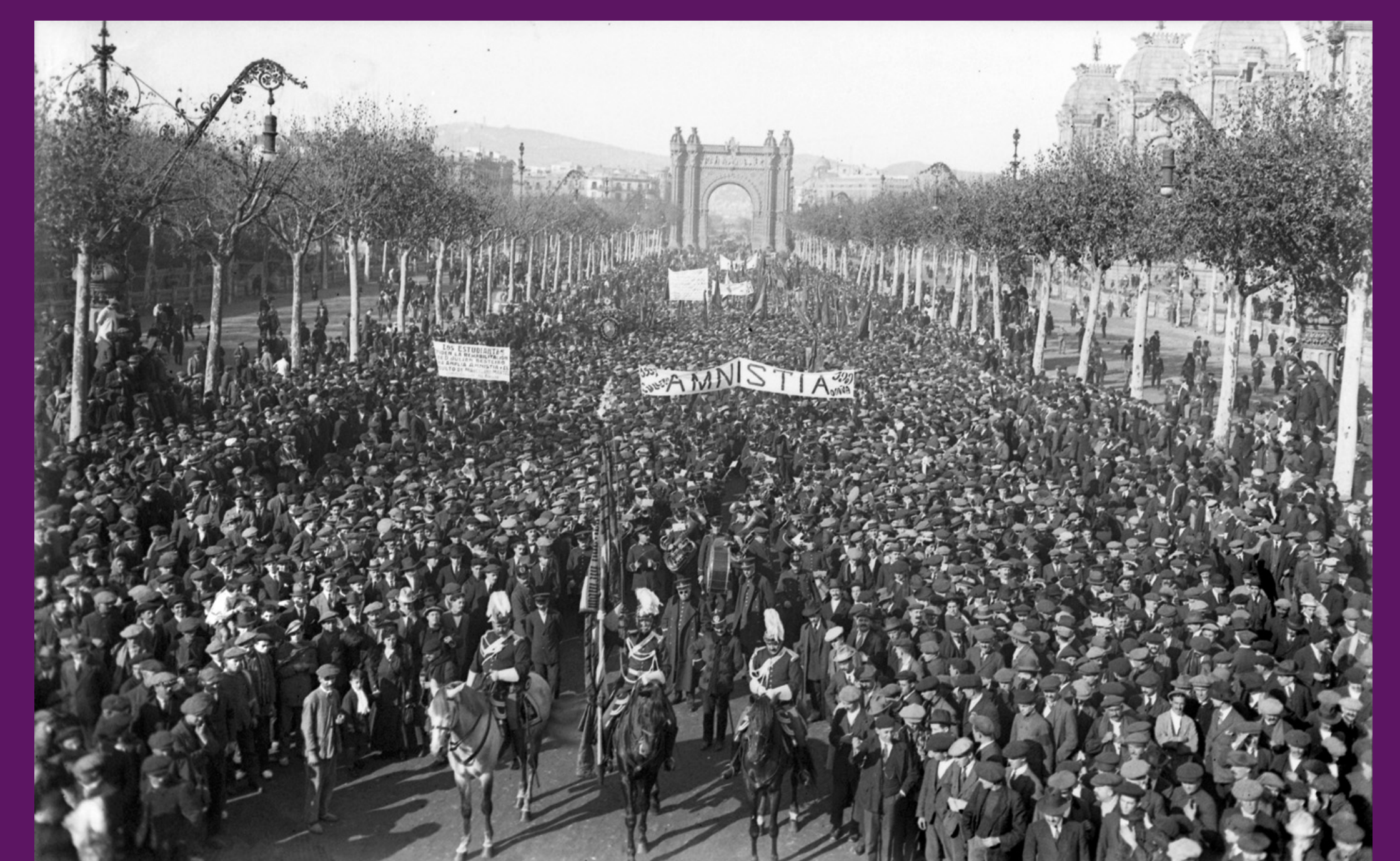
Barcelona, 1917 Manifestació al passeig de Sant Joan demanant l'amnistia dels empresonats per la vaga general de l'agost del mateix any.