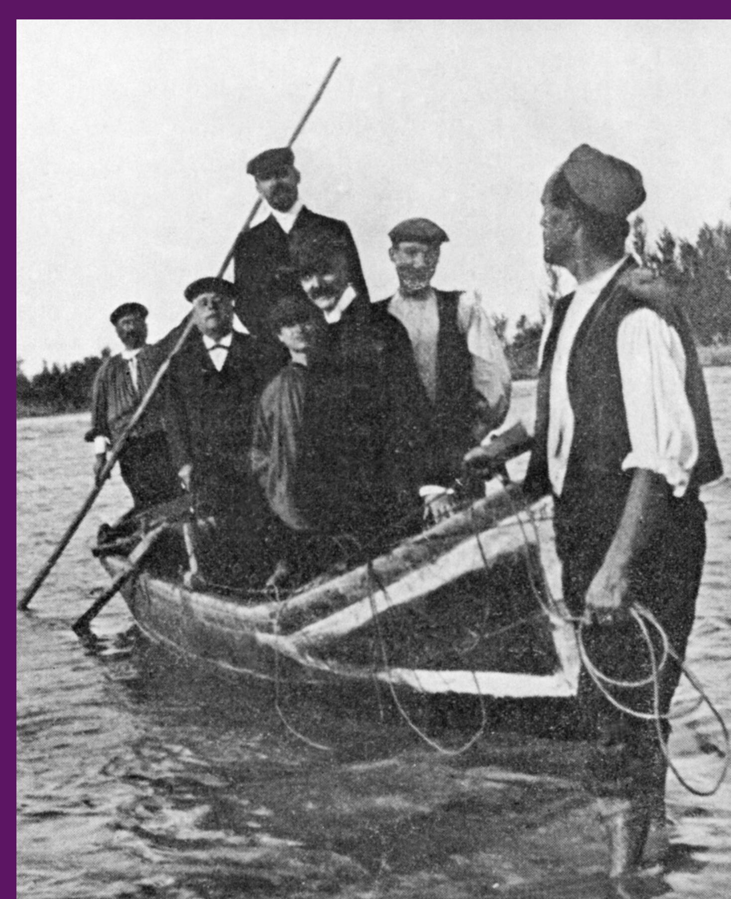
circa 1907 El diputat Francesc Macià amb altres prohoms lleidatans fent campanya a favor del ferrocarril de la Noguera Pallaresa.