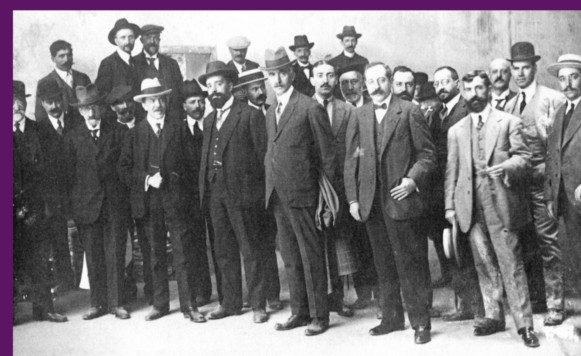
Novembre 1907 El diputat Francesc Macià visitant les zones del Noguera Pallaresa afectades per uns recents aiguats. FJL