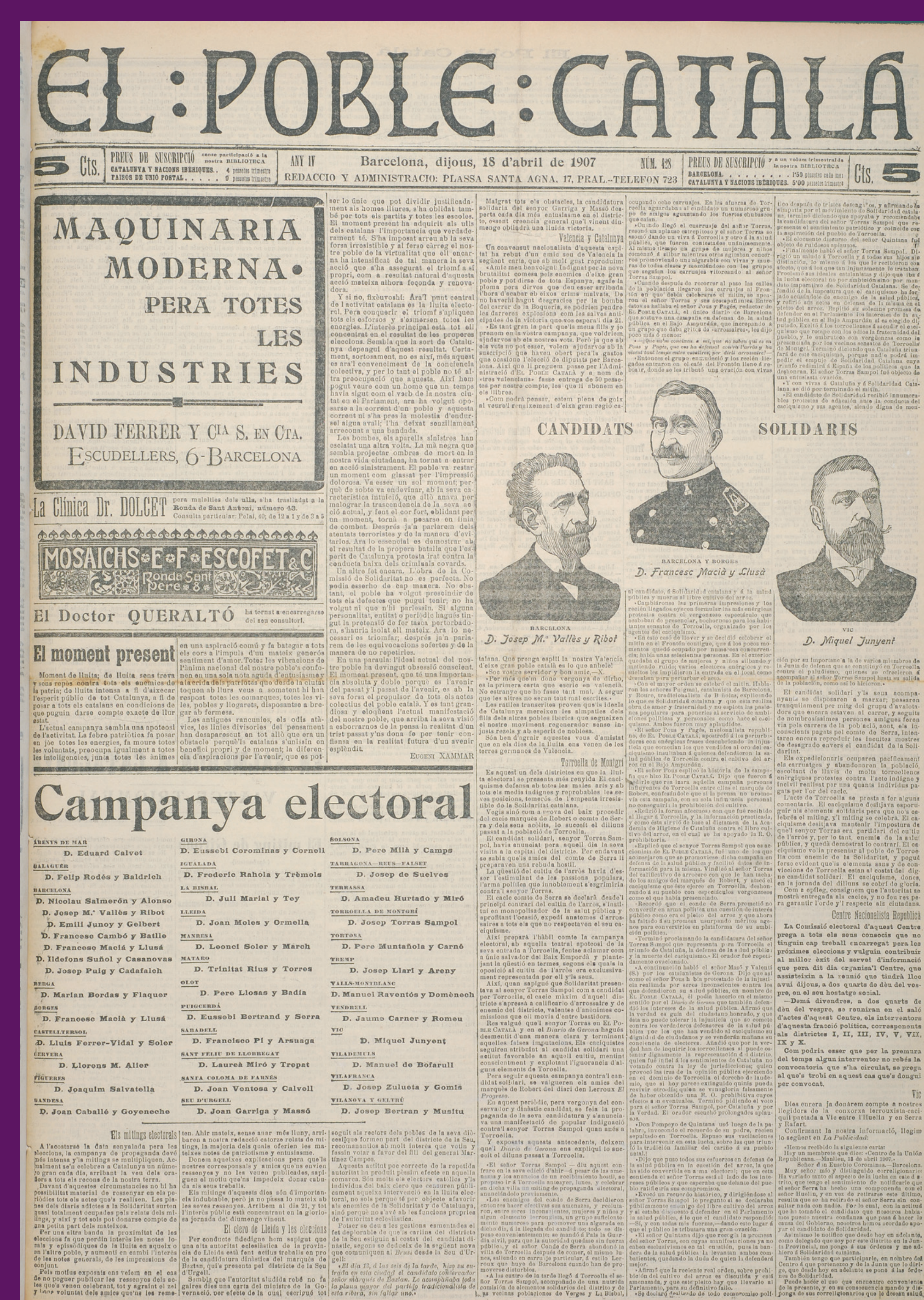
18 abril 1907 El Poble Català, amb una capçalera modernista dissenyada per Lluís Domènech i Montaner, va donar suport activament a la campanya electoral de Solidaritat Catalana.

La premsa es fa un ampli ressò de l'afer Macià. Els catalans comencen a sentir admiració per aquest home íntegre que no abandona els seus ideals. Un home valent, amb qui molts ja s'hi comencen a identificar.