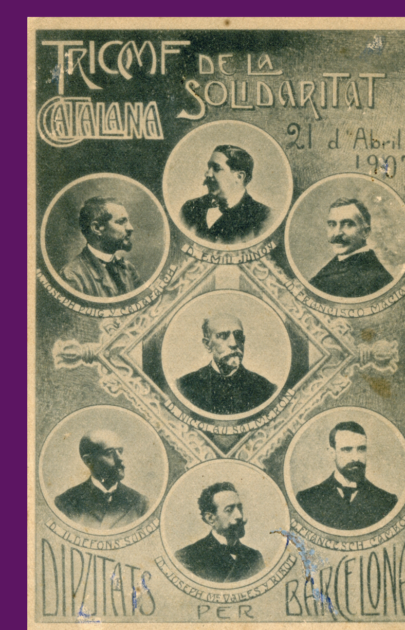
1907 Postal commemorativa del triomf de Solidaritat Catalana, que reproduïx els set candidats elegits pel districte de la ciutat de Barcelona.