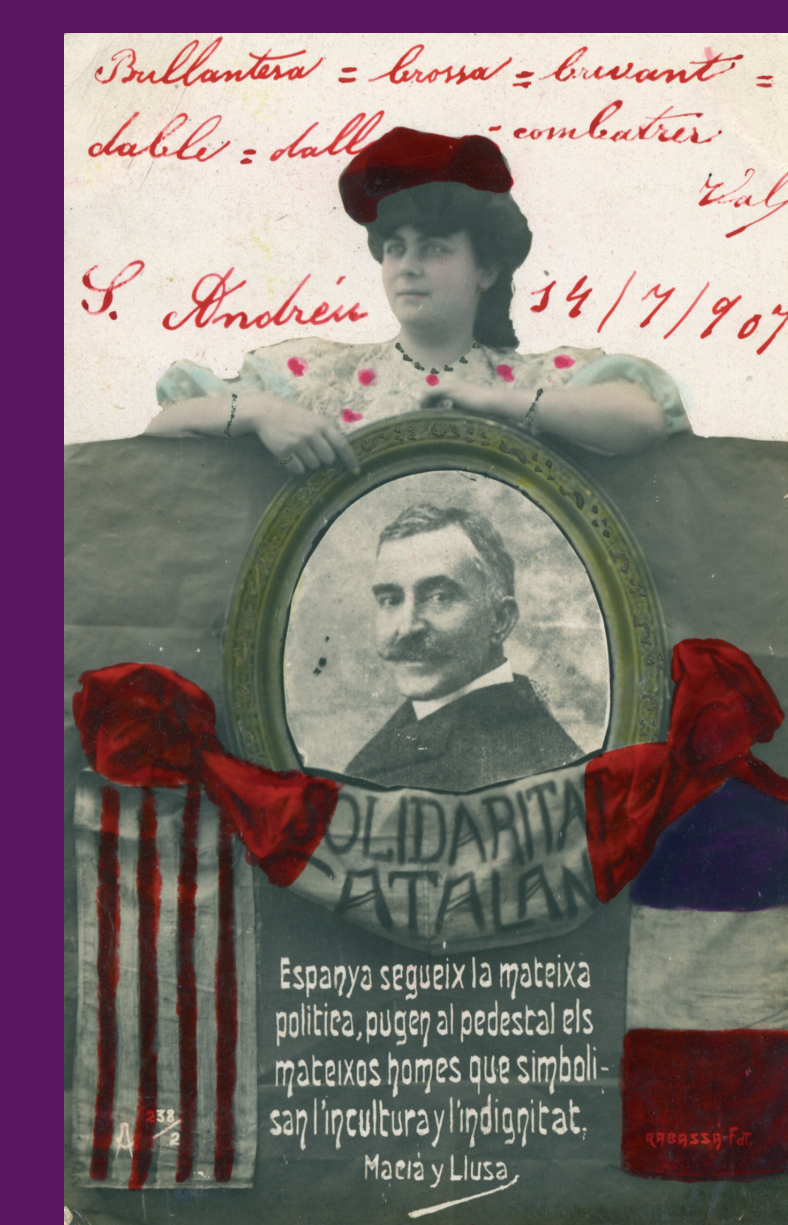
1907 Postal que reproduïx una cita de Francesc Macià.