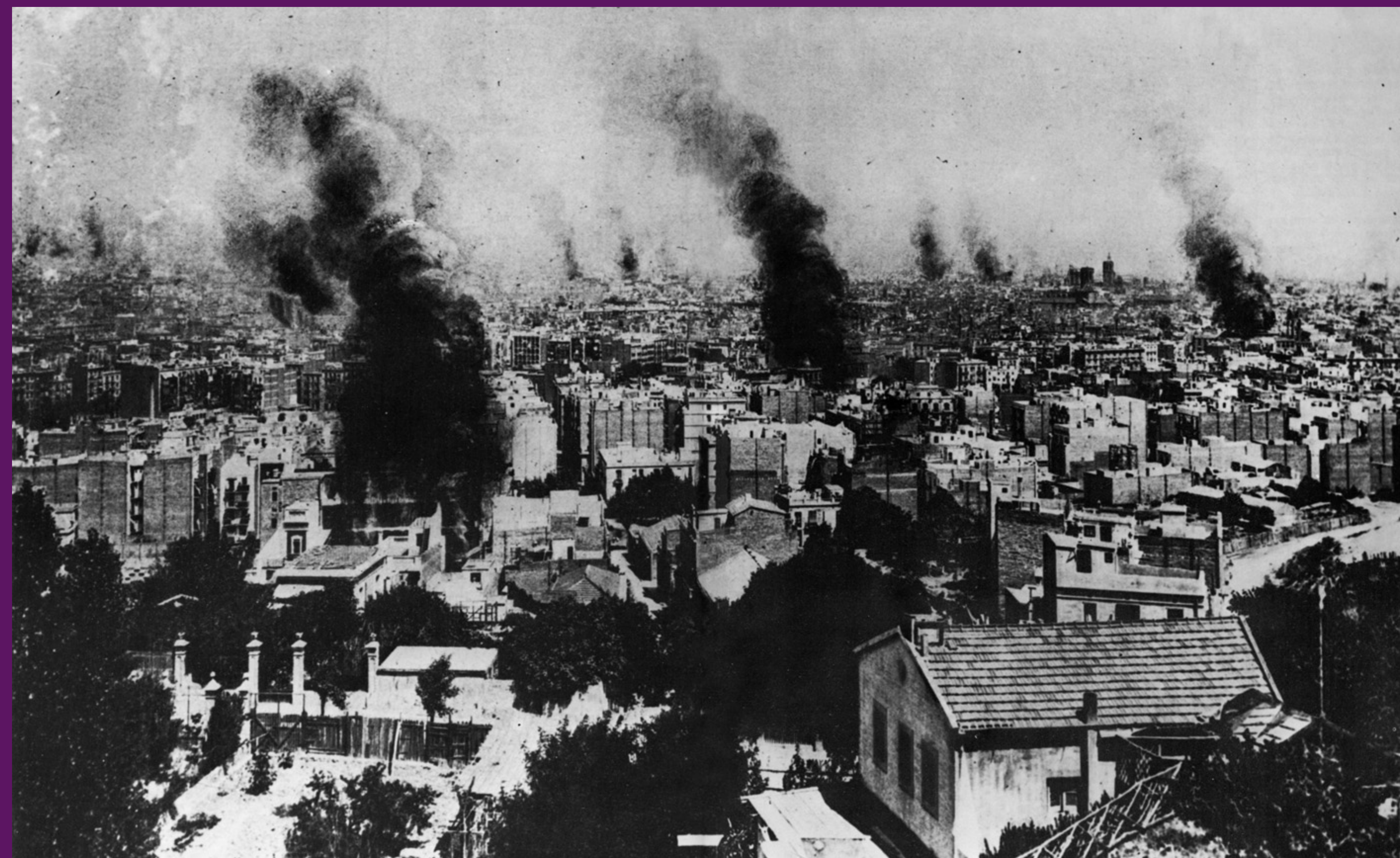
Barcelona, 28 juliol 1909 Vista des de Montjuïc on es poden apreciar les columnes de fum provocades pels incendis d'edificis religiosos durant la Setmana Tràgica.