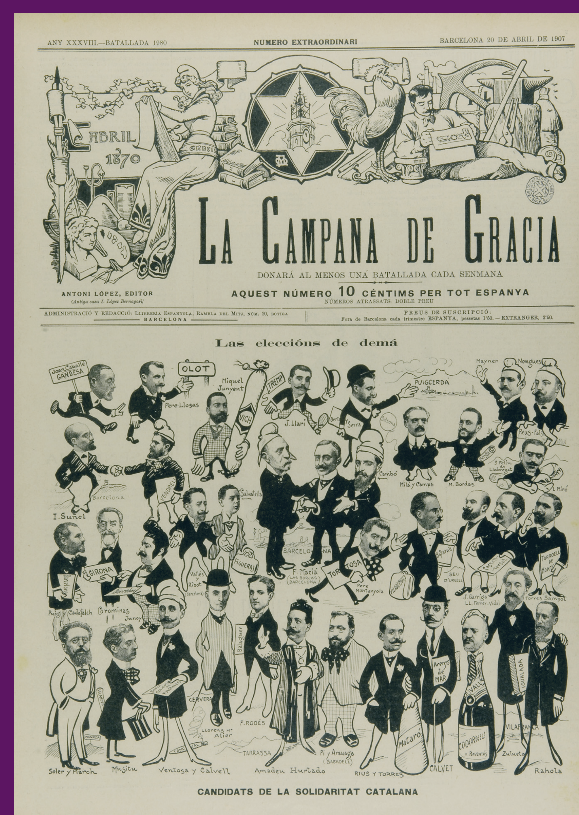
20 abril 1907 La Campana de Gràcia també s'afegí a la campanya de suport a Solidaritat Catalana amb aquesta portada.