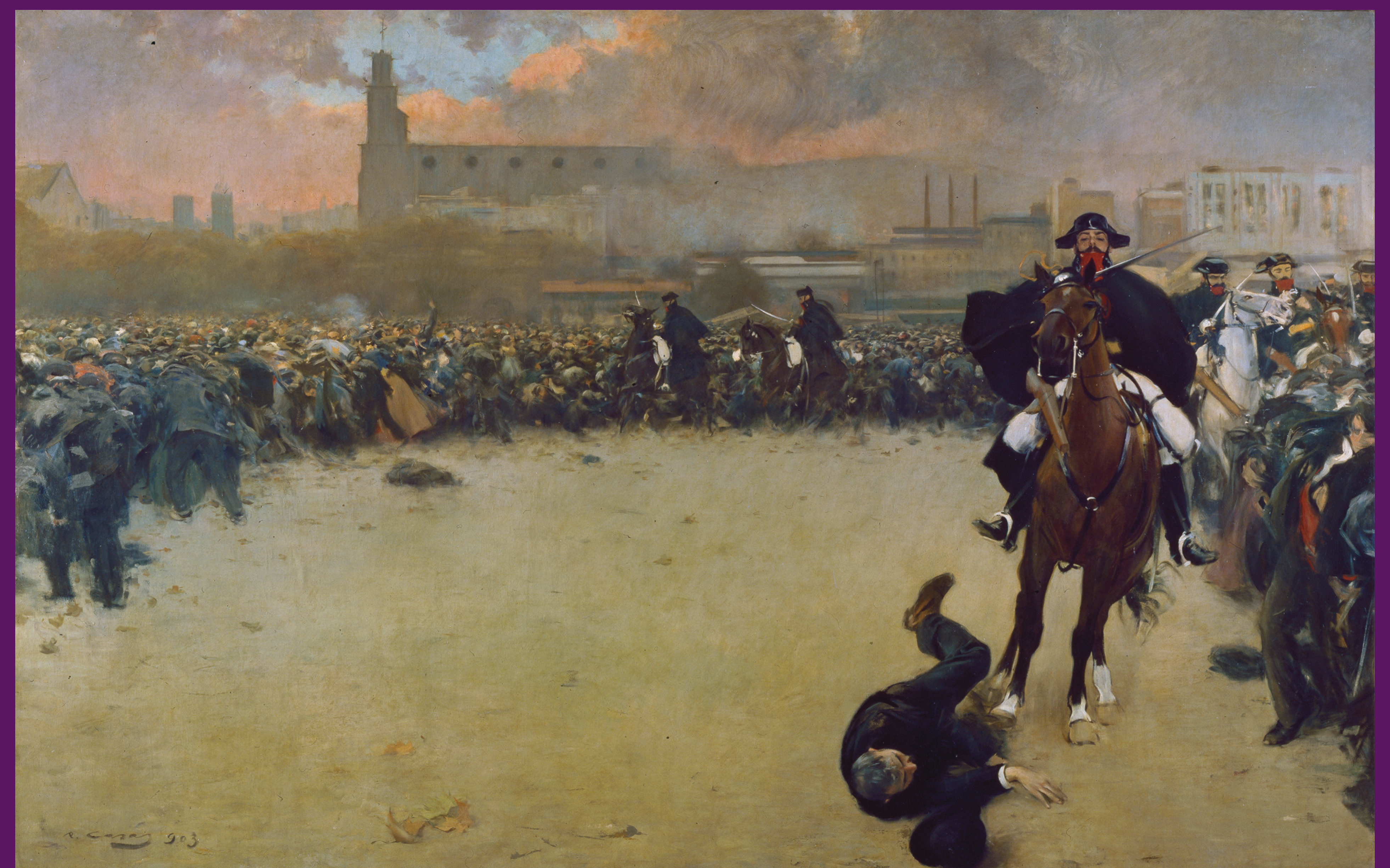
1902 Aquest quadre de Ramon Casas és conegut tant com La càrrega com a Barcelona 1902 . Casas, sensible a la realitat social i política recollí en aquesta tela magistral el moment culminant de l'enfrontament de la massa de manifestants amb les forces repressores de l'Estat de la gran vaga de 1902.