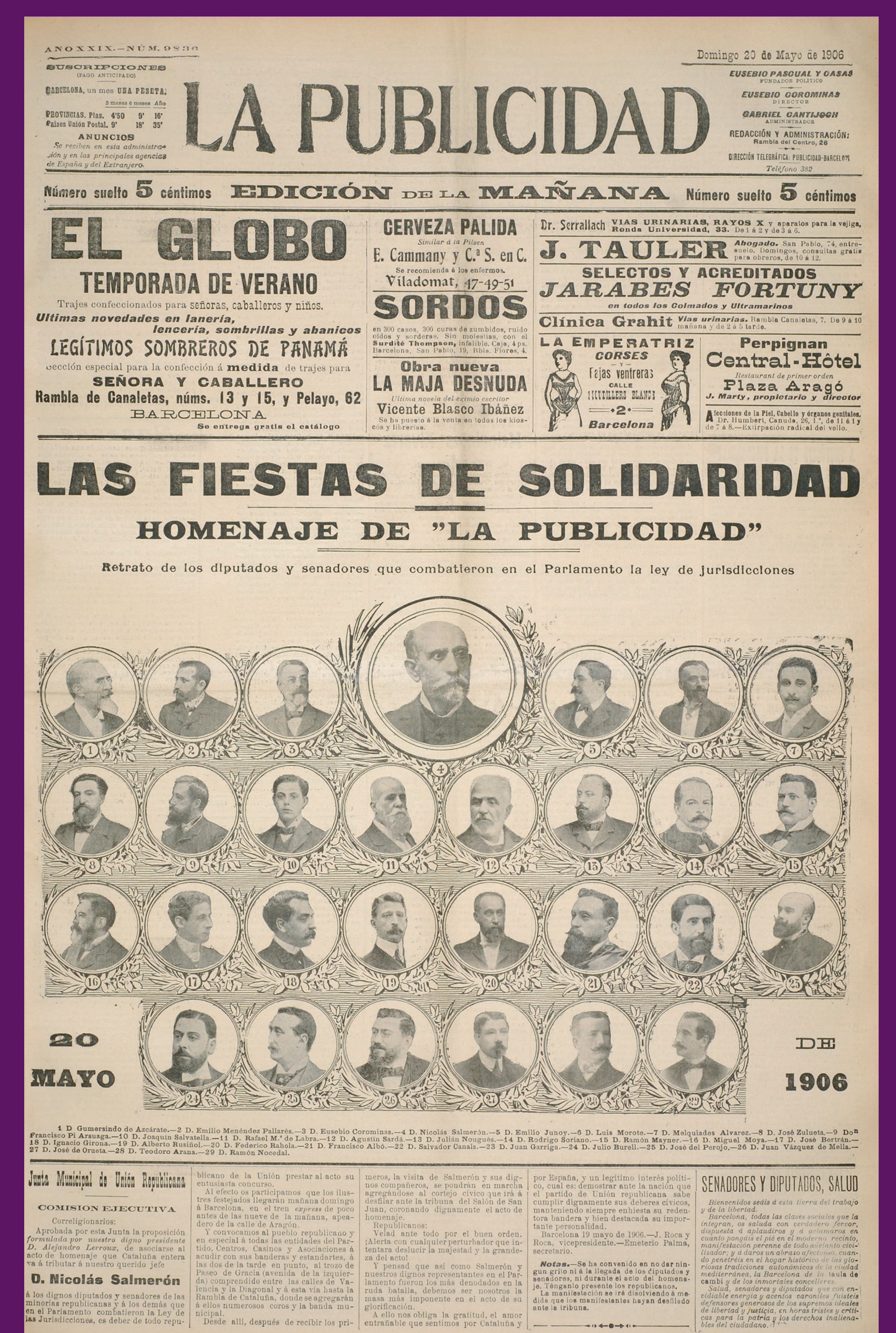
20 maig 1906 La Publicidad s'afegí a l'Homenaje als diputats i senadors de Solidaritat Catalana que combateren la Llei de Jurisdiccions.