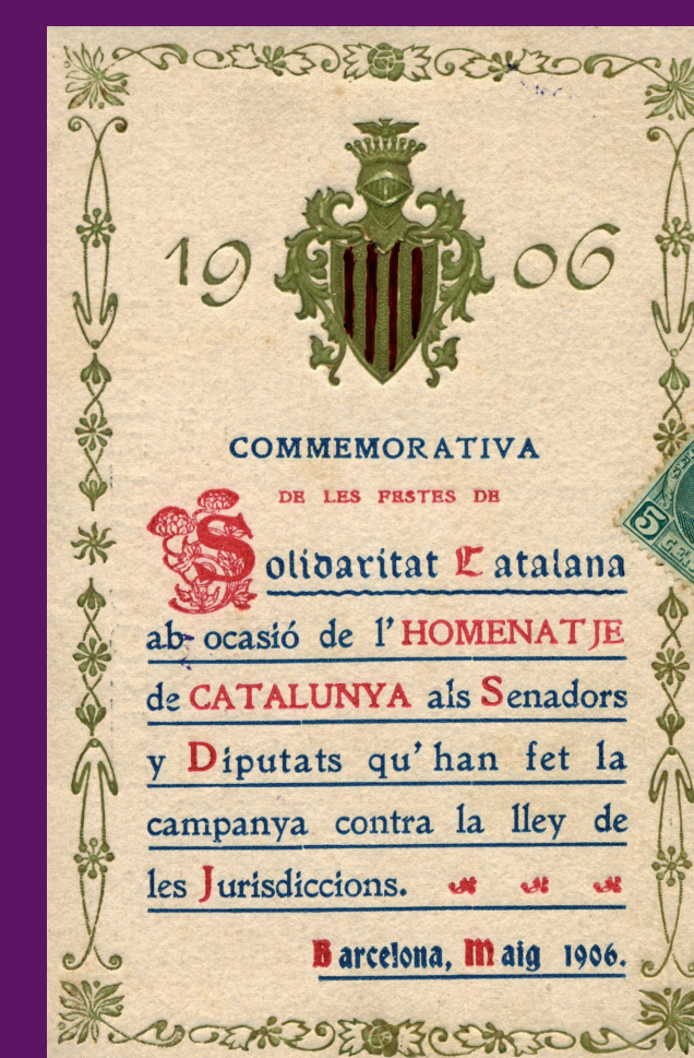
Maig 1906 Postal commemorativa de l'Homenaje als senadors i diputats de Solidaritat Catalana que combateren la Llei de Jurisdiccions.