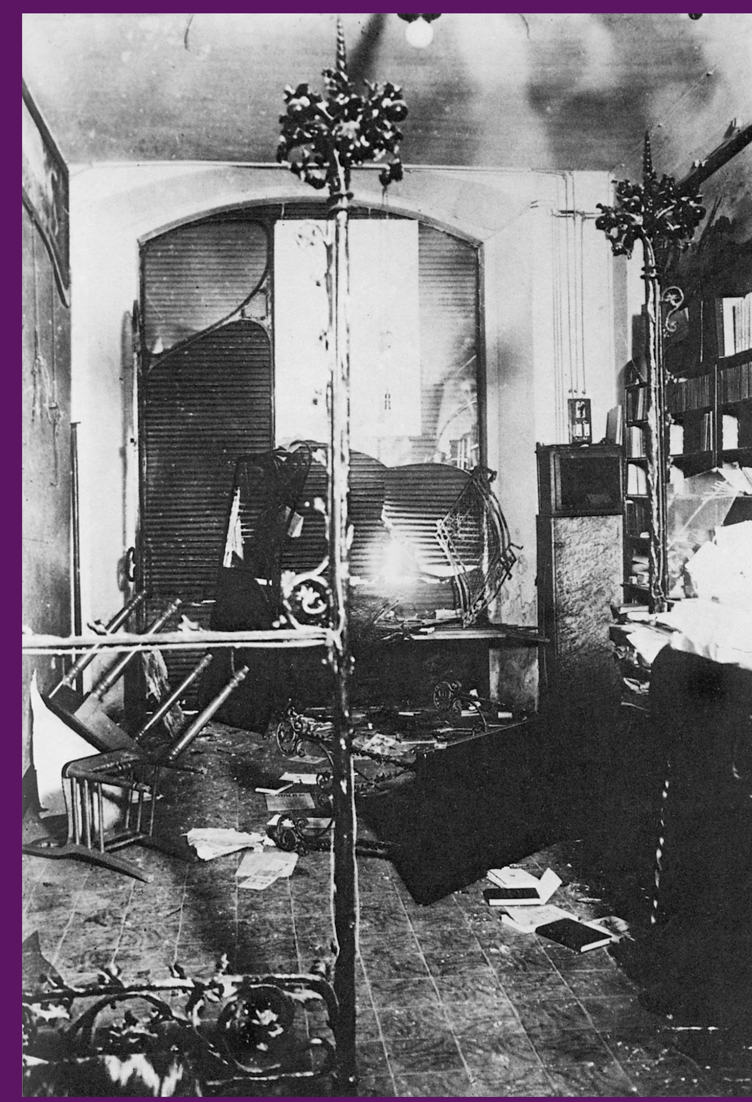
Barcelona, 26 novembre 1905 La redacció del Cu-cut! després de l'assalt.