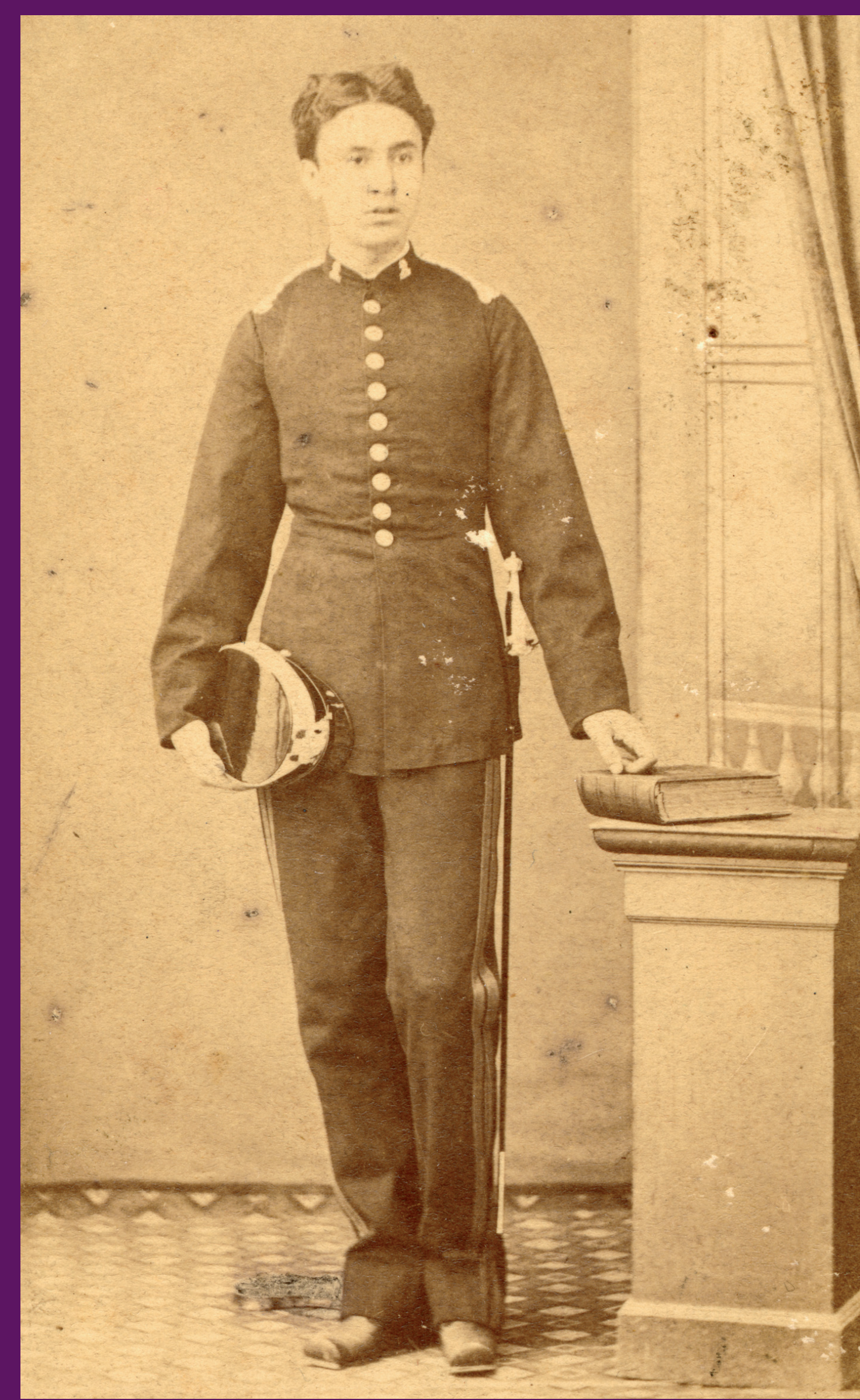
circa 1876 Retrat de Francesc Macià com a cadet de l'exèrcit.