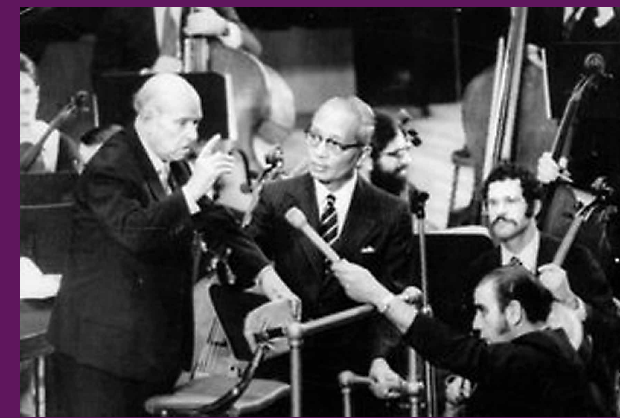
Nova York, 24 d'octubre de 1971 Pau Casals, icona de l'exili català durant el franquisme, pronunciant a la seu de l'ONU el cèlebre discurs « I'm a catalan », reivindicant la condició nacional de Catalunya i el seu compromís secular amb la pau, al costat del secretari general de les Nacions Unides, U Thant.