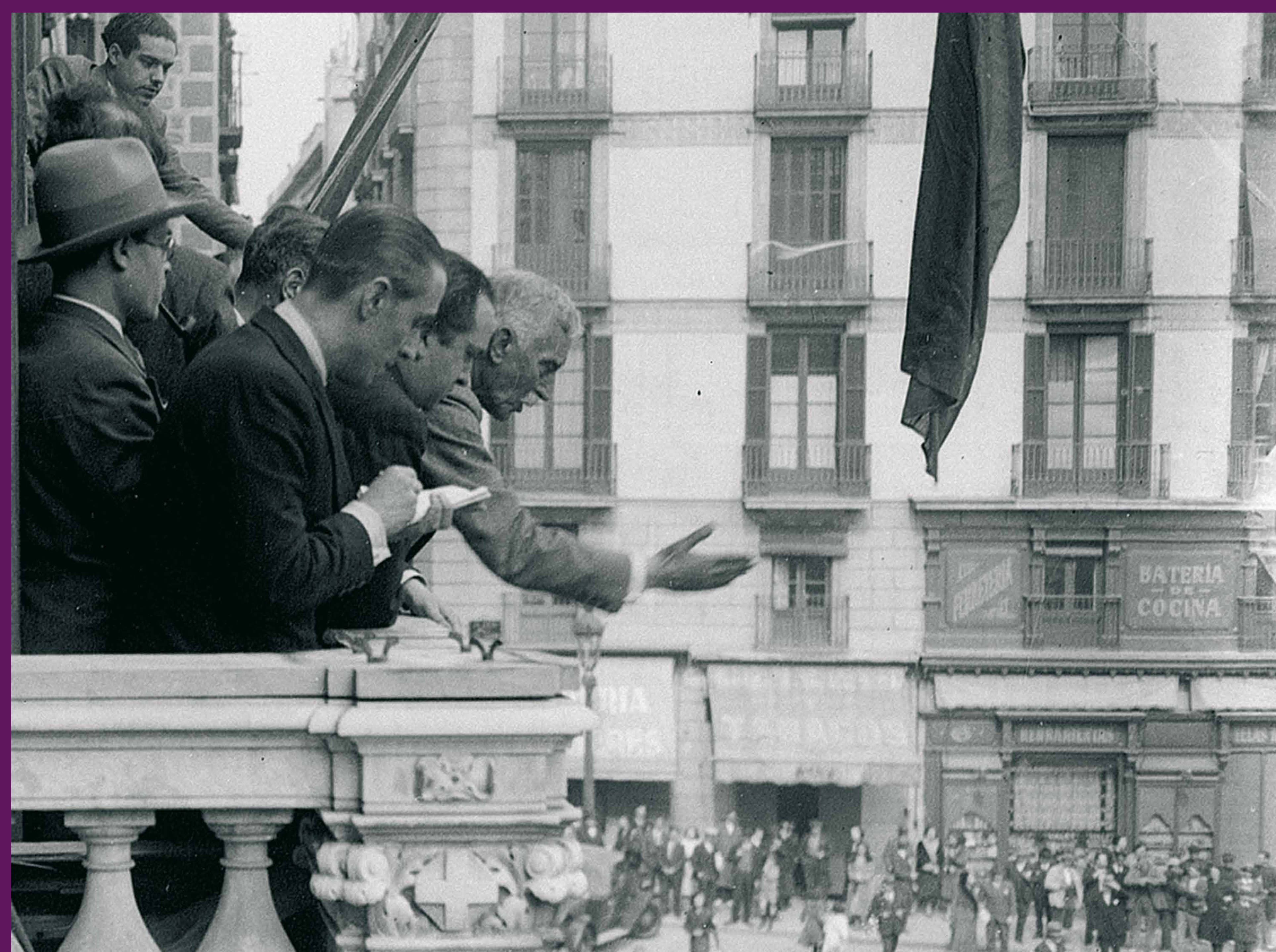
Barcelona, 14 d'abril de 1931 Francesc Macià proclama la República Catalana des del balcó del Palau de la Generalitat.

El juliol el general Franco encapçala un cop d'estat contra la República fracassant a Catalunya però no a mitja Espanya. És la Guerra Civil . Després d'una breu etapa de violència revolucionària, la Generalitat recupera el control i eixampla competències. Tot acaba el 1939 amb la derrota i exili republicà i trenta-vuit anys de dictadura feixista .