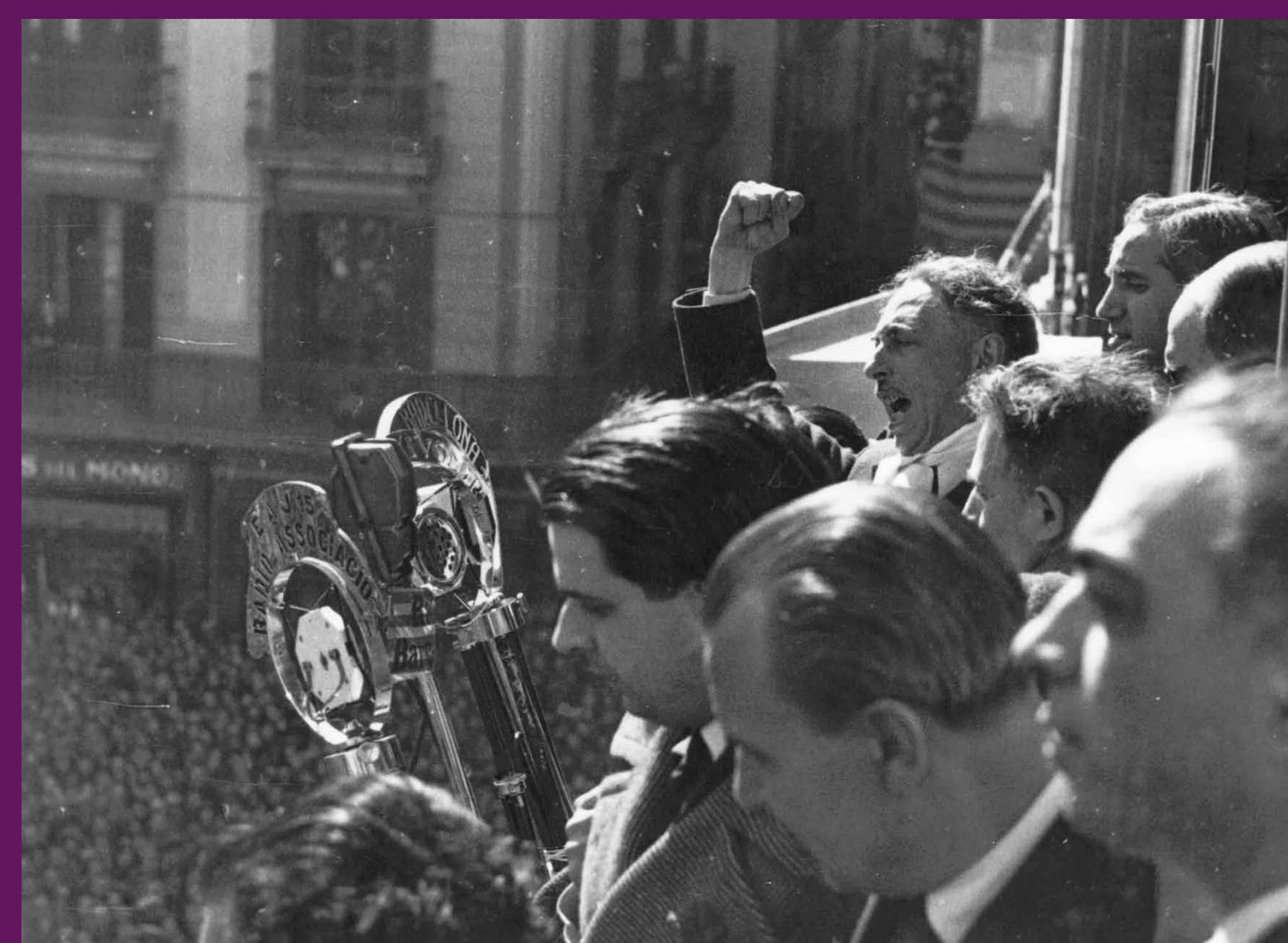
Barcelona, 1 de març de 1936 El president de la Generalitat de Catalunya, Lluís Companys, pronunciant el cèlebre discurs « Tornarem a lluitar, tornarem a sofrir, tornarem a guanyar », a la seva tornada després d'haver estat empresonat pels Fets del Sis d'Octubre de 1936.