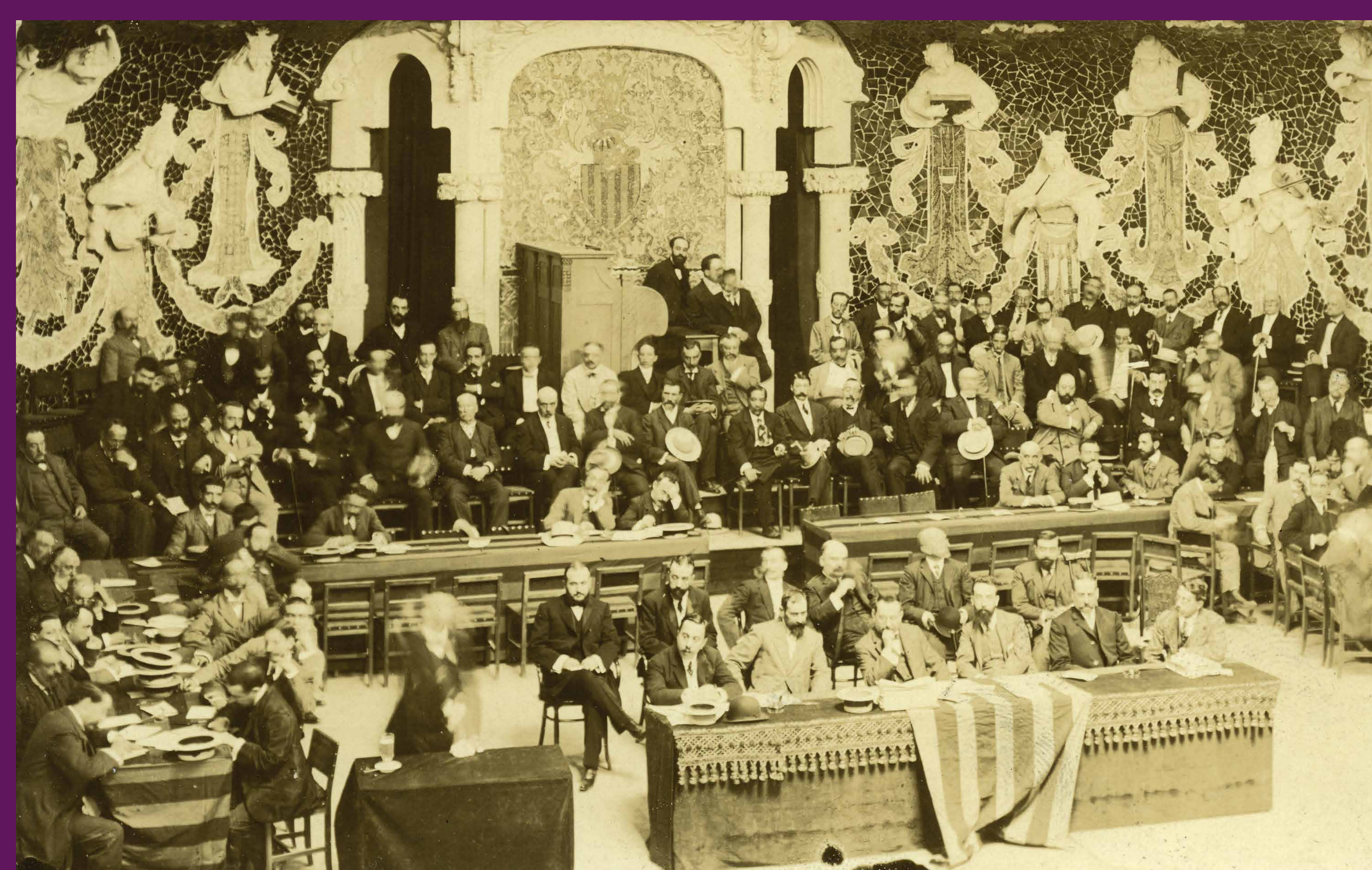
Barcelona, 28 de juny de 1908 Assemblea Catalana al Palau de la Música, convocada per Solidaritat Catalana, reunint a tots els càrrecs electes del país: regidors, diputats a Corts i a les diputacions provincials.

El catalanisme, que defensa la condició nacional de Catalunya, la seva llengua, cultura i llibertats polítiques, arriba a l'eclosió definitiva amb el nou segle quan, el 1907, Solidaritat Catalana, una plataforma electoral que agrupa des dels republicans d'esquerres als carlins, passant per la burgesia il·lustrada de la Lliga Regionalista, assoleix 41 dels 44 escons catalans a les eleccions a Corts.