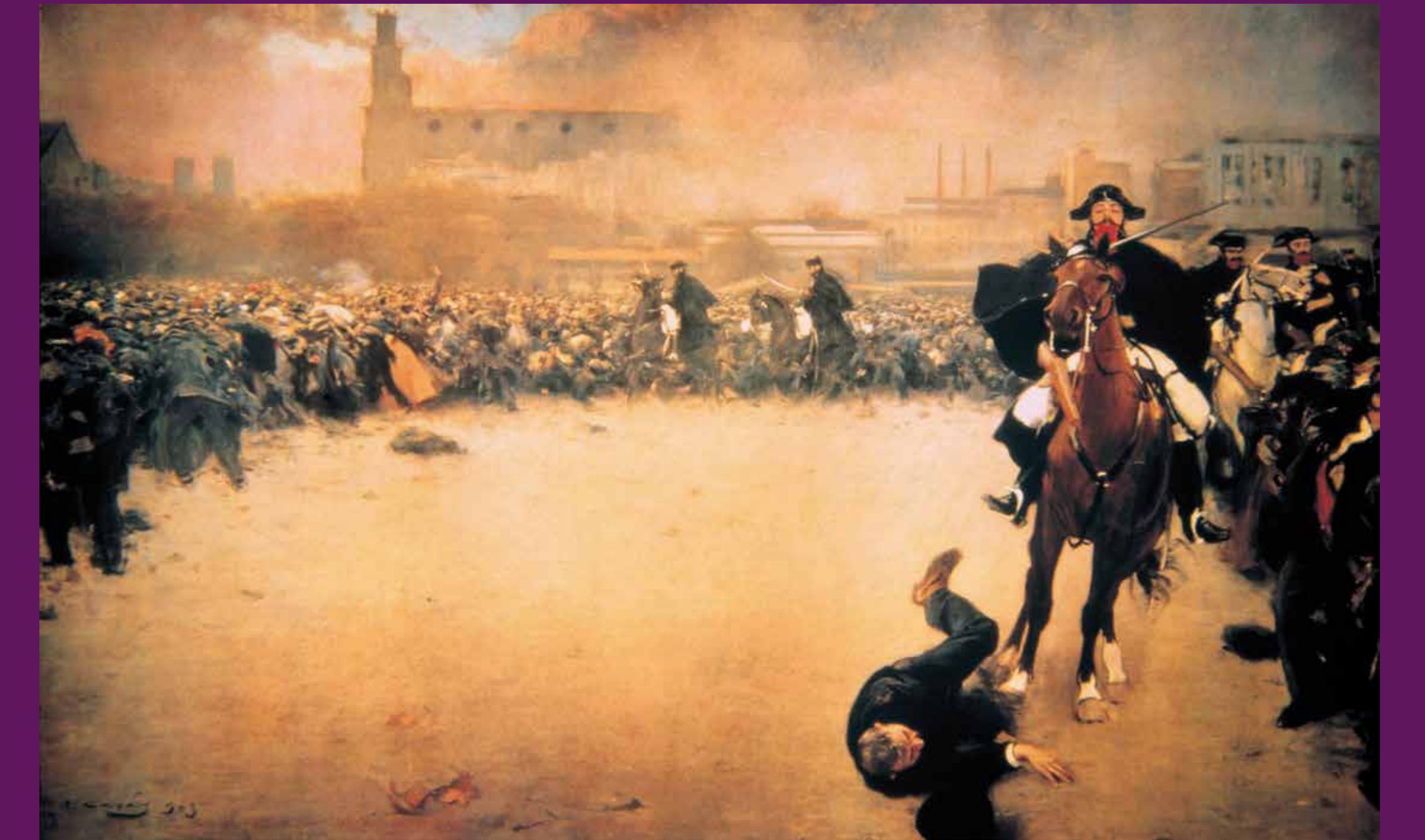
Barcelona, circa 1900 La càrrega (1903) de Ramon Casas mostra la repressió habitual de les mobilitzacions obreres per part de les forces d'ordre de l'Estat. Casas es va inspirar en la repressió per l'atemptat del carrer dels Canvis Nous contra la processó de Corpus de 1896 i que va culminar en el Procés de Montjuïc.