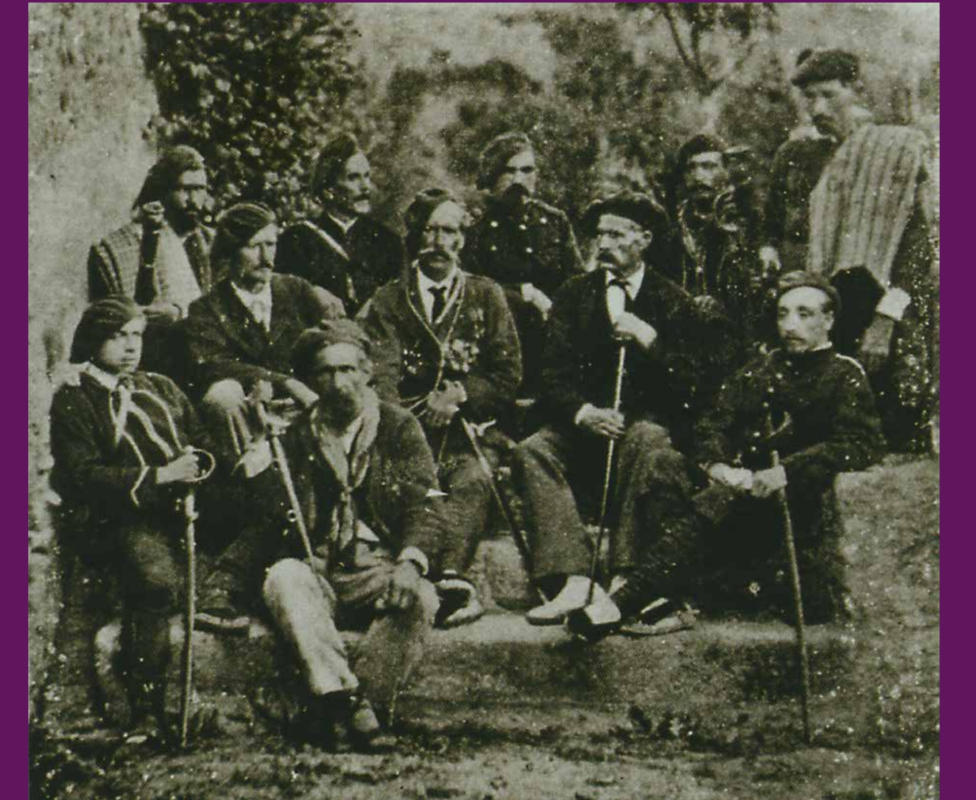
1872 El general carlí Francesc Savalls envoltat d'altres caps militars. Savalls va participar en les tres guerres carlines del segle XIX, desenvolupant un paper protagonista sobretot a la darrera, on arribà a ser nomenat capità general de Catalunya. Després de la guerra s'exilià a Níxa, on morí el 1886.