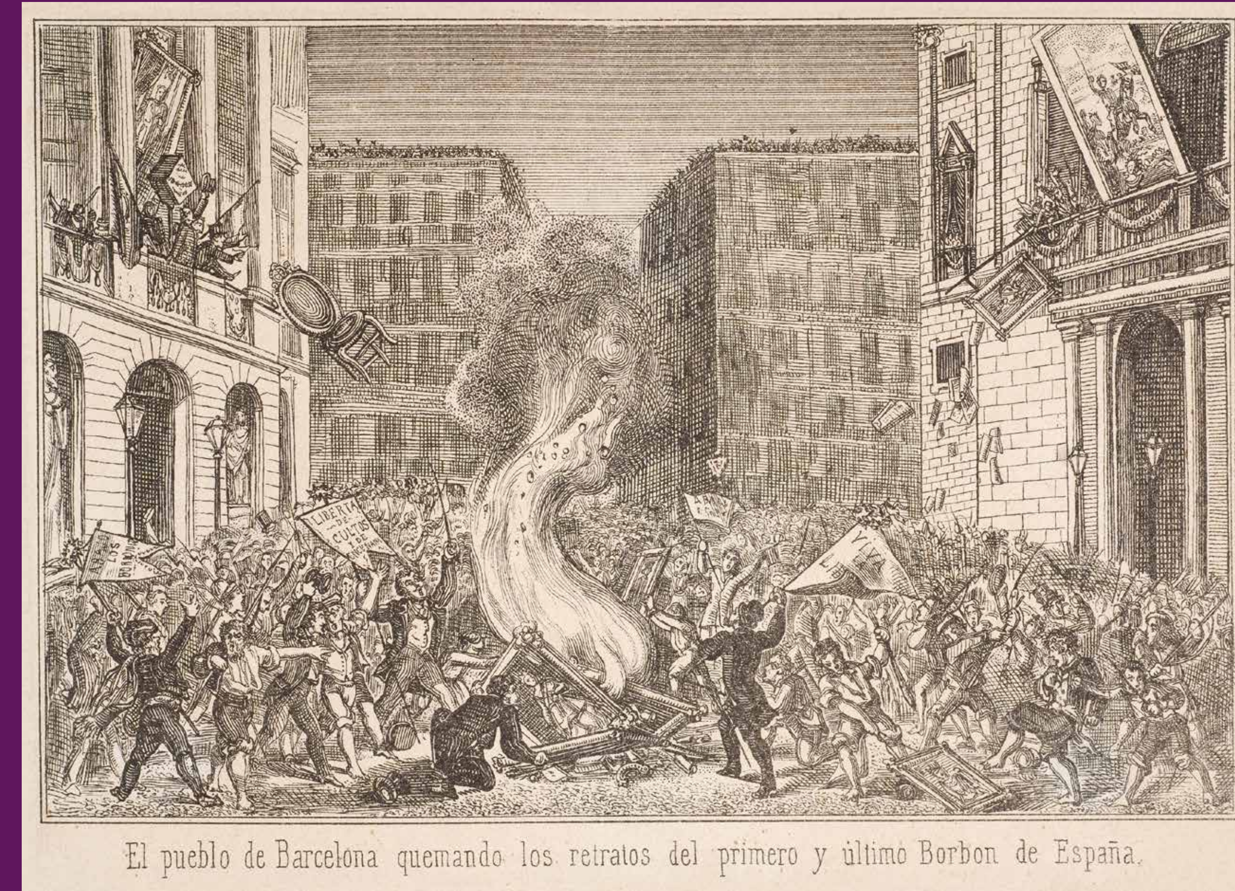
Barcelona, 19 de setembre de 1868 Revoltats cremant retrats del primer i l'últim Borbó —Felip V i Isabel II— a la plaça de Sant Jaume. La Revolució de Setembre o la Gloriosa, és el moviment que acaba amb el regnat d'Isabel II i inicia el Sexenni Revolucionari, que obre una època de llibertats democràtiques, com l'accés per primer cop al sufragi universal masculí.

Tant republicans com carlins evolucionats s'oposen al centralisme , com posen de manifest: l'intent de proclamació de l'Estat Català Federal en el marc de la Primera República espanyola (1873); o la restauració dels furs i la Diputació General de Catalunya feta pel pretendent carlista Carles VII (1874).