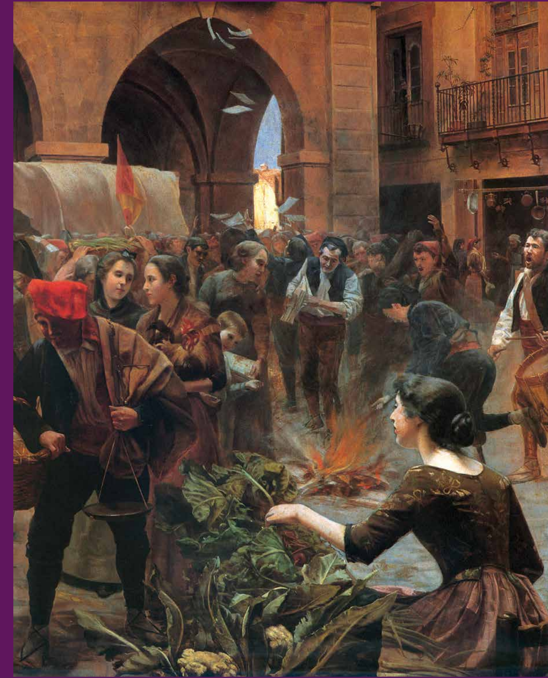
Manresa, 2 de juny de 1808 Quadre de Francesc Cuixart La crema del paper segellat (1895), que representa la crema del paper oficial que l'autoritat napoleònica va imposar a tot el territori ocupat. El mateix dia, els revoltats van constituir la Junta de Govern i Defensa de la Ciutat.