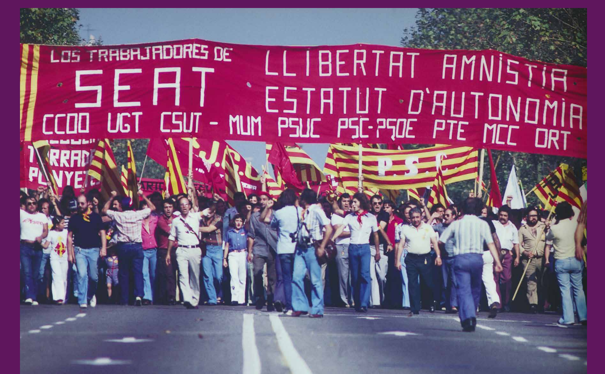
Barcelona, 11 de setembre de 1977 El moviment obrer sorgit durant la clandestinitat franquista, amb un pes fonamental de la nova immigració espanyola, va fer seves les reivindicacions nacionals al mateix nivell que les democràtiques i socials.