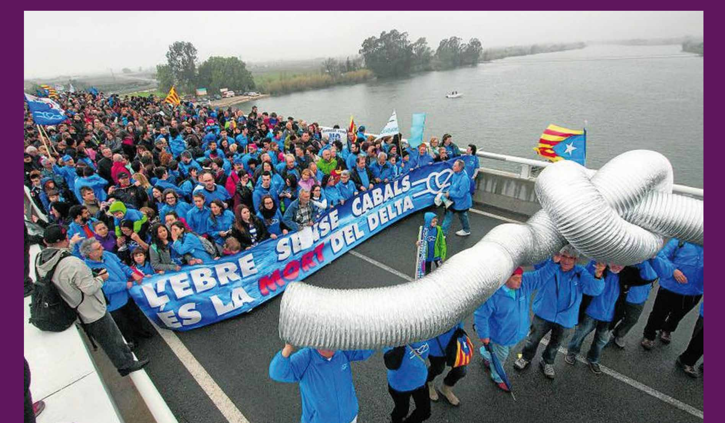
Deltebre - Sant Jaume d'Enveja, 30 de març de 2014 Des del 2000 el moviment en defensa del riu Ebre i d'una nova cultura de l'aigua, enfront la política invasiva i especulativa del govern espanyol, ha representat la mobilització en defensa del territori més massiva produïda mai a Catalunya.