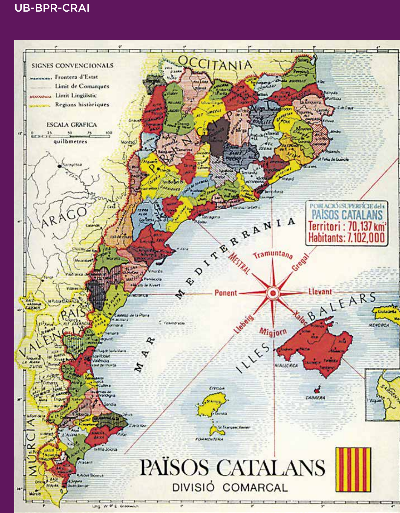
1971 Mapa dels Països Catalans. La reivindicació d'un futur compartit per a tots els territoris de llengua i cultura catalanes va assolir, durant l'oposició a la dictadura franquista, un caràcter hegemònic.