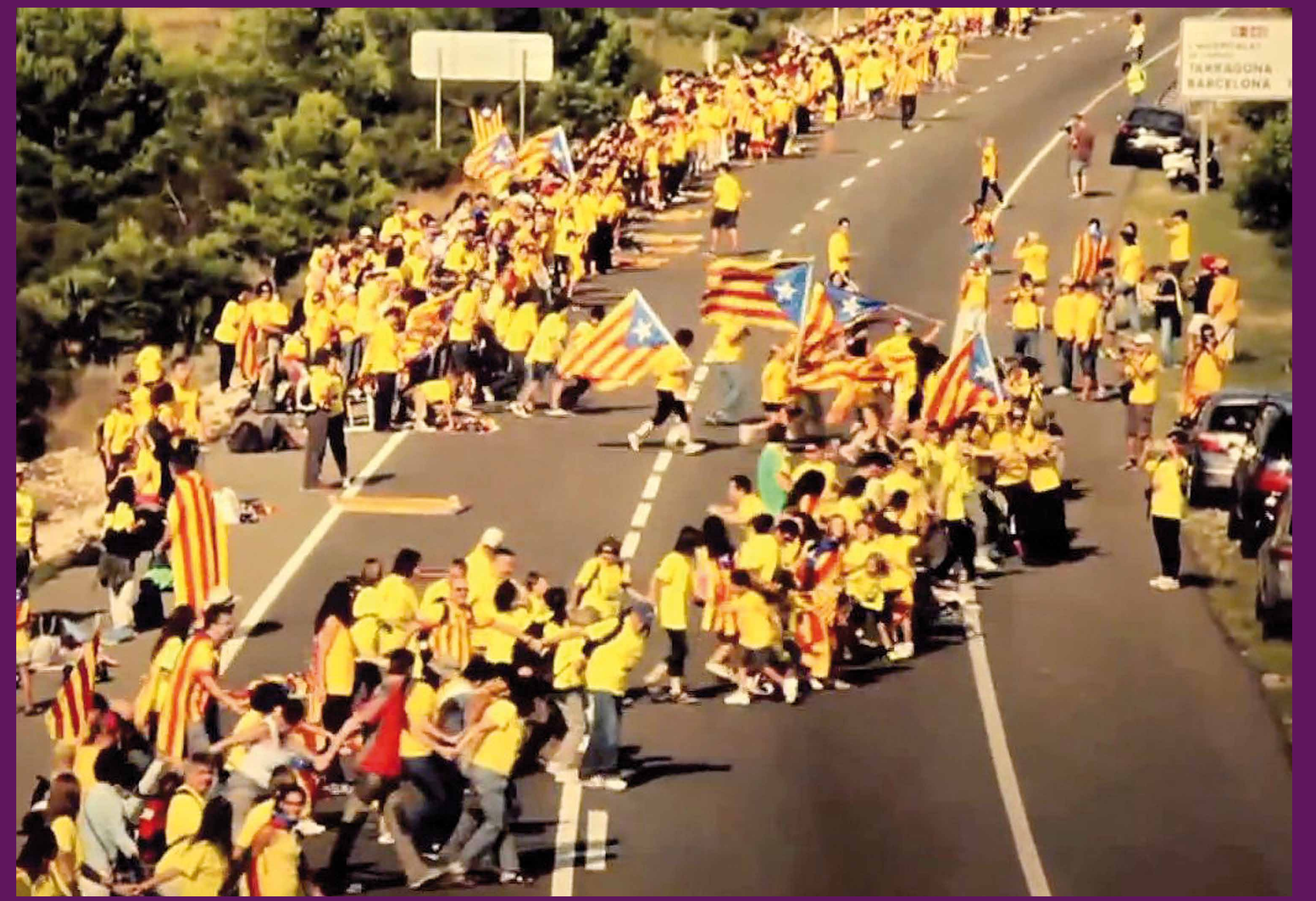
11 de setembre de 2013 Un fragment de la cadena humana que va unir Catalunya del Pertús a Vinaròs reclamant la independència nacional, en una de les mobilitzacions cíviques i polítiques més gran de la història del país.

La crisi i l'austeritat asimètrica imposada per Madrid a les classes populars catalanes, fan que, amb l'esgotament de l'autonomisme i la via morta del federalisme , la societat catalana reaccioni i decideixi que ha arribat l'hora d'exercir el dret a l'autodeterminació . L'ampli consens catalanista permet l'acord per celebrar, el 9 de novembre de 2014, una consulta per tal que el poble de Catalunya decideixi si vol esdevenir un nou estat independent per construir un nou país .