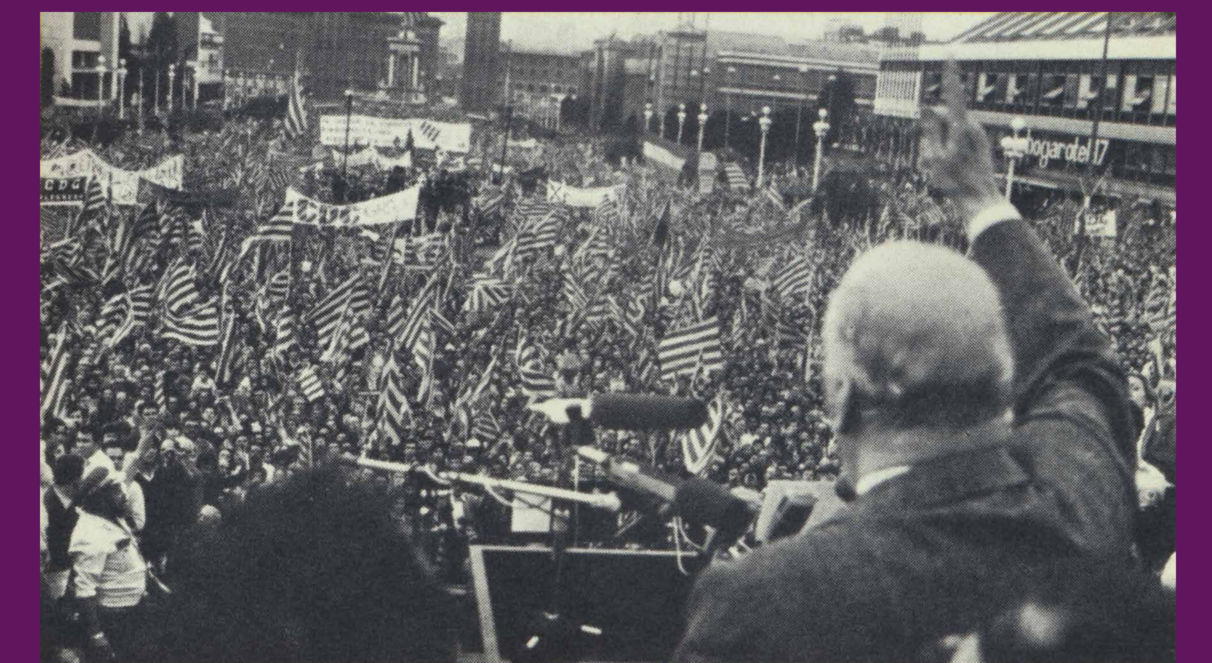
Barcelona, 23 d'octubre de 1977 El retorn de Josep Tarradellas, com a president de la Generalitat, enllaça la legitimitat republicana amb la nova legalitat espanyola, prèvia a la promulgació de la Constitució Espanyola.