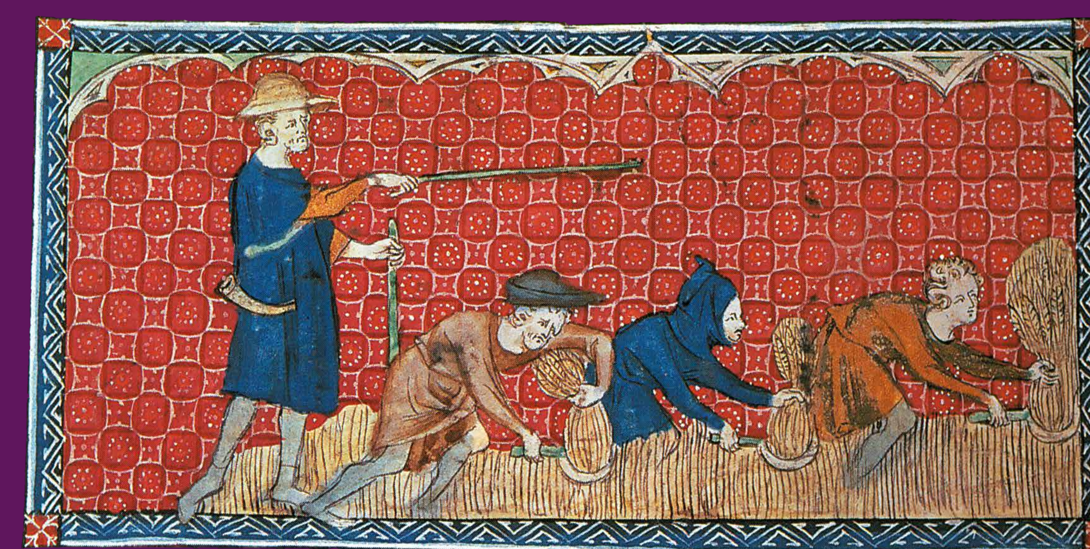
Circa 1300 Senyor feudal i pagesos sotmesos als mals usos.