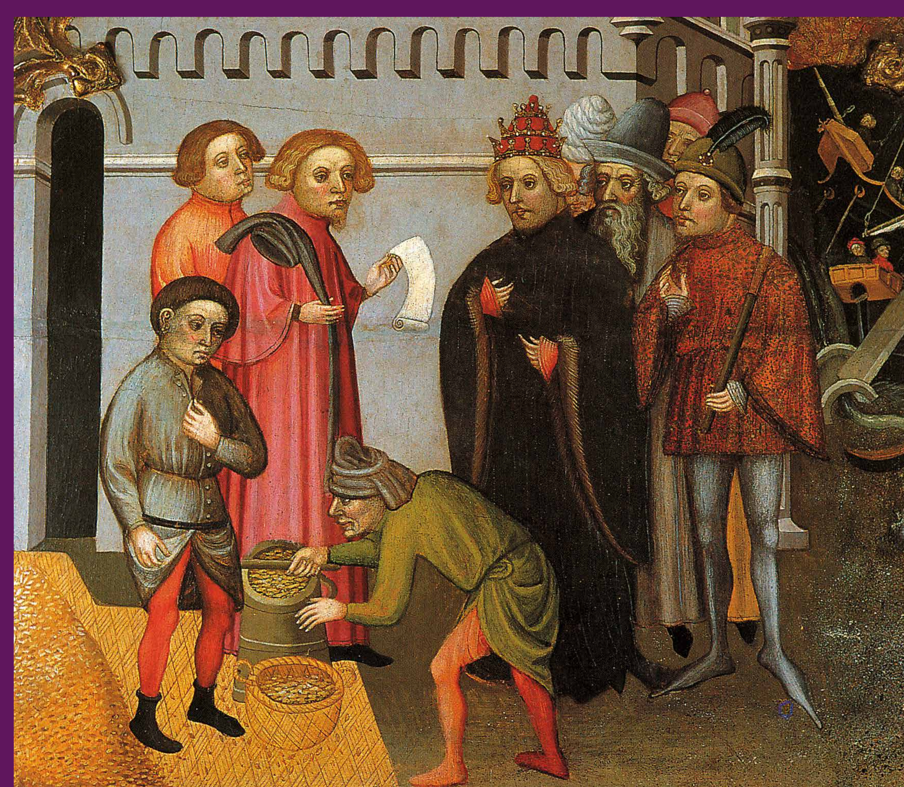
Manresa, 1406 Detall del retaule de Sant Nicolau i Sant Miquel , de Jaume Cabrera, que il·lustra la compra de blat per a la ciutat, per part del rei i els membres de l'oligarquia municipal.