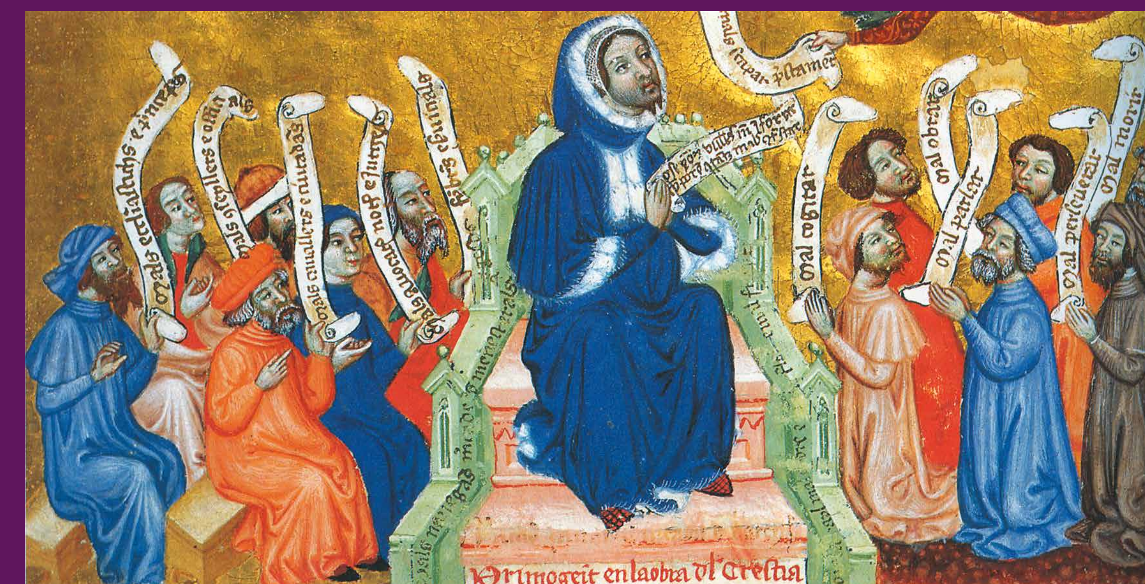
Barcelona, 1484 Consellers i regidors de Barcelona amb el conseller en cap Ramon Savall, en una miniatura de Lo Terç del Crestià , obra de Francesc Eiximenis.