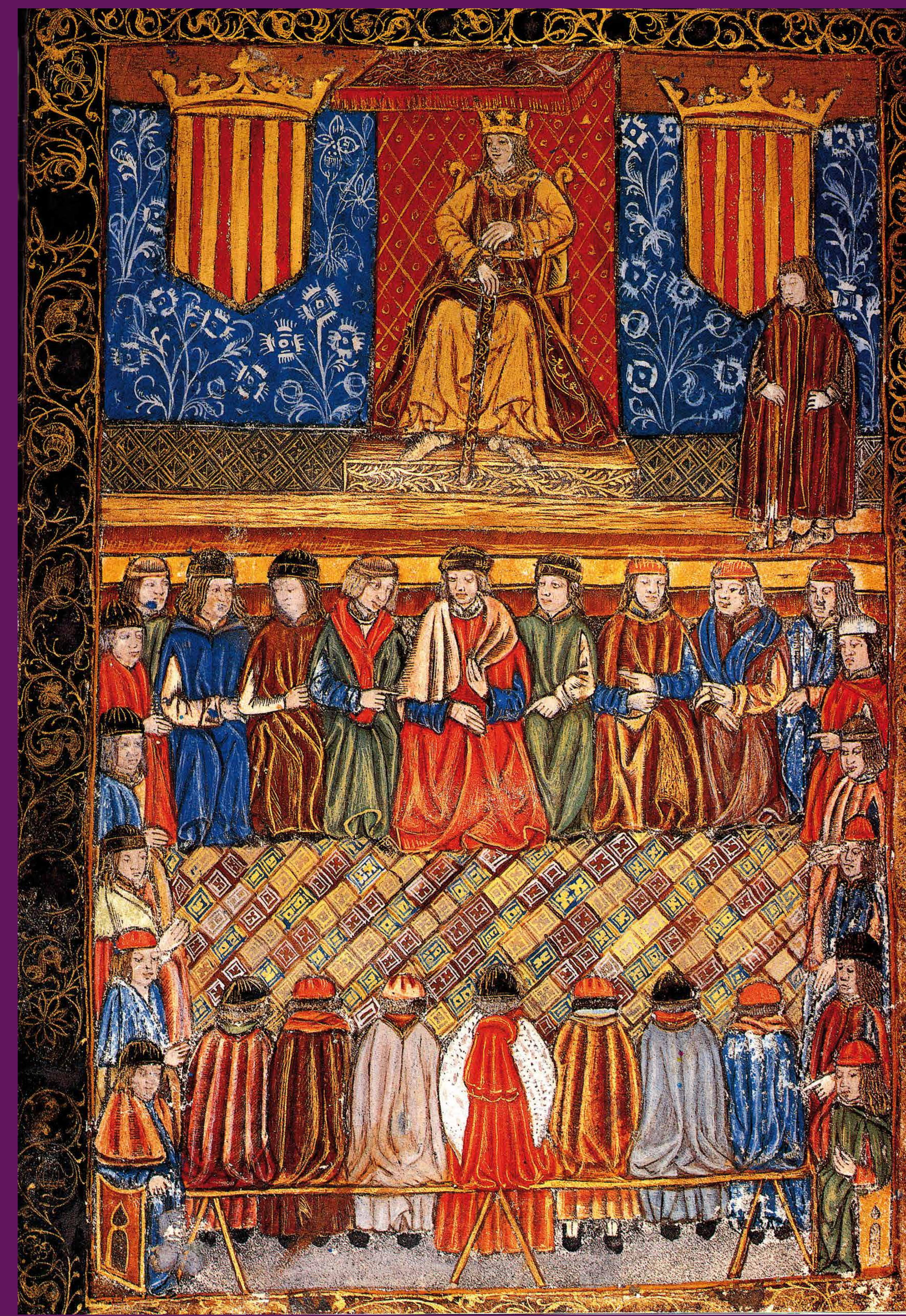
Lleida, 1242 Miniatura de l'incunable Usatges de Barcelona i Constitucions de Catalunya (1495), que representa Jaume I presidint una reunió de les Corts Generals de Catalunya.

Aviat les Corts es doten d'eines de supervisió dels acords. Primer de caràcter temporal i permanents a partir de les Corts de Cervera de 1359 amb la creació de la Diputació del General o Generalitat, un òrgan executiu a cura de la política fiscal i la recaptació de donatius per la Corona de Pere III , en guerra contra Castella i en plena expansió mercantil i militar per la Mediterrània .