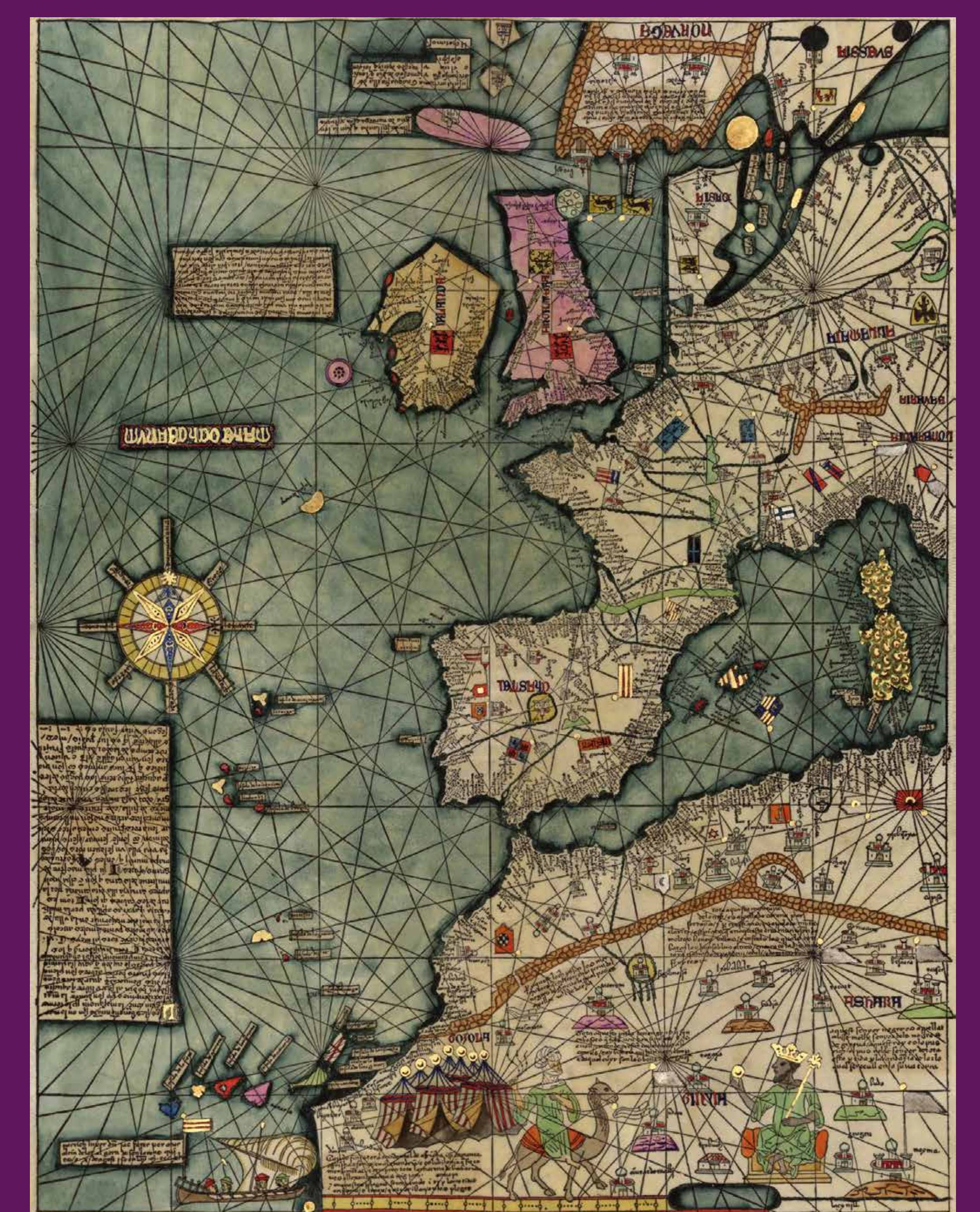
Circa 1375 Atlas Català , obra del cartògraf jueu mallorquí Cresques Abraham. L'escola cartogràfica mallorquina fou de les més importants de l'edat mitjana, fruit de la potència naval de la Corona d'Aragó, que permeté la seva expansió militar i comercial.