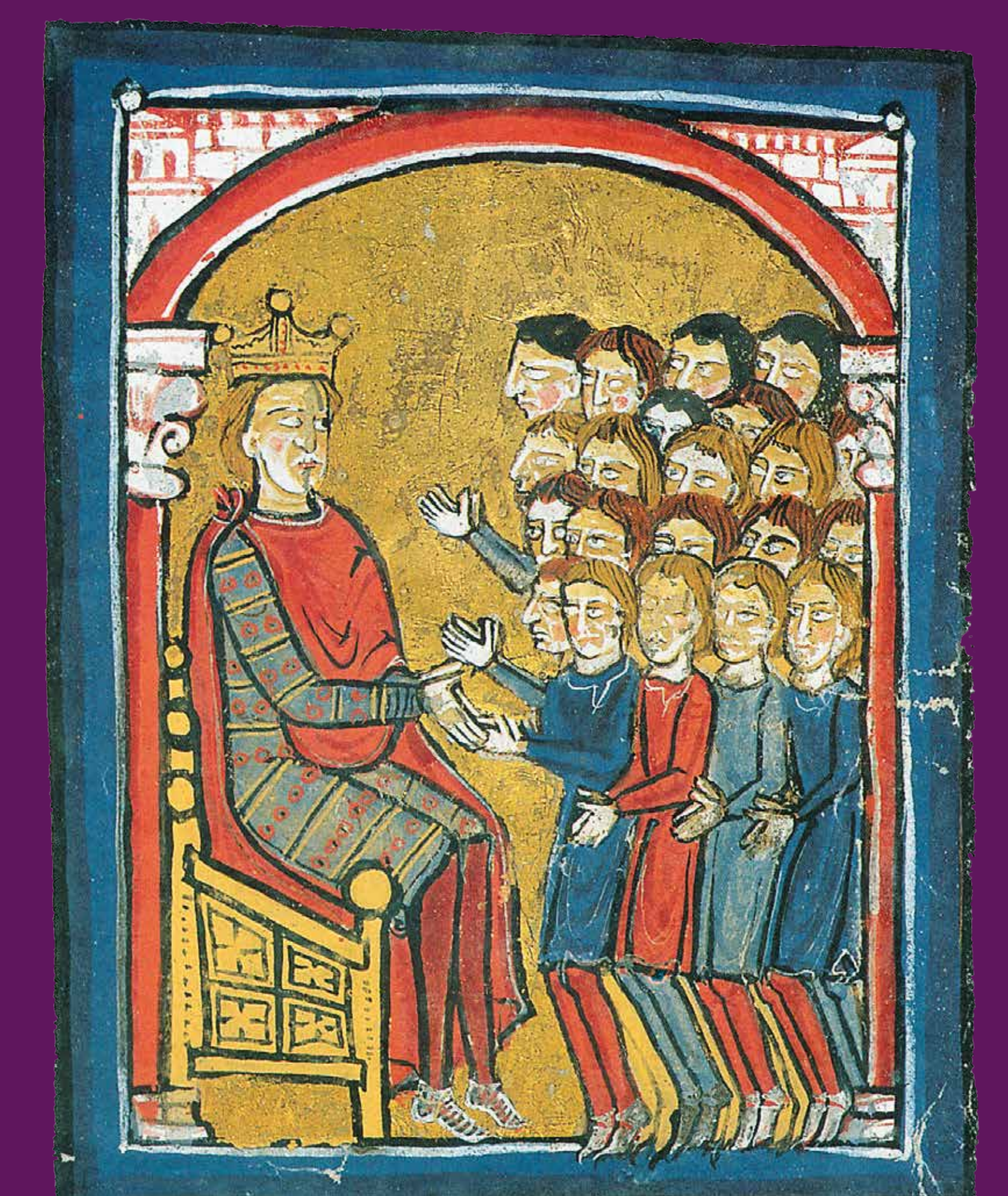
Perpinyà, 1172 Els homes de Perpinyà jurant fidelitat a Alfons I, en una miniatura del Liber feudorum Ceritanie (segle XII-XIII).