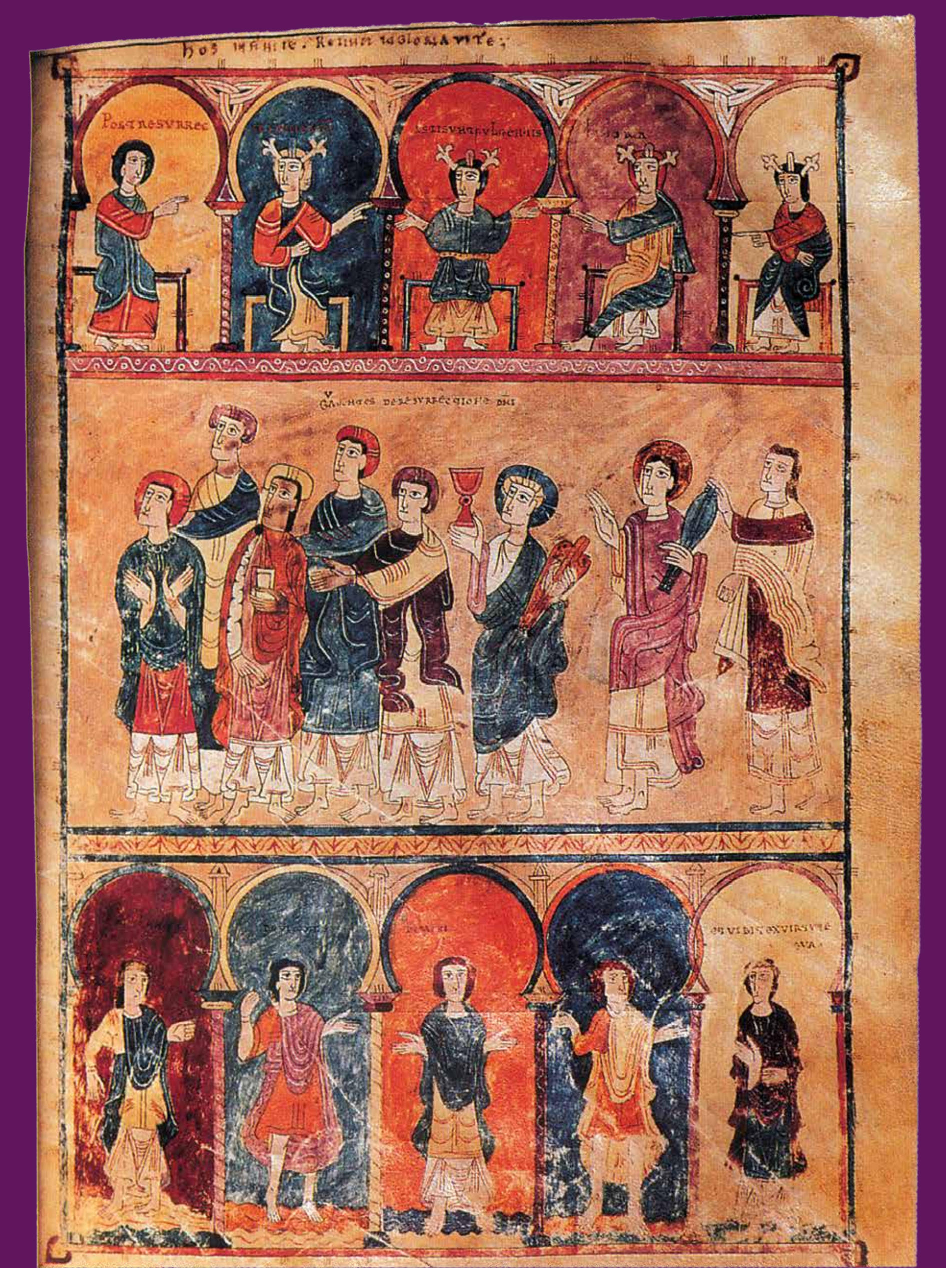
975 Senyors i altres personatges de l'època prefeudal representats al Beatus de Girona . Còpia feta pel prevere Senior del llibre del Beat de Liébana Commentarium in Apocalypsin (776). Les miniatures són obra del prevere Emeteri i la monja Ende.