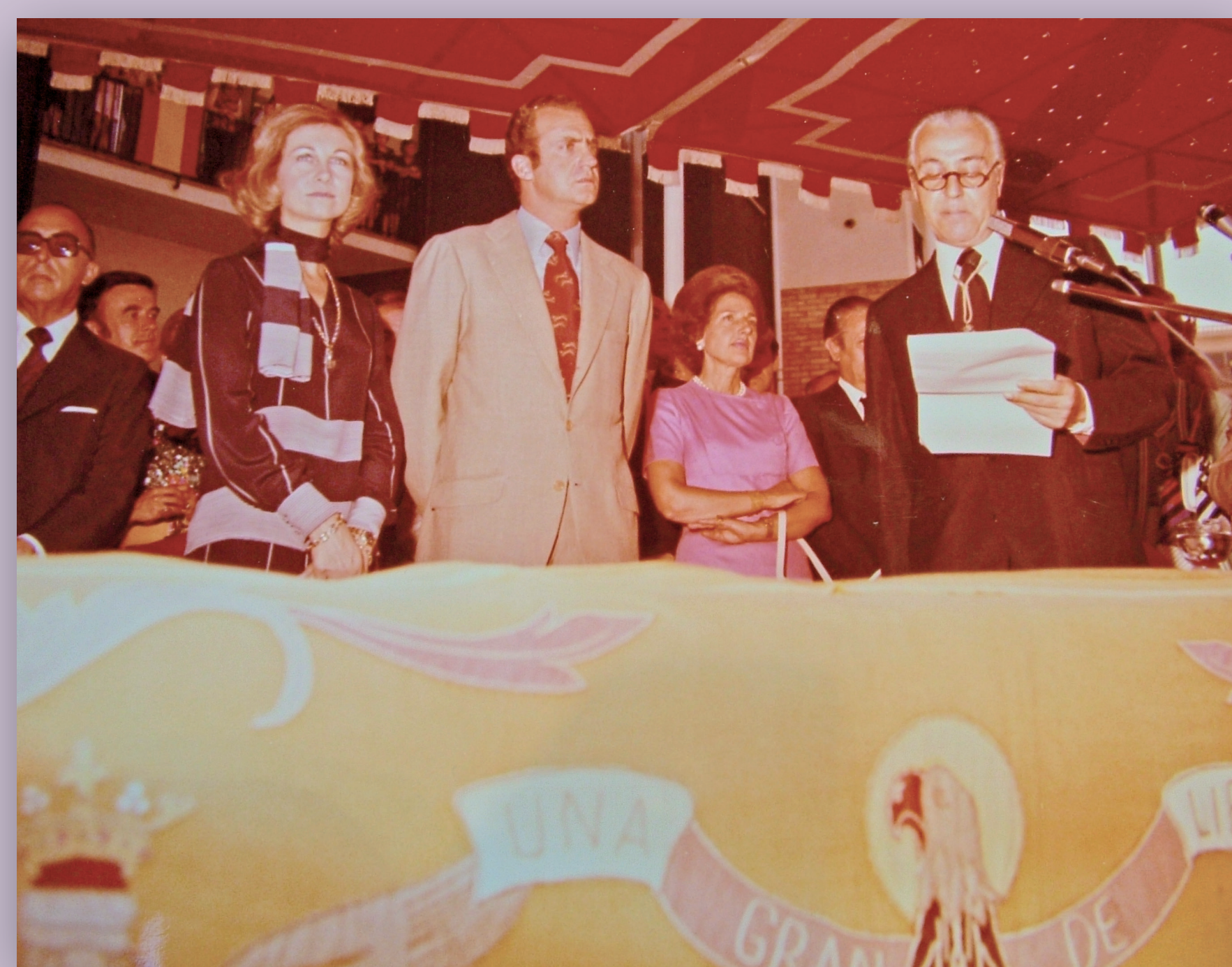
▲ 14 de juliol. Inauguració del barri pel príncep Joan Carles.