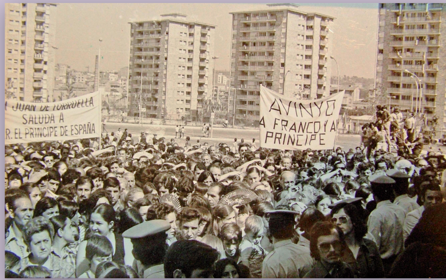
▲ 14 de juliol. Inauguració del barri pel príncep Joan Carles.

lluites, foren la mobilització dels veïns de la Barriada Mion-Puigberenguer per aconseguir la urbanització dels carrers del barri, molts d'ells sense asfaltar; la lluita dels veïns de la Plaça de Catalunya per aconseguir una llar d'infants; la reivindicació dels veïns de la Font dels Capellans davant les nombroses deficiències que presentaven els pisos inaugurats el juliol del 1975 pels aleshores prínceps Joan Carles i Sofia. O la solució a les comunicacions amb Manresa dels barris del Xup i de Sant Pau.