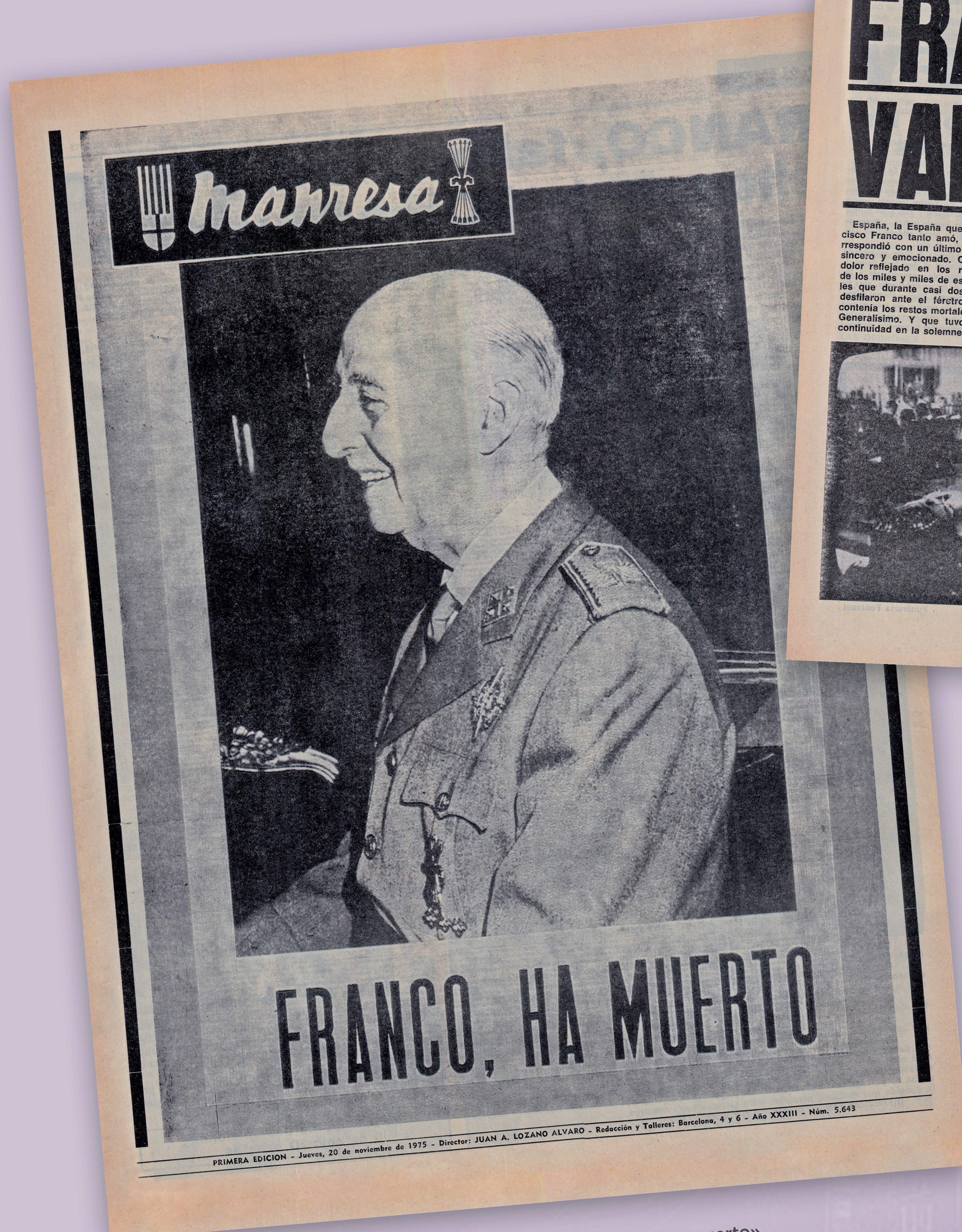
▲ 20 de novembre de 1975. Portada del diari Manresa: «Franco ha muerto».

La repressió franquista s'exercia sistemàticament, prohibint actes, censurant cançons, posant multes i detenint persones. I molts cops amb tortures i presó, com es trobaren diversos militants vinculats al moviment obrer, a l'Assemblea de Catalunya o al Comitè de Solidaritat (1973).