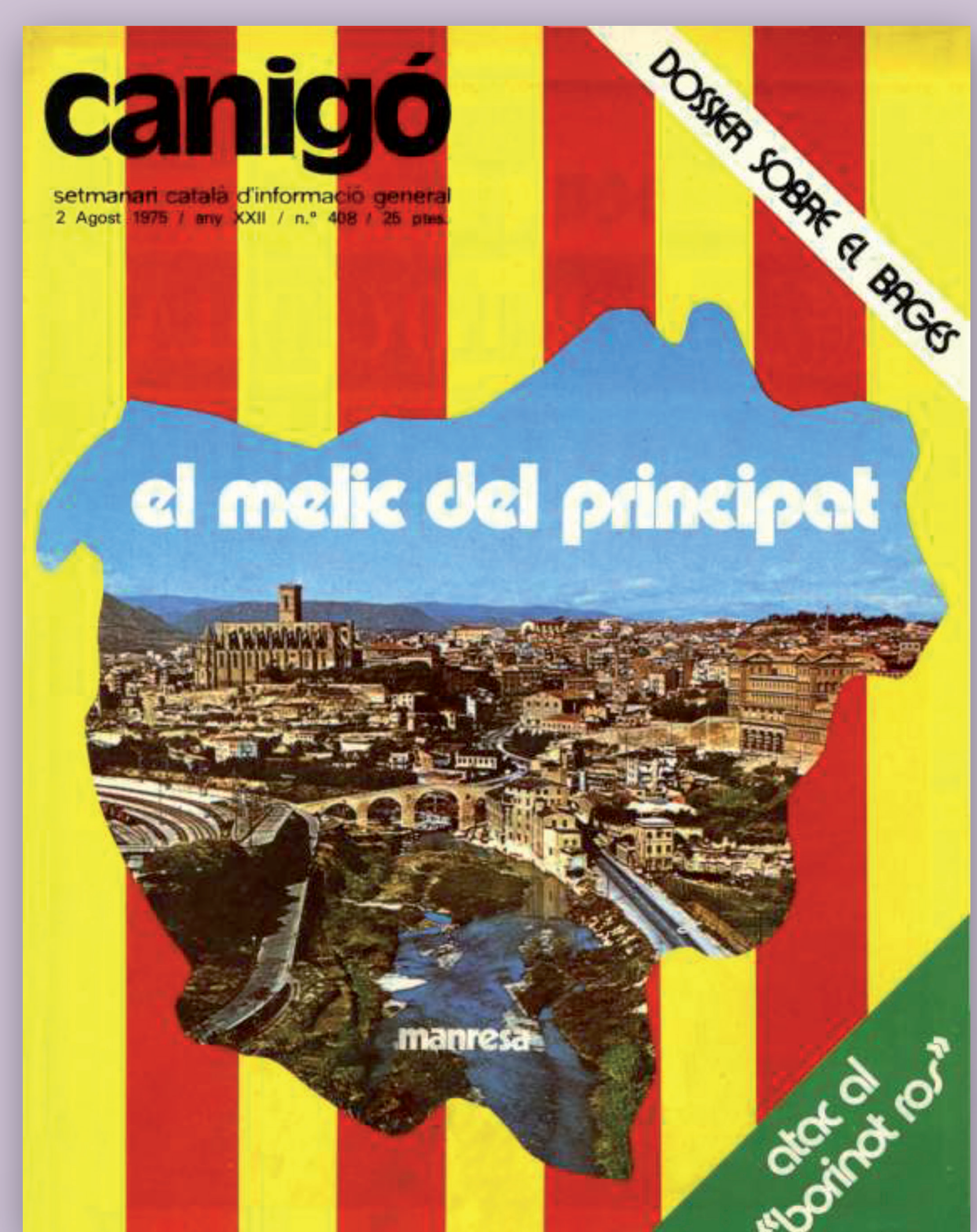
▲ 1 d'agost. Portada del setmanari Canigó, monogràfic sobre el Bages. Hi surten entrevistats o hi signen articles molts impulsors d'entitats i militants de partits clandestins.