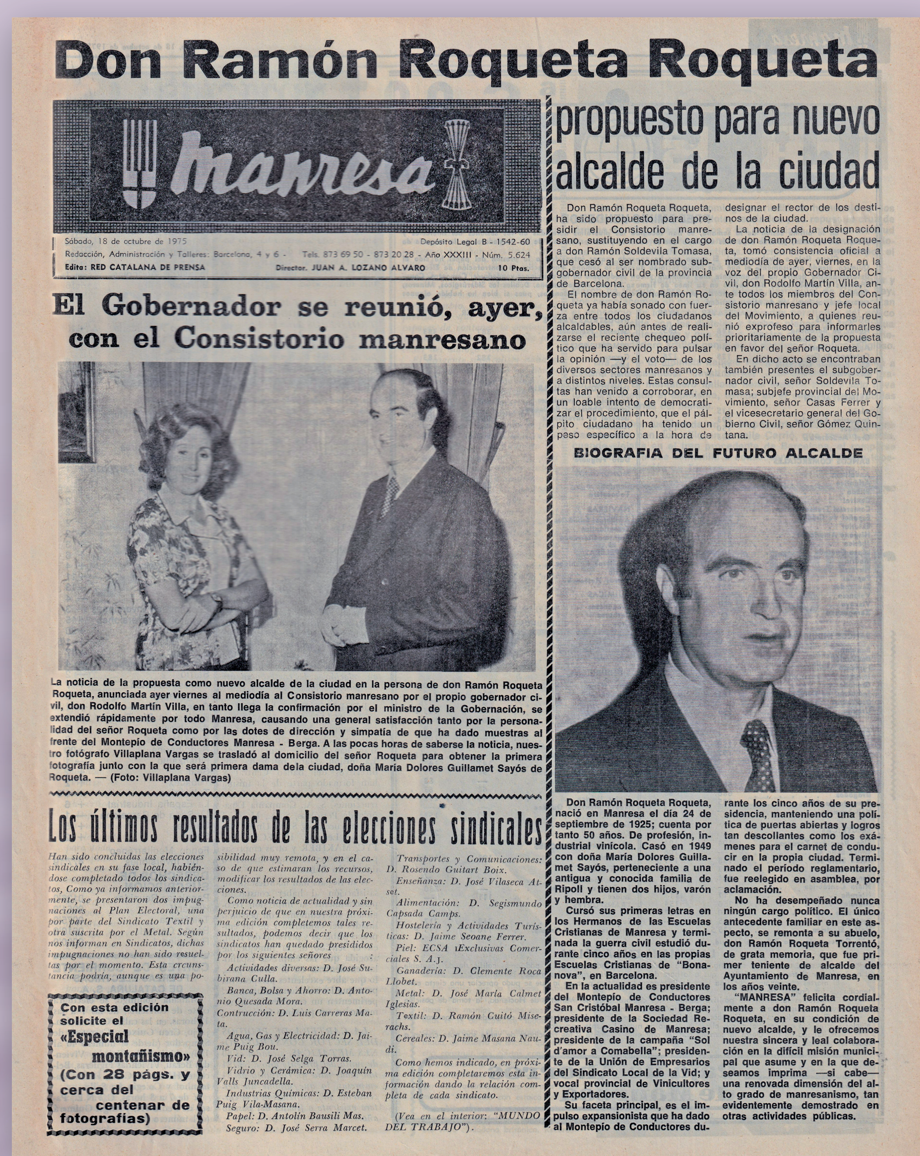
▲ 18 d'octubre de 1975. Informació a la portada del diari Manresa sobre la proposta d'alcaldia per a Ramon Roqueta, que hi seria fins a les eleccions municipals de 1979.