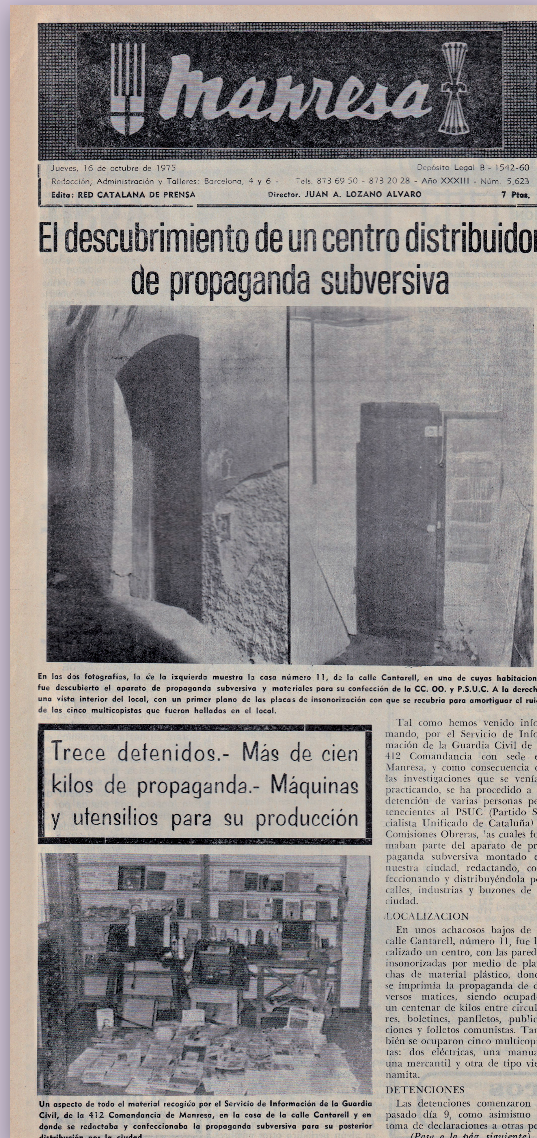
▲ Informació al diari Manresa sobre la detenció de militants del PSUC, CCOO, Plataformes capitalistes i membres de l'HOAC, JOC i USB el 9 d'octubre de 1975. Alguns van ser torturats a la caserna de la Guàrdia Civil. La portada del diari Manresa és molt posterior als fets.