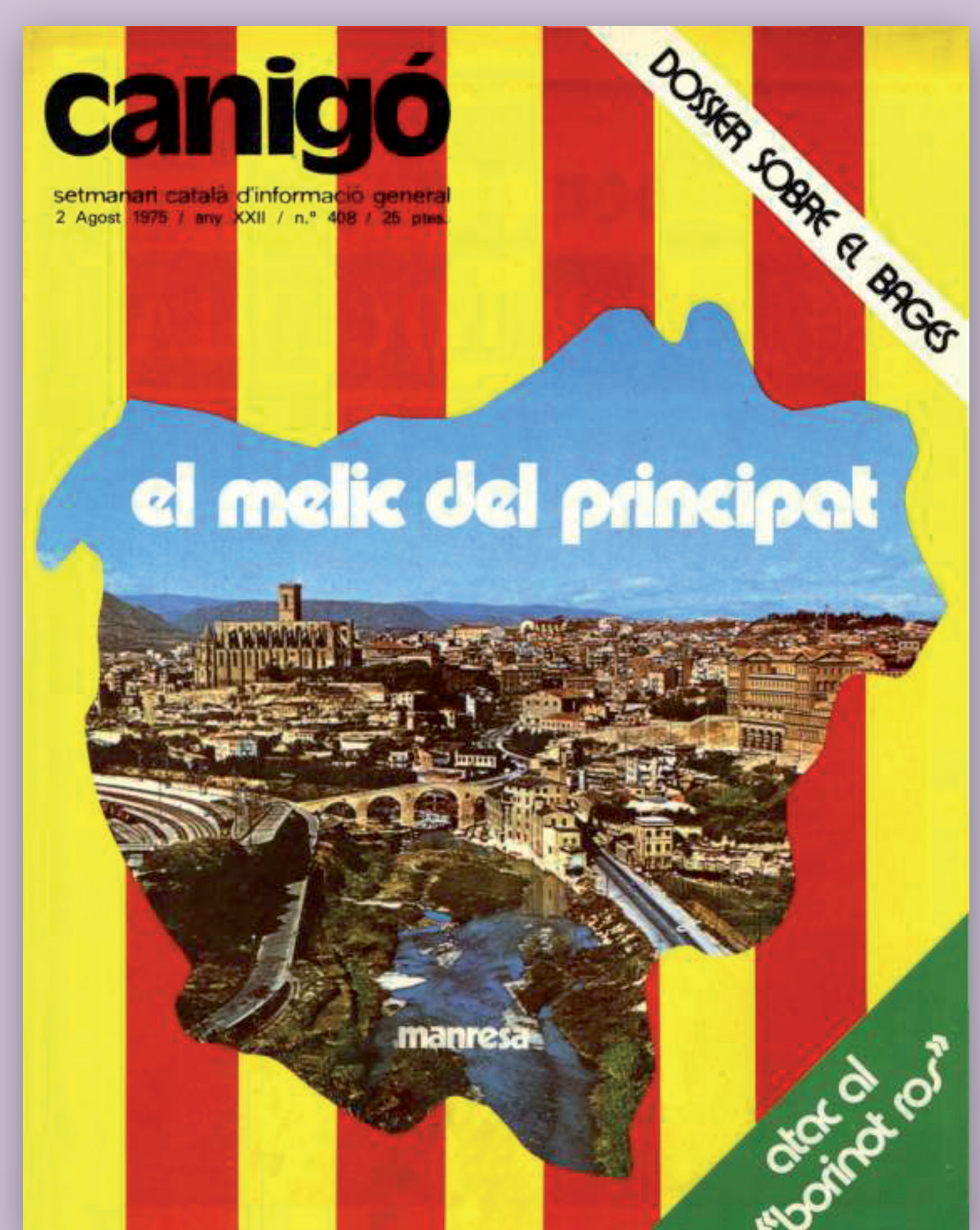
▲ 1 d'agost. Portada del setmanari Canigó, monogràfic sobre el Bages. Hi surten entrevistats o hi signen articles molts impulsors d'entitats i militants de partits clandestins.