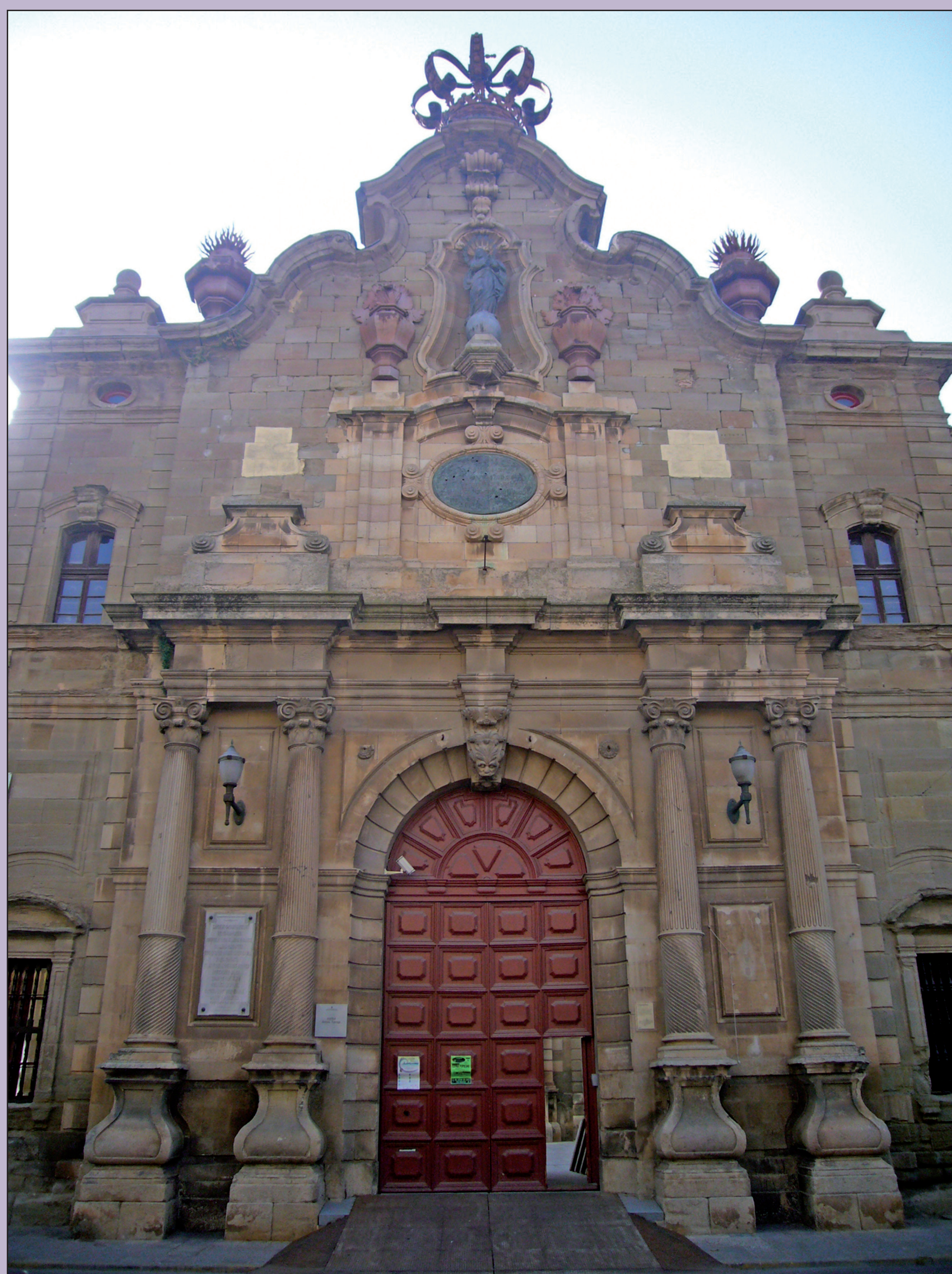
Imatge de la façana de la Universitat de Cervera