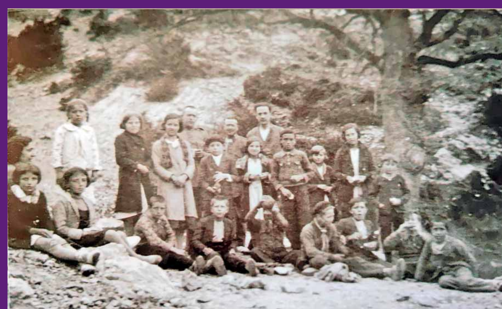
Gombren, 1935 Sortida dels alumnes de l'escola al rovre de la font del Raig.