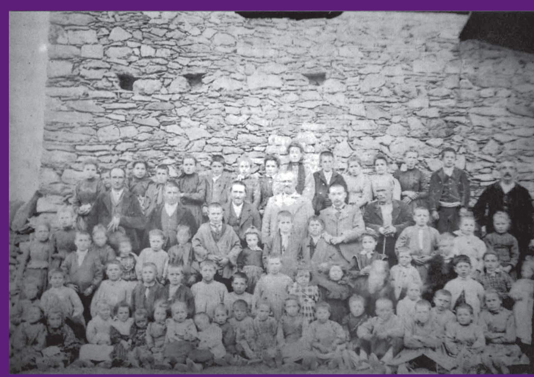
Campelles Escolars abans de la Guerra Civil.