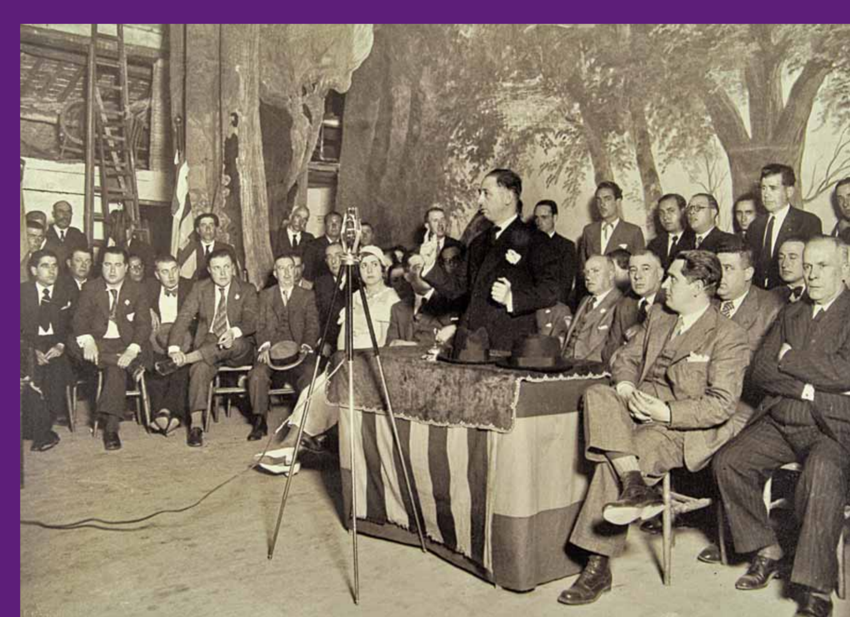
Ripoll, 27 de maig de 1934 Miting de Lluís Companys al Teatre Comtal, amb Xavier Casademunt en primer pla i de perfil. Fundació Irla